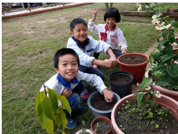
花生栽種體驗課程活動照片