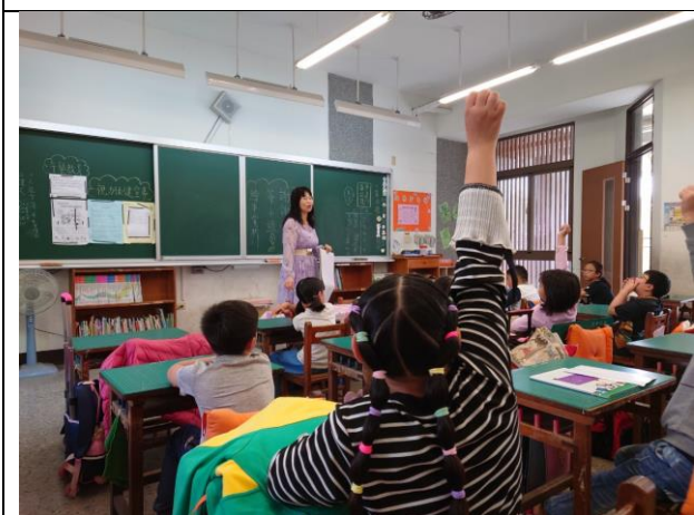
繪本內容討論與發表