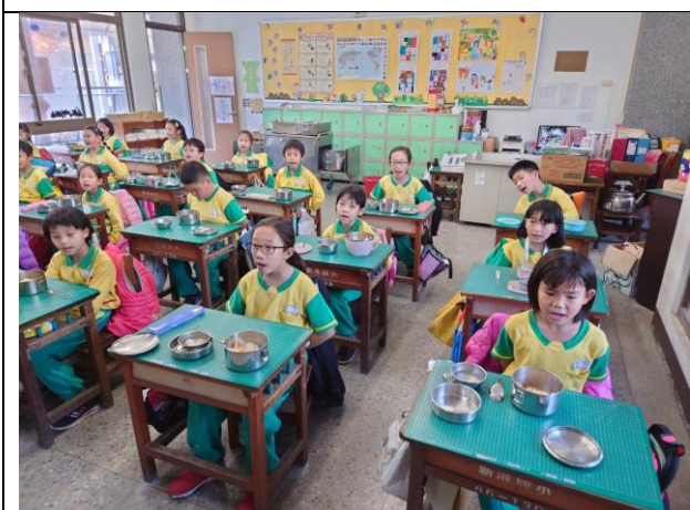
學生午餐前朗誦感恩詞