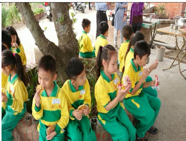
享用農場自製的美味茶點