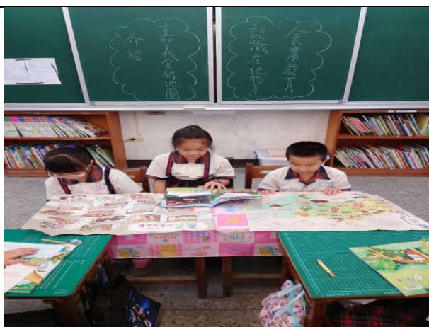
引導學生認識在地物產