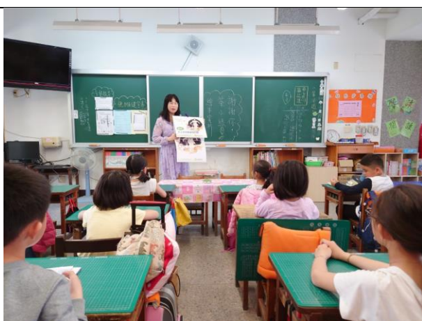
「謝謝你，茶小綠」繪本賞析