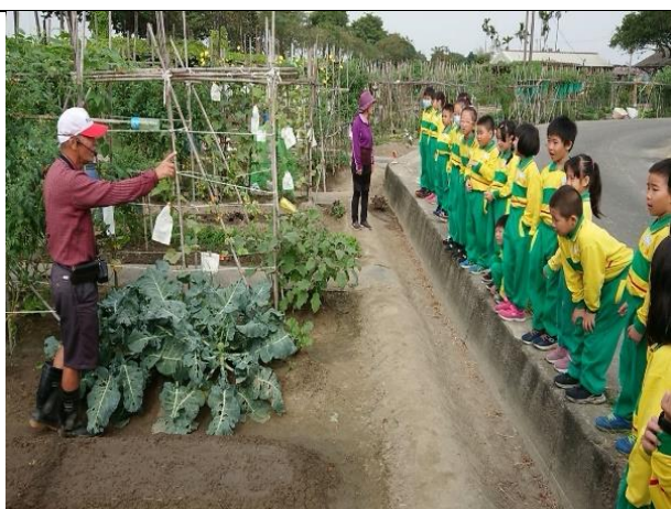
有機蔬果栽種介紹