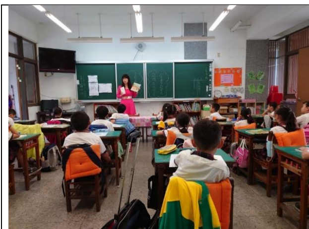
「嘉義食材地圖」介紹