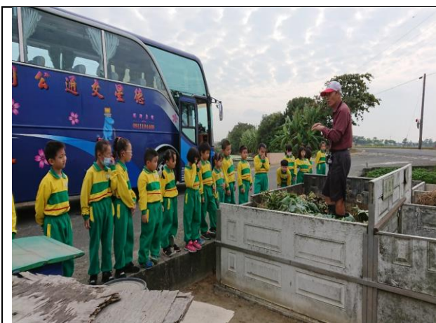
二分之一農場堆肥場導覽