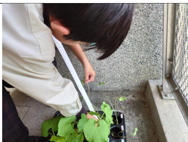
用尺量豆子長大的情形