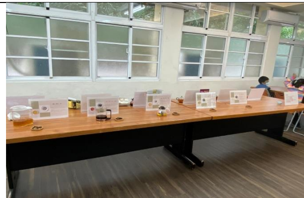
桌上有各種茶葉等我們去品嚐