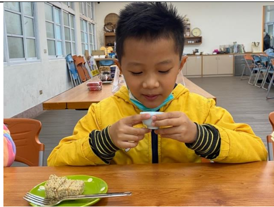
喝茶時先輕輕的把茶端起來