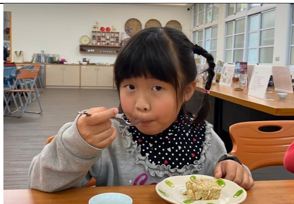
慢慢的把蛋糕送入口，品嚐味道。