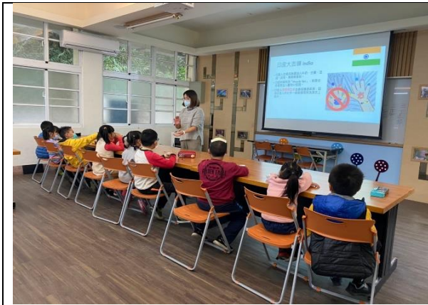
老師講述印度忌諱用左手喝茶。