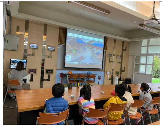
透過 GOOGLE 地圖找尋世界茶地圖