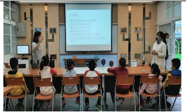
說說看你喝的茶給你的感覺