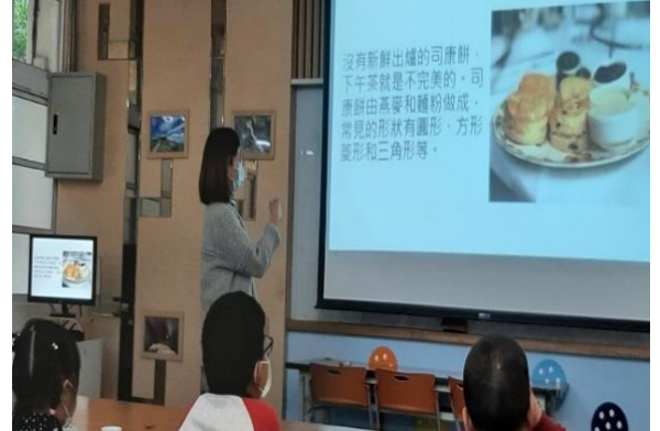
英國下午茶通常會搭配甜點