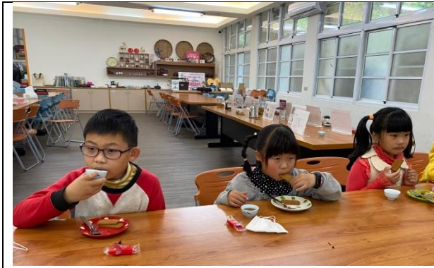
我是茶禮王子與公主