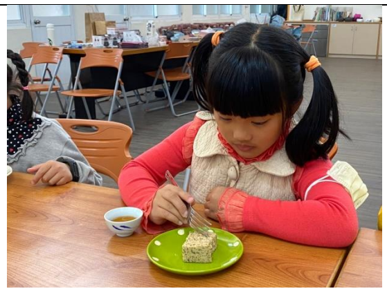
專心的注視眼前的茶點。