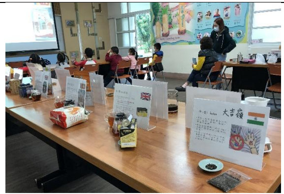
桌上有各種茶葉等我們去品嚐