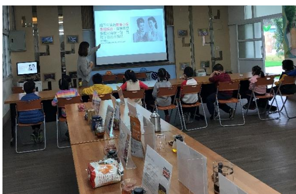
喝下午茶時不可以翹著小指喔