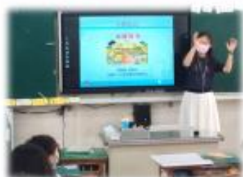
劉梅蘭教授-食農教育宣導