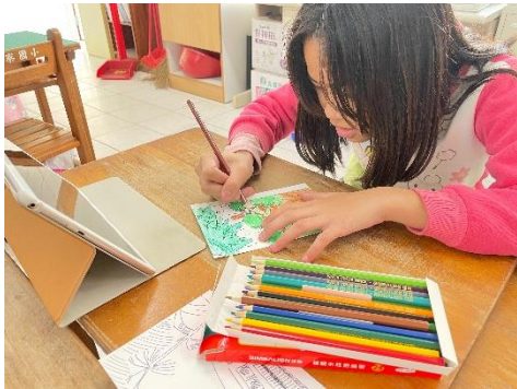
學生善用媒材與技巧完成手繪明信片