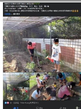
定期於學校粉絲專業分享教學成果