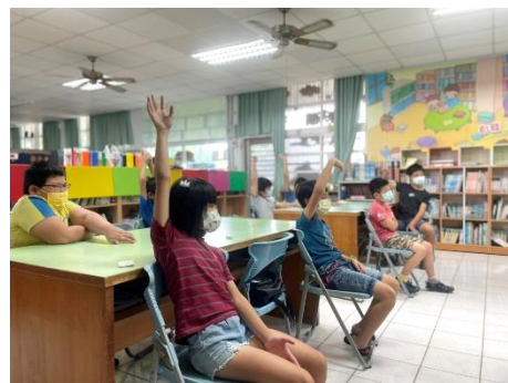
學生非常積極踴躍參與討論與問答