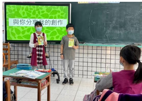
學生上台大方分享，台下學生給予回饋