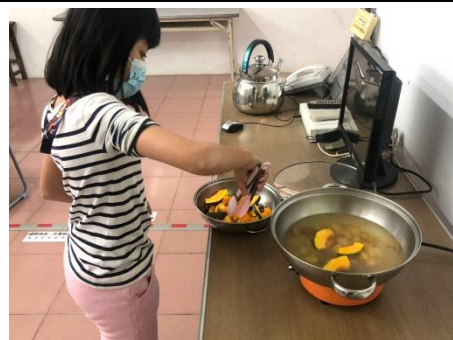
學生用南瓜與排骨熬煮湯頭