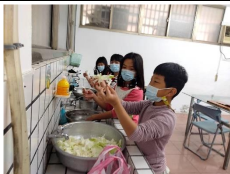
將採收到的蔬菜用水清洗乾淨