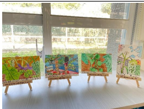
將學生的作品進行公開展覽