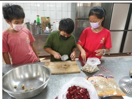
學生分工合作製作洛神花果醬