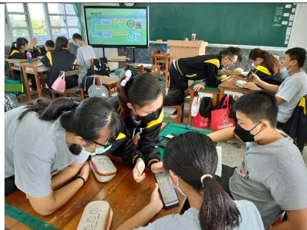
說明：學生填寫學習單