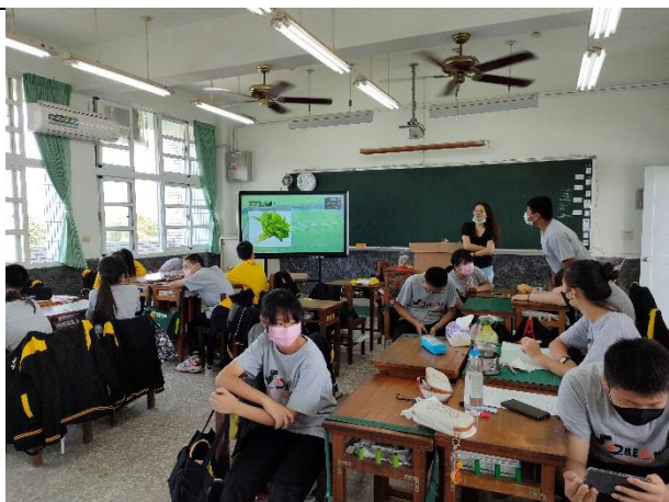
說明：進行牌卡遊戲