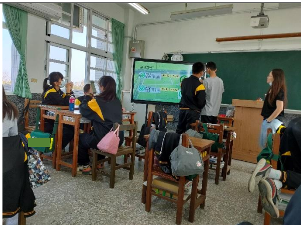
說明：學生掃描 QR code 查詢產銷履歷