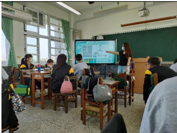
說明：使用「教育部校園食材登錄平台」查詢午餐食材來源