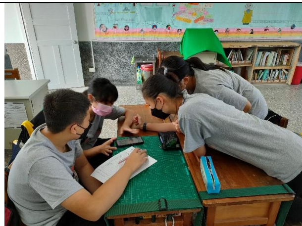
說明：學生填寫午餐菜單、食材