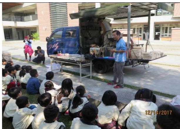
在爆米香開始前先說明過程及注意事項