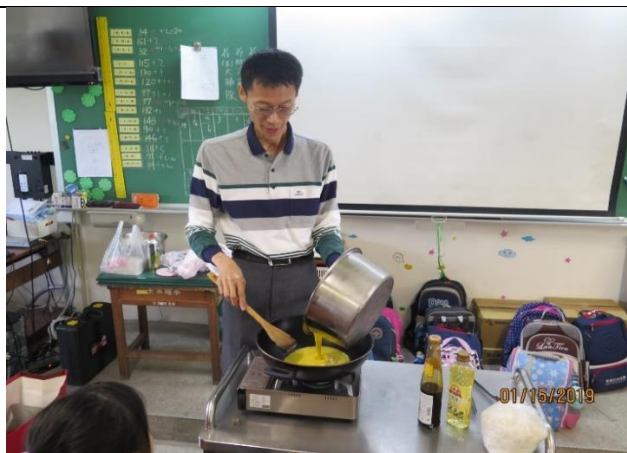
家長為孩子示範素炒飯