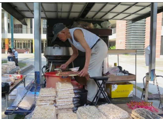
阿伯現場爆米香，讓孩子見識古早味的點心