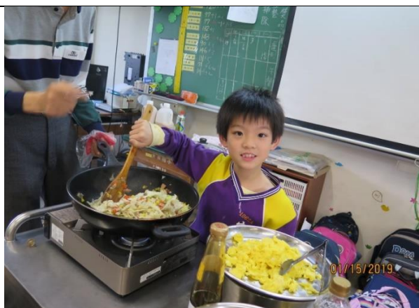
家長讓孩子親自體驗自己動手炒飯