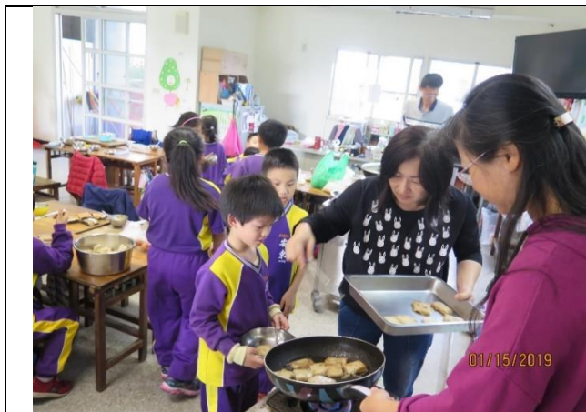
家長為孩子示範煎蘿蔔糕並說明注意事項