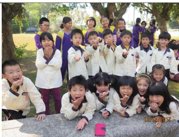
現場剛爆好的米香最好吃