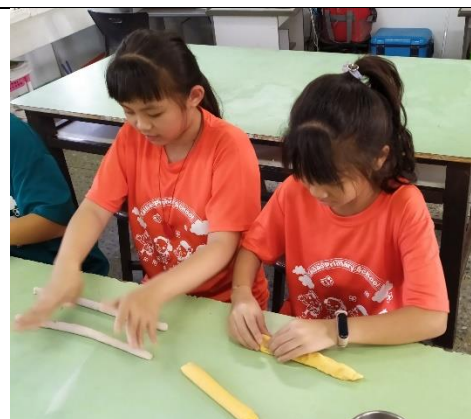
學生製作地瓜圓麵團