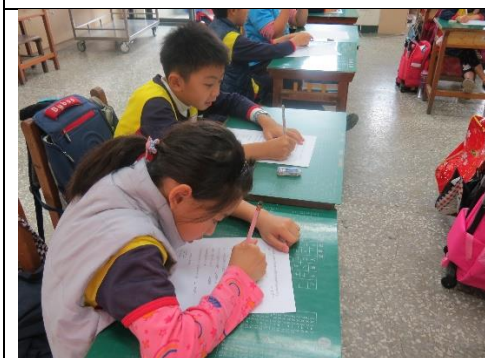
討論後撰寫學習單