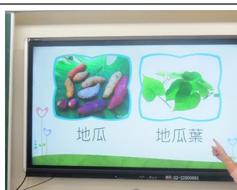
使用<人親土親憨吉鬆又甜>PPT 教學