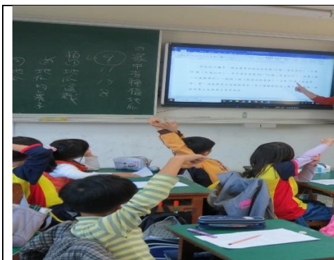
帶領學生閱讀 <地瓜地瓜我想認識你>