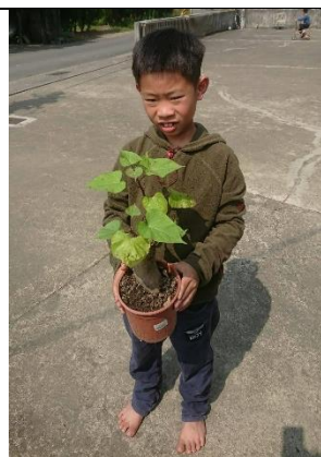
學生觀察家中所種地瓜並自行重成 盆栽。