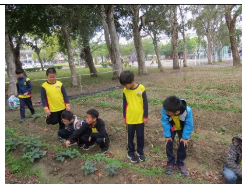
校園小菜圃觀察地瓜生長情形