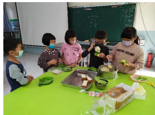
快點！我也要製作沙拉啦！