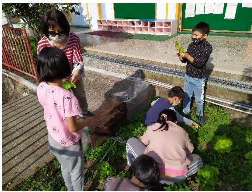
選好目標，準備摘菜