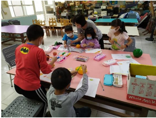
選好水果，看果畫果