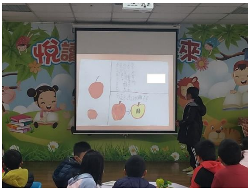
學生上台報告挑選水果之要點