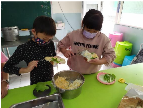
比賽蔬菜沙拉吐司的厚度哦！