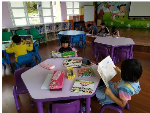
好安靜哦！喜悅閱讀