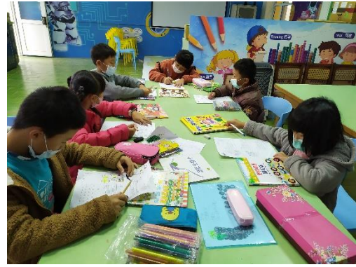
在雙e教室內繼續完成閱讀單與著色