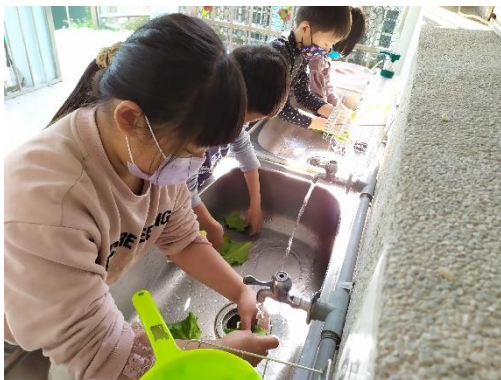
清洗福山萵苣蔬菜