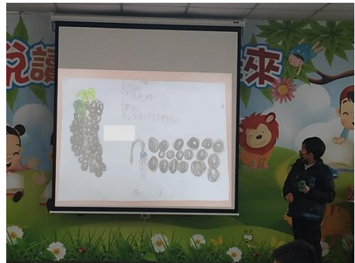
學生上台報告挑選水果之要點