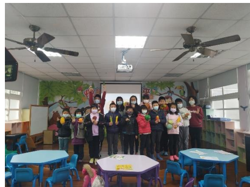
全校學生一起參與蔬果小達人活動