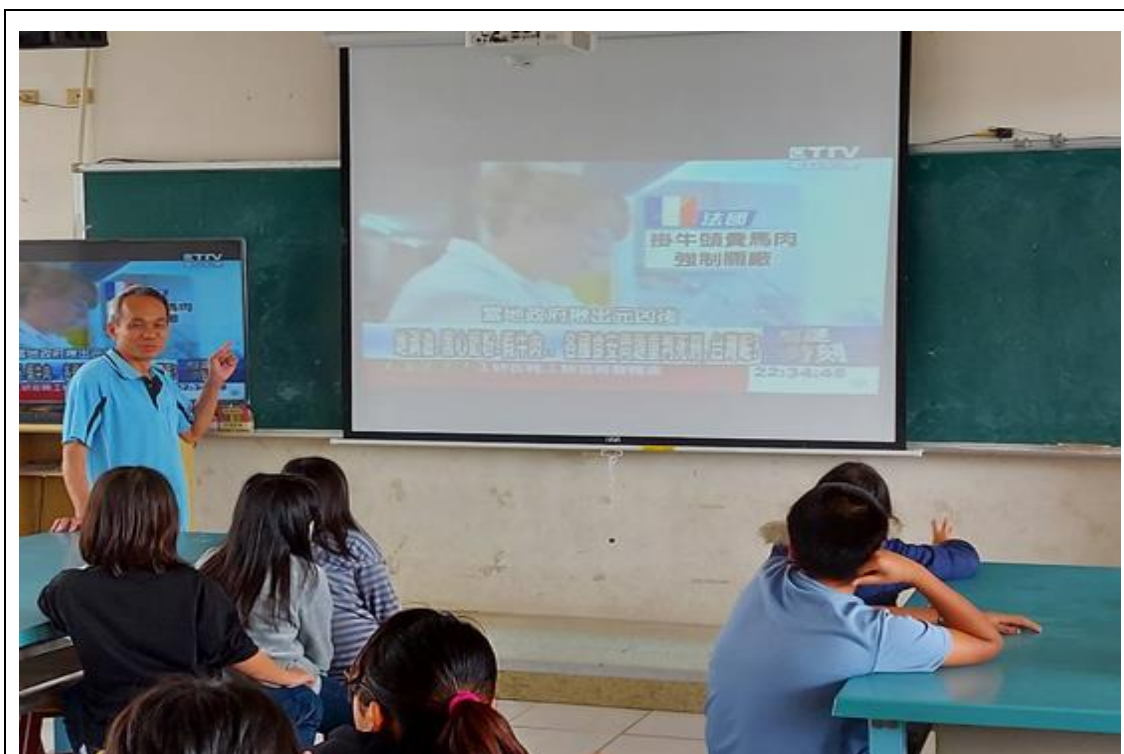
圖 1：食安影片欣賞與講解~1。