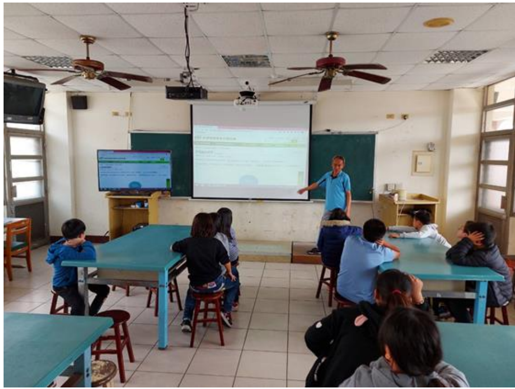
圖 3：產銷履歷農產品資訊網介紹~1。