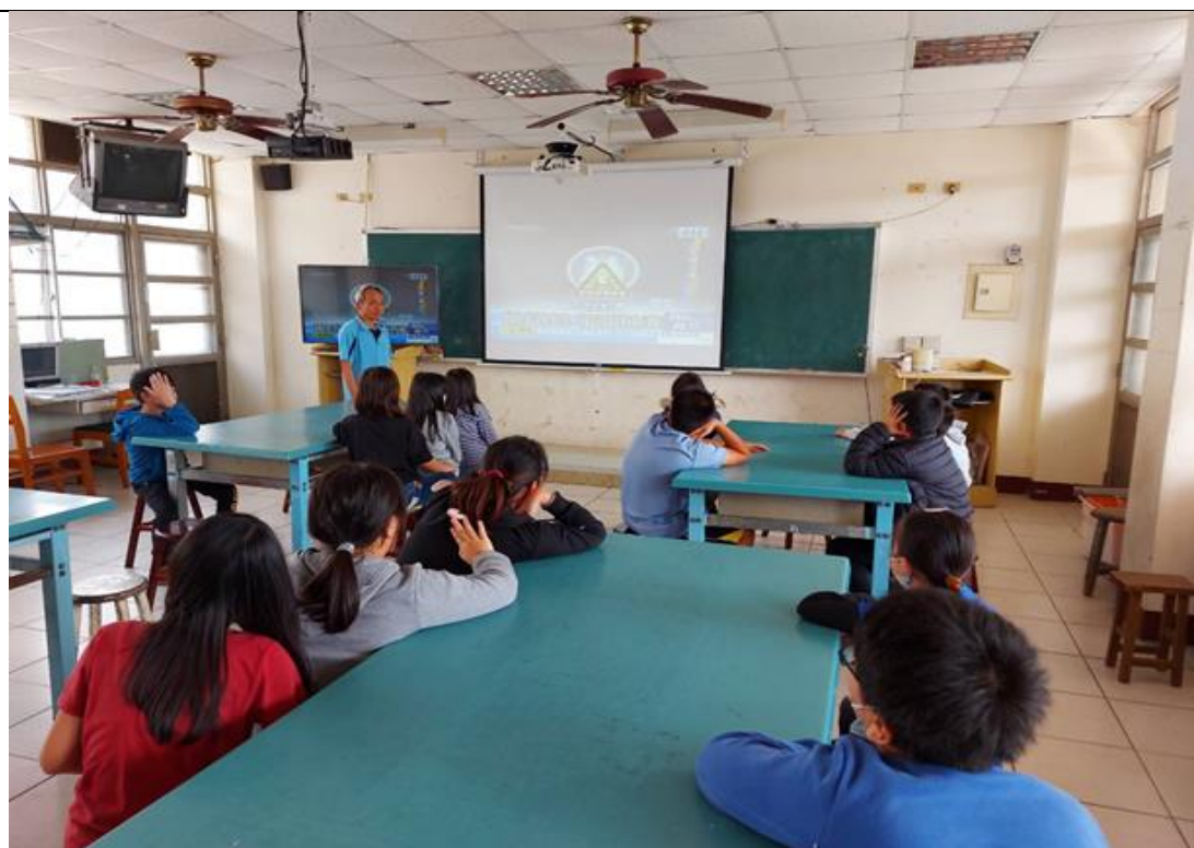
圖 2：食安影片欣賞與講解~2。