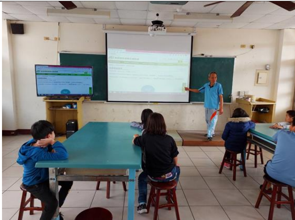
圖 4：產銷履歷農產品資訊網介紹~2。