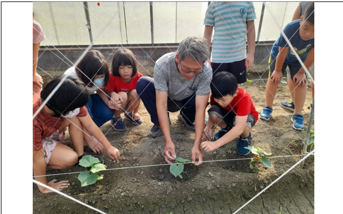
引導孩子藉由觸感了解小黃瓜嫁接（南瓜、小黃瓜）葉面粗糙程度不同