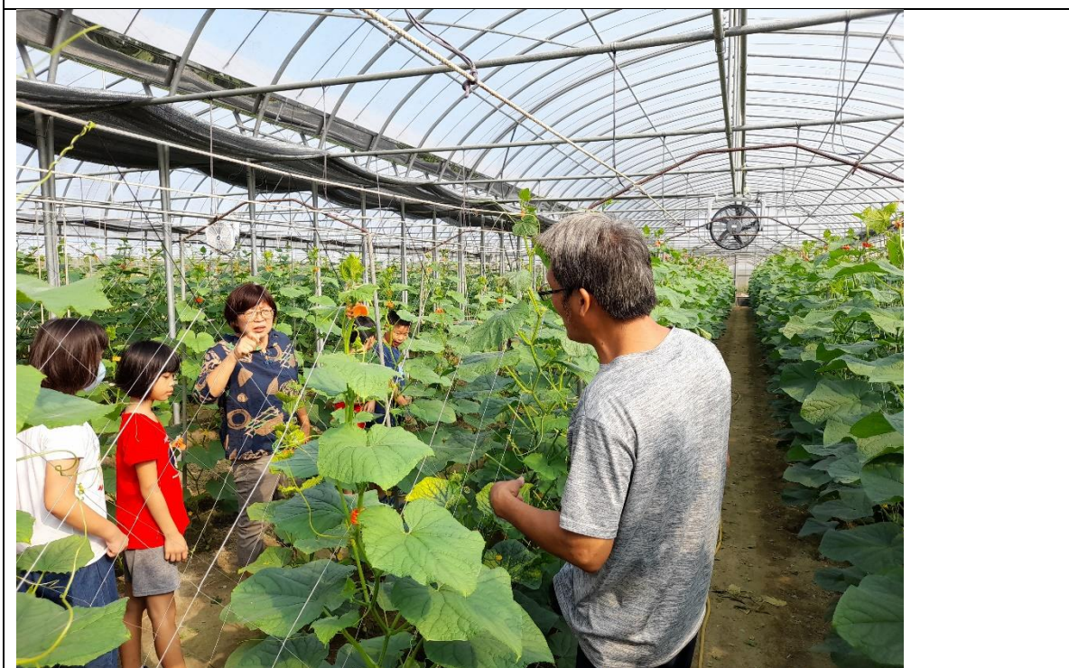
學生在家長溫室觀察小黃瓜生長情形