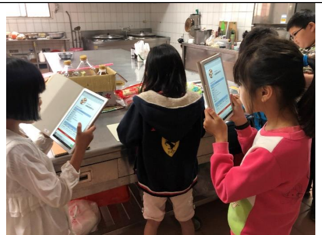
小廚師親自下廚煎蛋，老師指導。