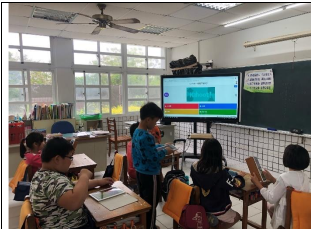
使用平板操作線上題庫 Kahoot!，進行前後測，診斷學生學習效果，根據線上統計結果，再給予學生觀念澄清。