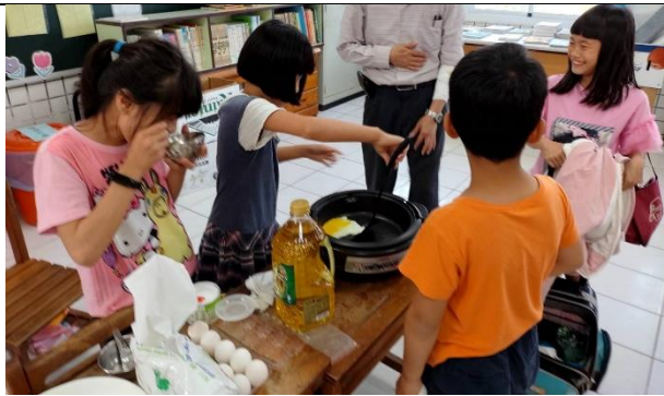
小廚師親自下廚煎蛋，老師指導。