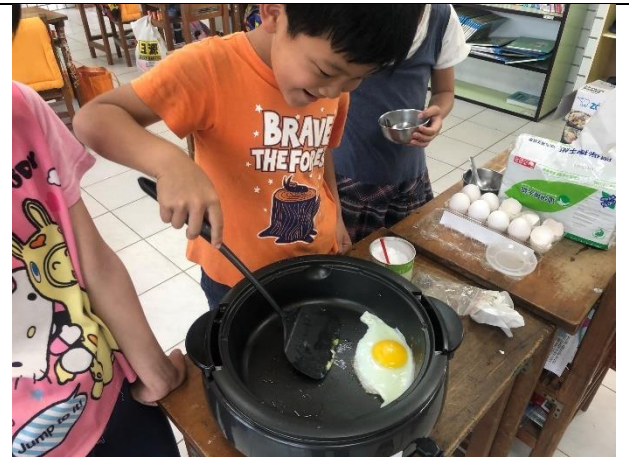
小廚師一步一步嘗試，體驗下廚的樂趣。