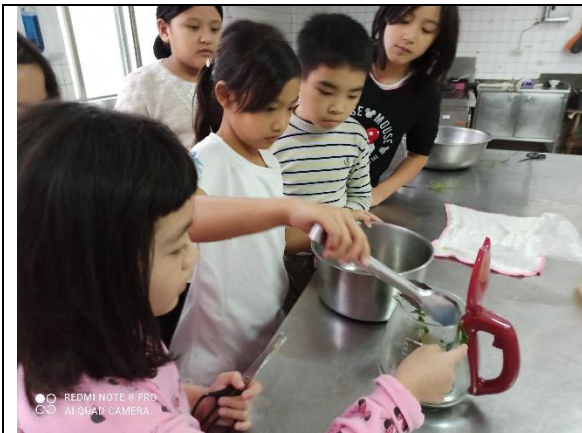
放入香草去除生水