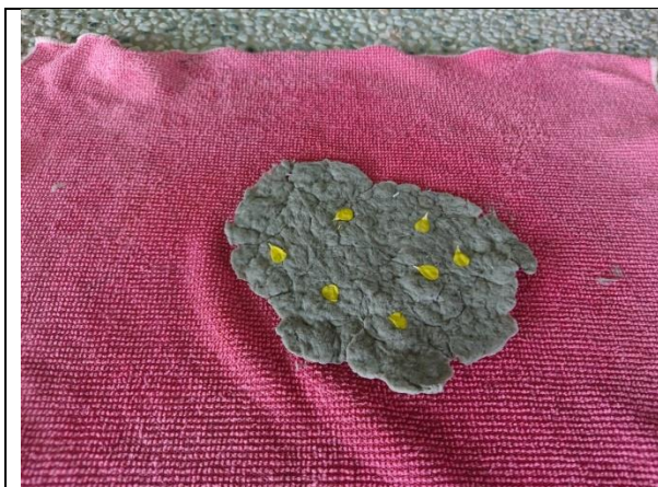
添加油菜花花瓣的再生紙