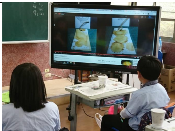
影片說明染紙方式