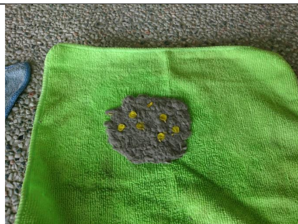
個人風格再生紙製作(油菜花)