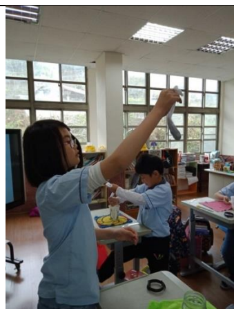
操作過程遇到問題提問