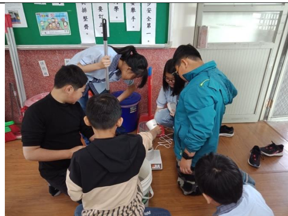
利用果汁機將回收報紙打成紙漿