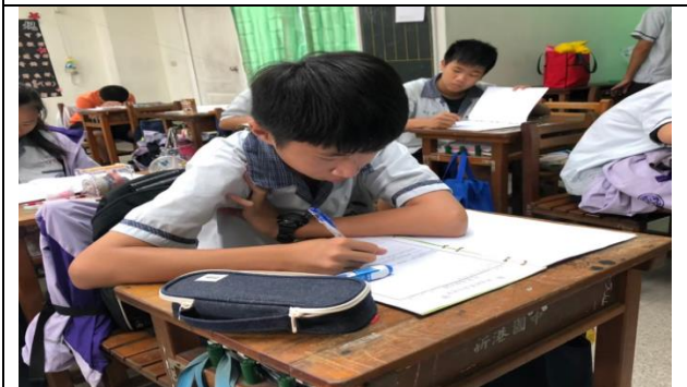
學生在課堂上用心記錄上課過程與心得