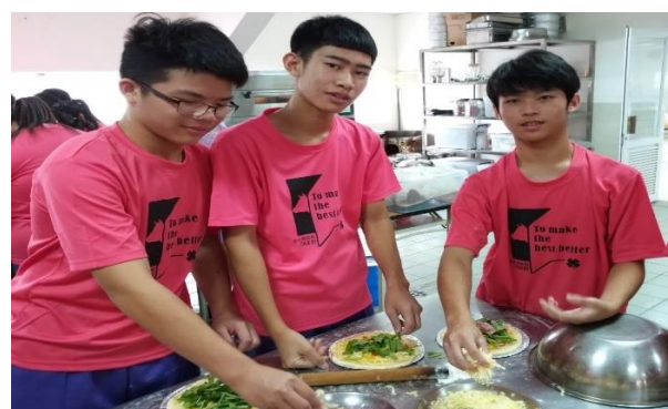
學生將收成的空心菜為食材，製作創意煎餅