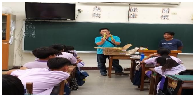
邀請青農進班向學生說明玉米筍相關知識