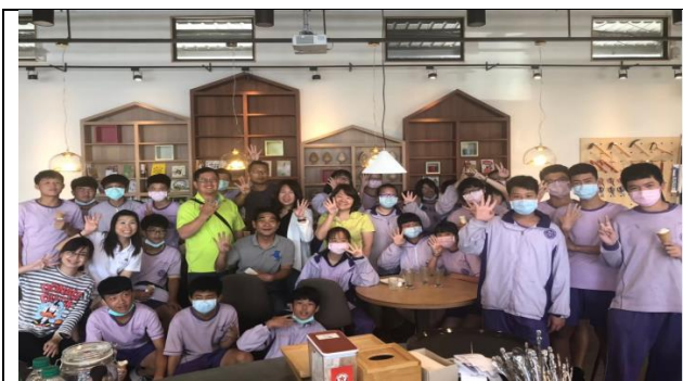
全體師生與農會、青農在新農豆食堂合影