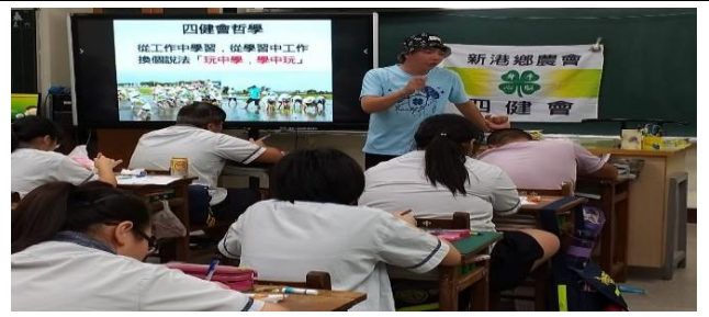
四健會哲學強調學生「玩中學，學中玩」