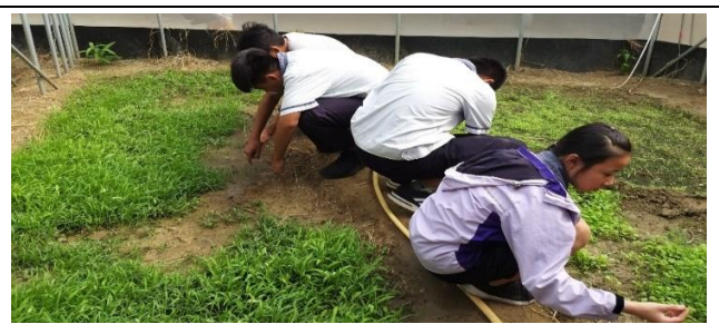
學生到空心菜園拔雜草