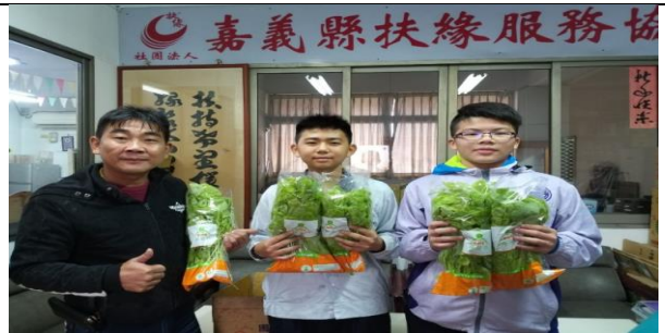
學生與青農捐贈鮮蔬給嘉義縣扶園服務協會