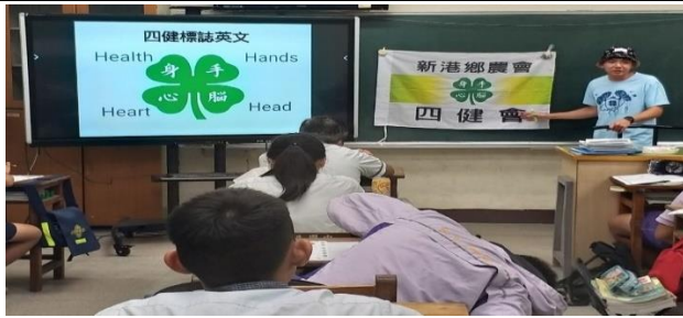
食農課程重在學生「身手心腦」的結合