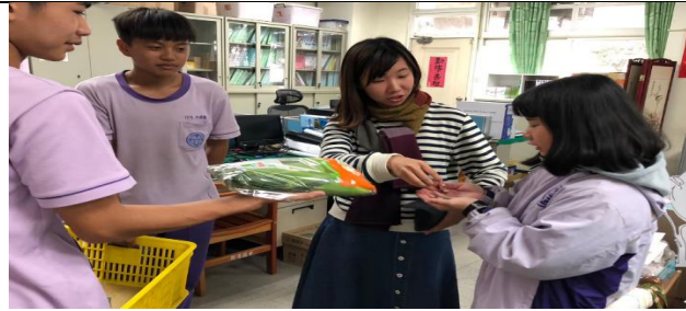
小青農分享農作物，感恩老師們平日的教誨