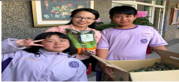
小青農將親手包裝完的玉米筍分享給校長