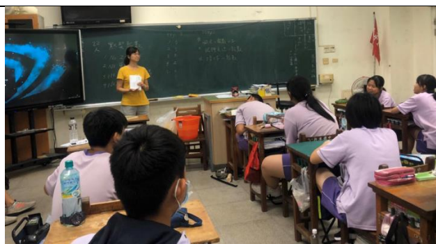
教師設計問題引導學生思考討論