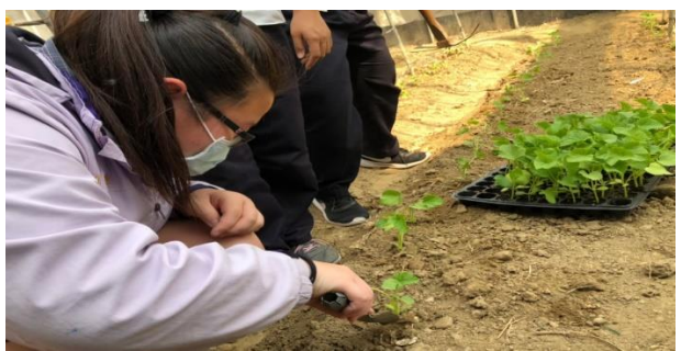
學生學習種下菜苗