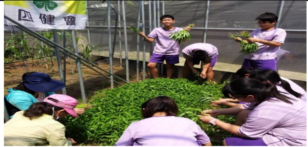
小青農們親手採收空心菜