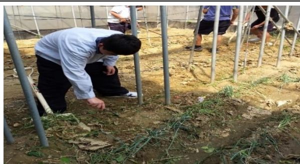
學生清除雜草，以利後續整土