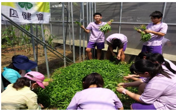
學生一同收成空心菜