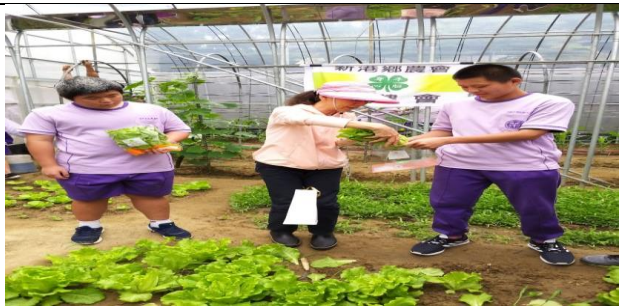
小青農們親手體驗包裝萵苣