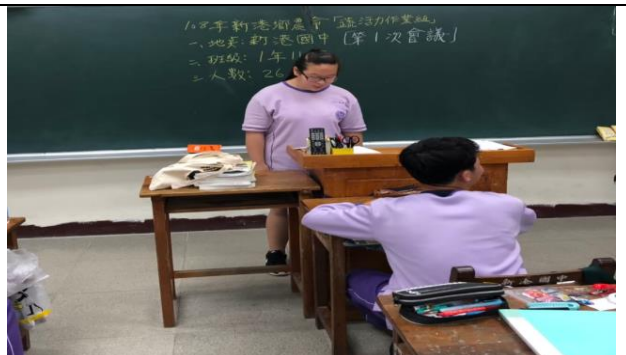
學生上台報告小組討論後的結果