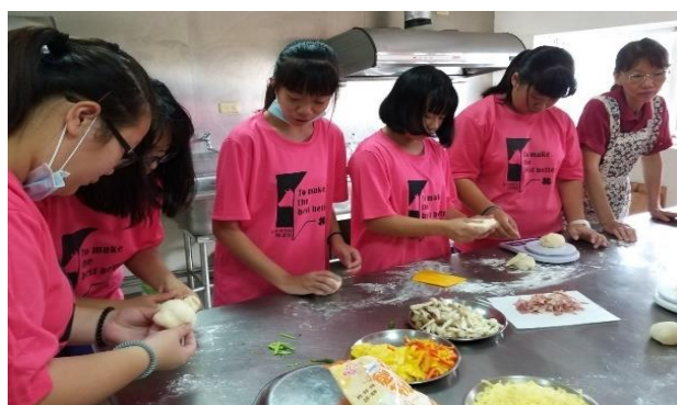
家政班媽媽教導學生製作鮮蔬煎餅