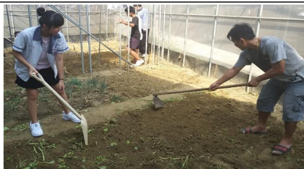
在地青農指導學生使用鋤頭鬆土