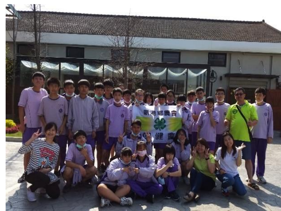
全班在新農豆食堂前與青農、農會主任合影