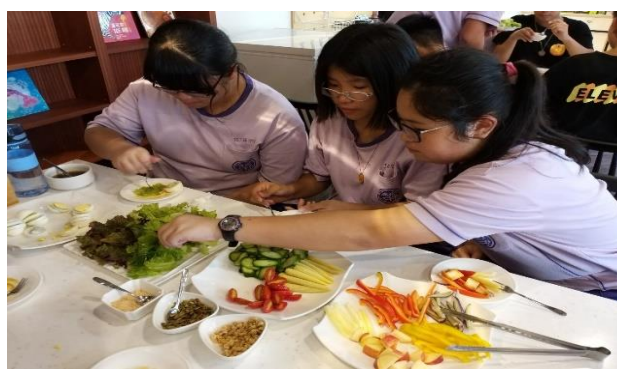
在新農豆食堂品嚐不同種類的蔬果，推廣低碳飲食