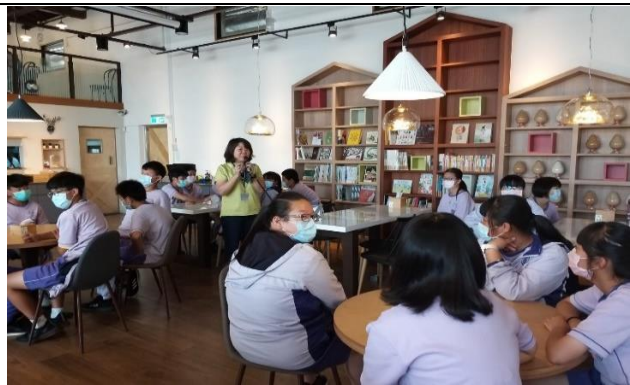
新港鄉農會主任親自說明農產品牌行銷管理