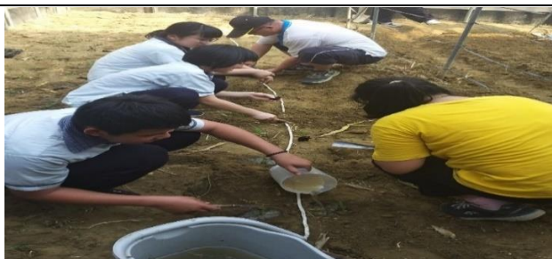
學生沿著白線替菜苗澆水