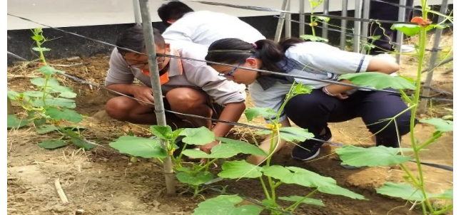
青農指導學生分辨雜草