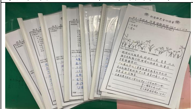
每本記錄簿記錄著小青農的築夢過程