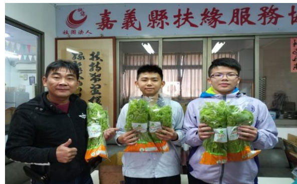
學生與青農至嘉義縣扶緣服務協會贈送新鮮蔬菜