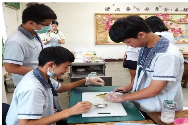
學生親手製作健康飲食：鮮蔬沙拉