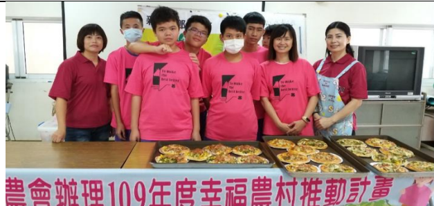
小青農的鮮蔬煎餅上菜囉