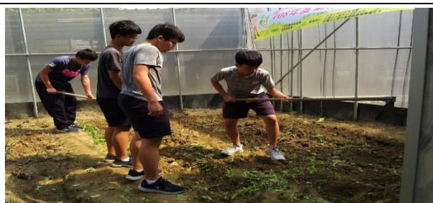
學生小組分工合作整出菜畦