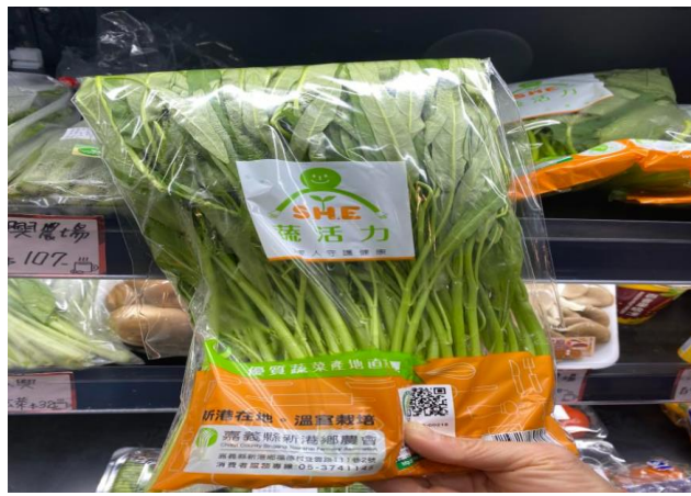
介紹具有產銷履歷的「蔬活力」溫室空心菜