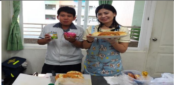
學生親手製作的鮮蔬沙拉分享給家政班媽媽