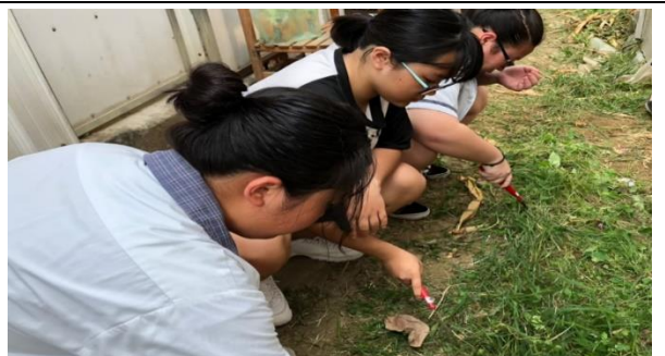
學生用鐮刀清除雜草