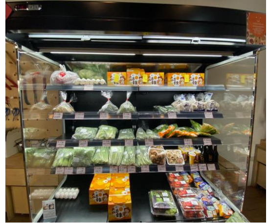
向學生展示具產銷履歷的優質生鮮蔬食