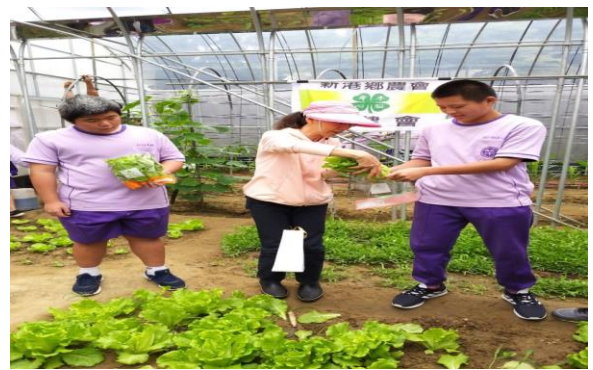
學生收成萵苣，並學習裝袋的方式