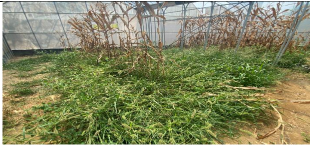
舊溫室整理前，雜草叢生的樣貌