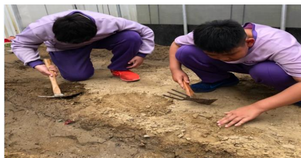
學生學習用鐵鋤鬆土