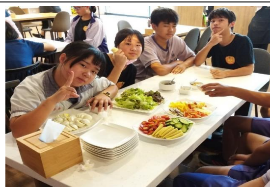
品嚐來自台灣各地的生菜，低碳飲食