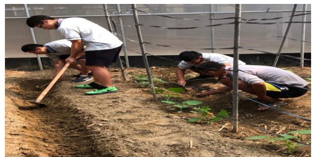
學生向青農學習種菜苗的技巧