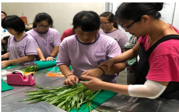
家政班媽媽逐步指導學生包裝空心菜