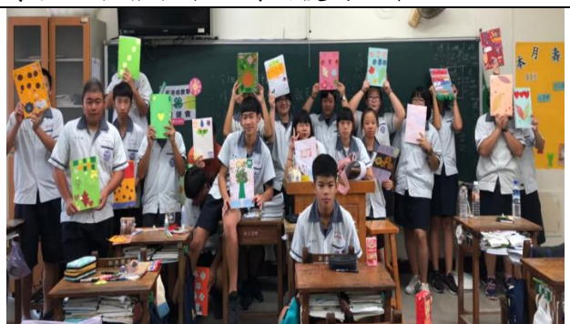
小青農自製紀錄簿封面