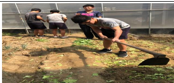
學生學習使用鋤頭，做出菜畦