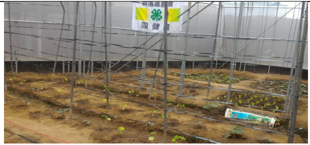
舊溫室重生，使土地永續發展