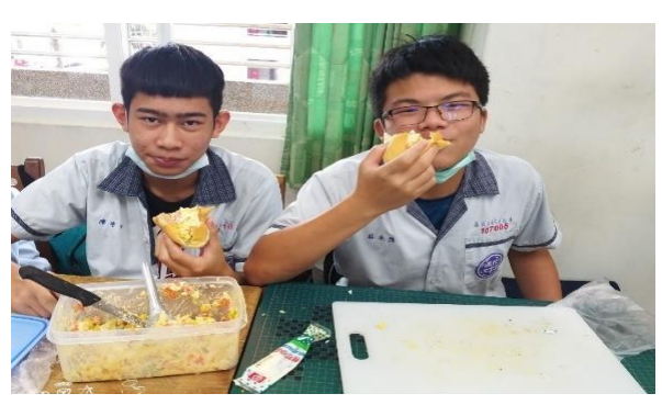
同儕彼此共享，拉近人與人的距離