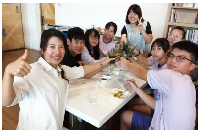
師生品嚐蔬果飲品，推廣有機、健康飲食