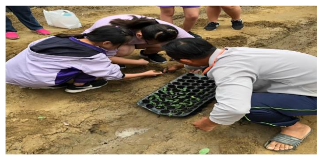
青農指導學生如何種菜苗