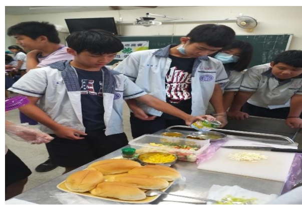
學生分組親手製作健康飲食