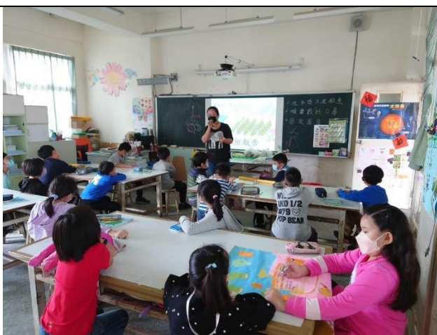
老師提供種植小白菜的相關訊息