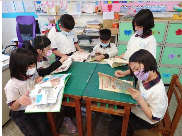
學生閱讀食農繪本及書籍