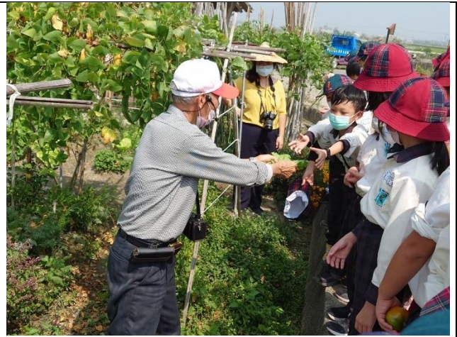
有機蔬果栽種介紹