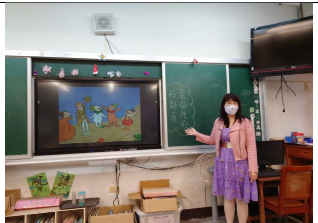
「菜園裡的好鄰居」繪本 PPT 賞析