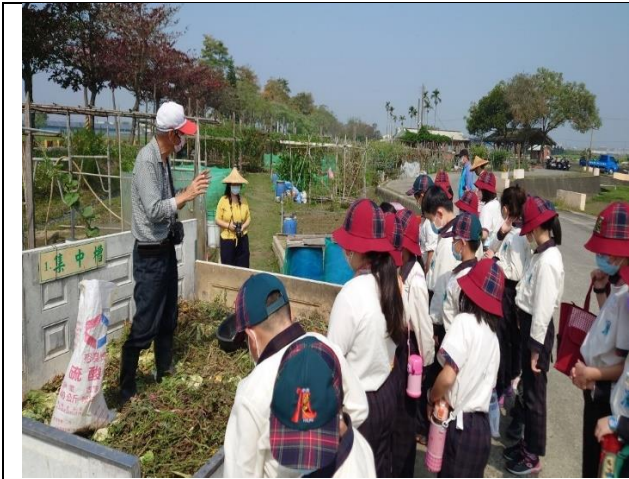
二分之一農場堆肥場導覽