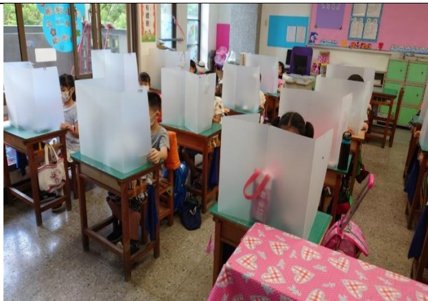
學生午餐前朗誦感恩詞