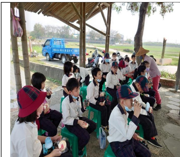
享用農場自製的美味茶點