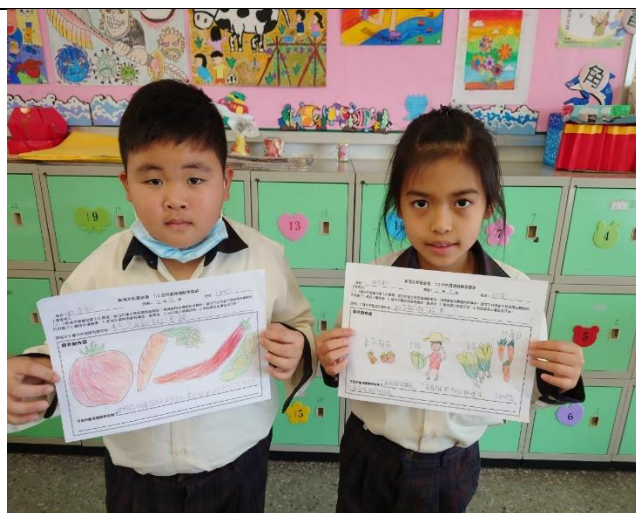
二分之一農場參觀學習單製作2