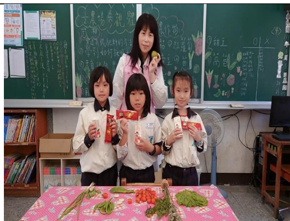
二分之一農場參觀後討論與分享