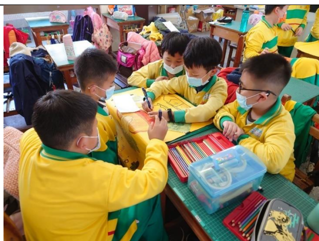
「蔬菜的一生」海報製作1