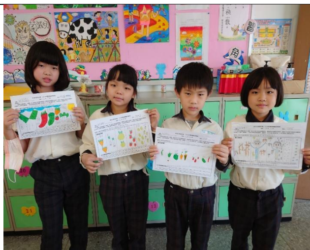
二分之一農場參觀學習單製作1