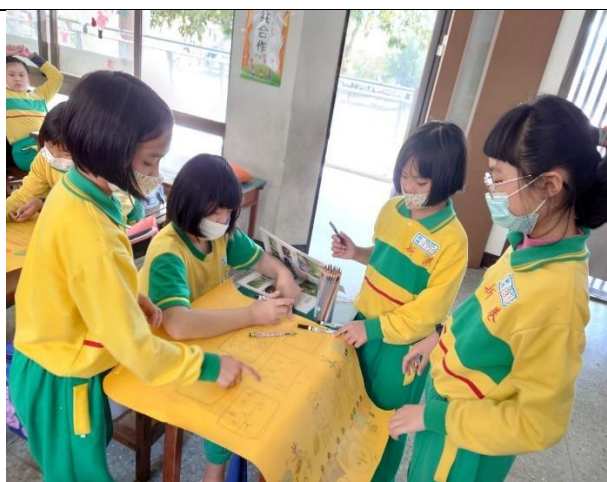
「蔬菜的一生」海報製作2