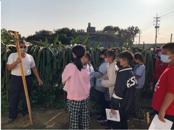
照片簡述：觀看火龍果棚架的搭設並記錄。