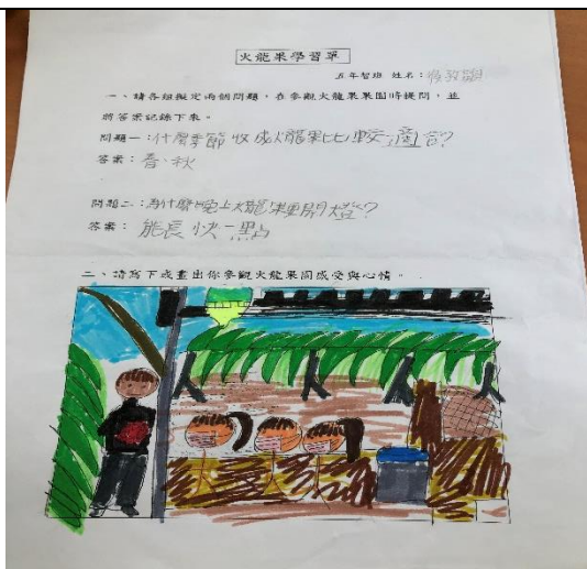
照片簡述:搭設棚架。