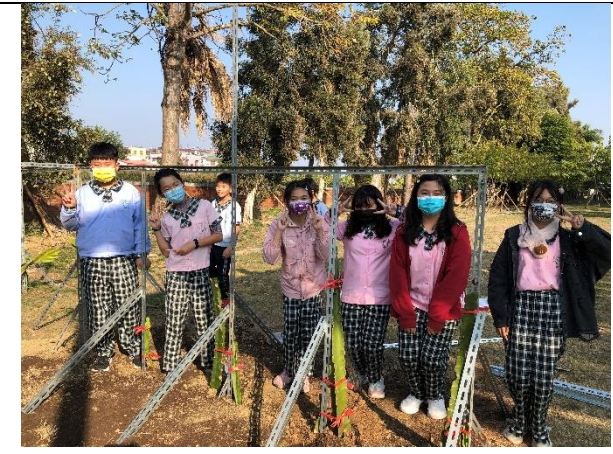
照片簡述：挑選優良的植株，進行種植