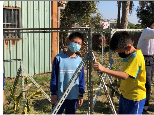
照片簡述：搭設棚架。