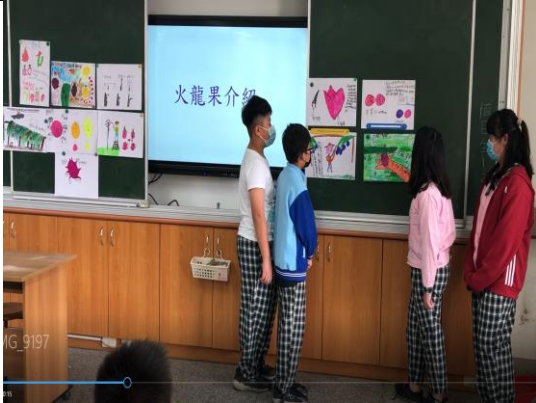
照片簡述:觀看火龍果棚架的搭設並記錄。