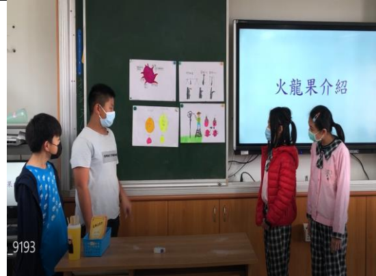
照片簡述:分組設計棚架的搭設方式。