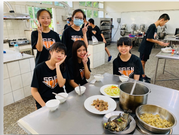
食在好健康－紅藜料理實作