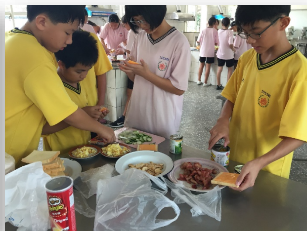
食在好健康－紅藜料理實作