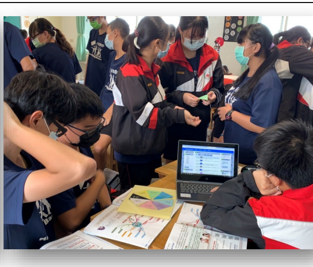
科技輔助自主學習