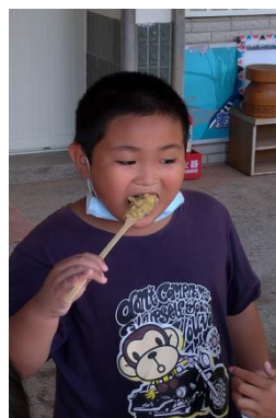
學生大口品嚐的小米