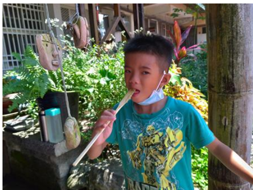
學生品嚐剛煮好的小米