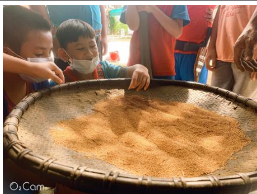
教師指導學生用觸覺感受小米