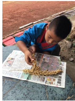
學生用揉撥方式幫小米脫粒