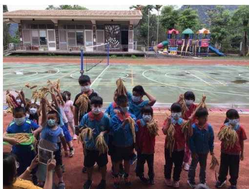
教師指導學生選出最長最重的小米