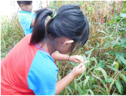
學生用視覺辨識小米是否成熟