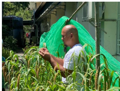
請部落耆老教學生正確的捆綁小米