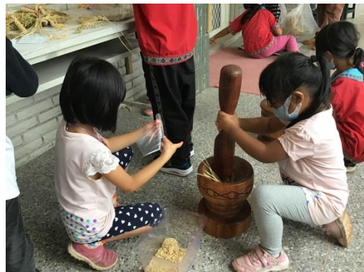
學生用搗米器幫小米脫粒