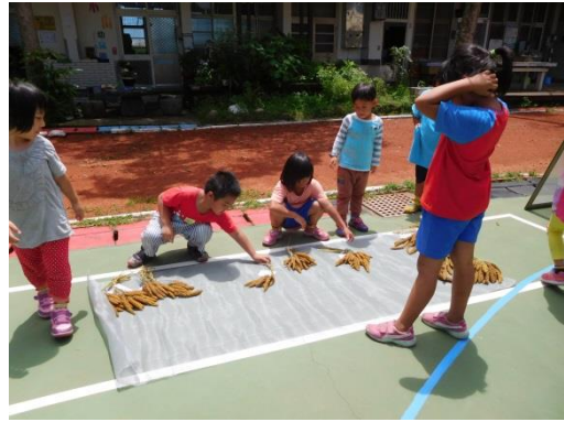
學生用心曬乾小米