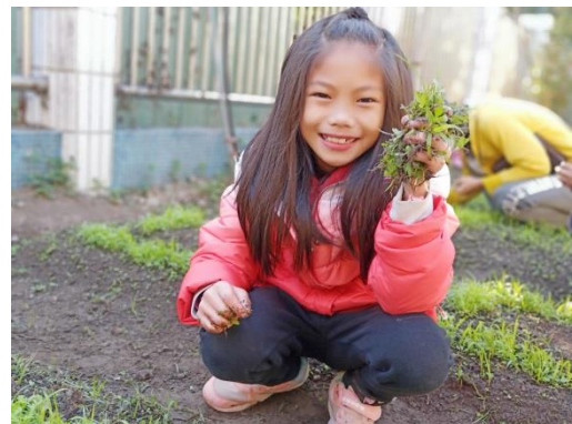
教師教導學生除草注意事項