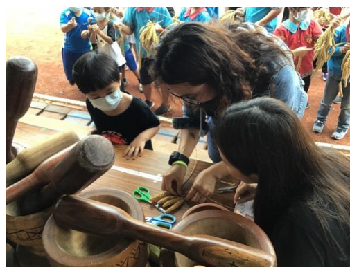
教師確認小米王比賽結果