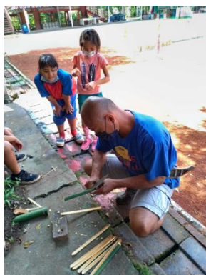
請部落耆老教導製作竹製攪拌匙