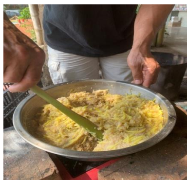
部落耆老示範如何烹煮小米