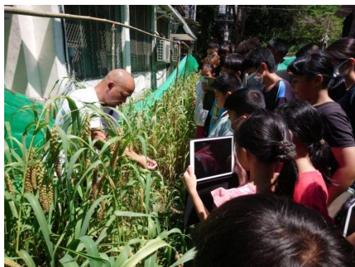
請部落耆老教學生辨識能採收的小米