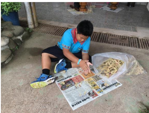
學生用手搓方式幫小米脫粒