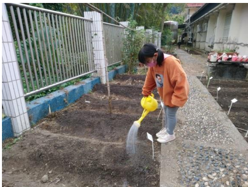
教師教導學生灑水技巧