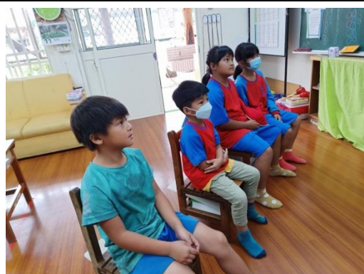
學生專心聆聽小米傳話故事