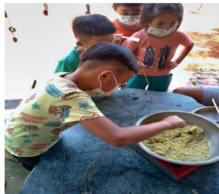
學生親手攪拌小米粥