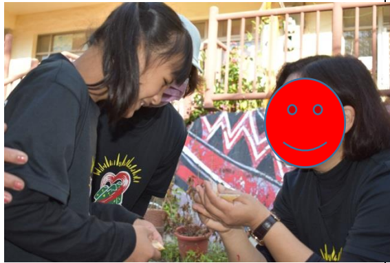
由校長發小米種子像徵生命傳承