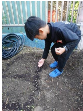
教師教導學生播撒