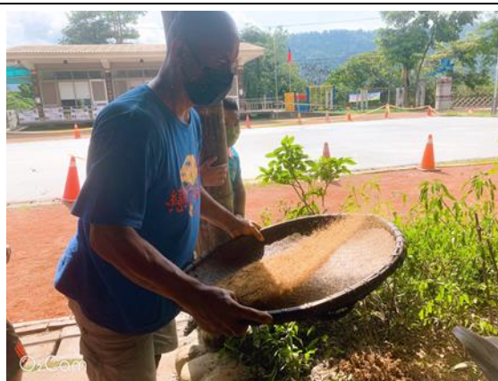
請部落耆老示範用篩子篩出小米殼