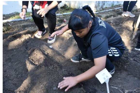
教師教導學生覆土