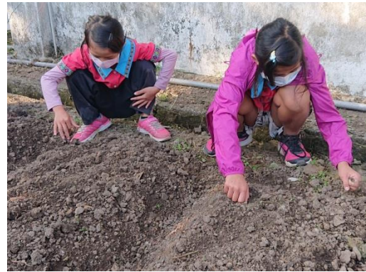
教師教學生整理耕地