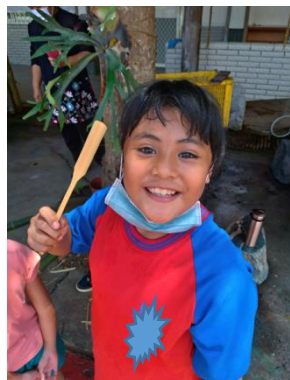
學生開心的與自己專屬攪拌匙合影