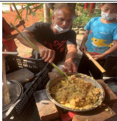
部落耆老叮嚀過程中要不停地攪拌