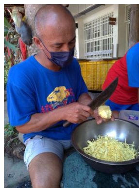
請部落耆老示範鄒族刨絲方式