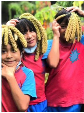
學生開心與自己的小米合照