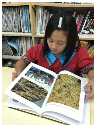
學生閱讀小米補充教材