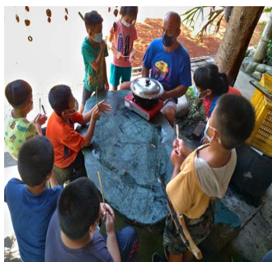
學生發表味覺品嚐小米粥的心得