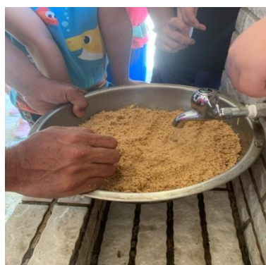
教師介紹如何洗小米