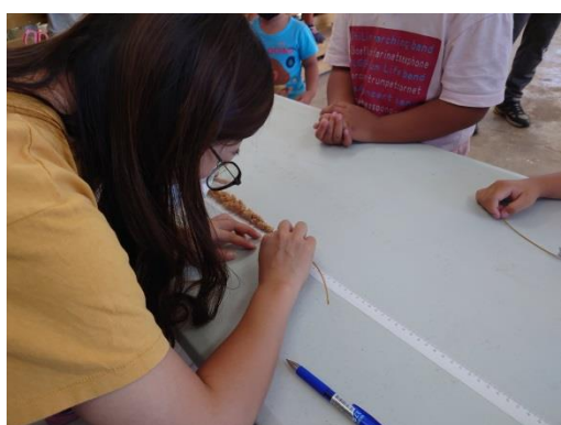
教師確認小米的長度