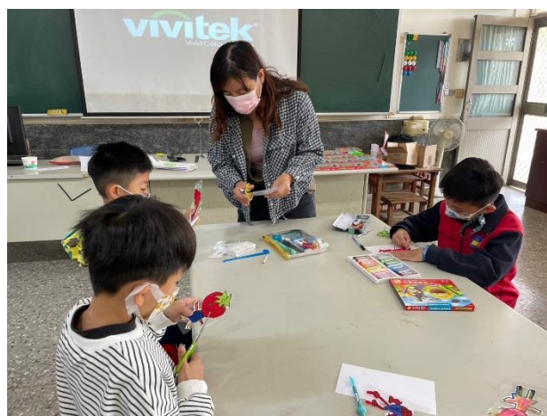
說明：展—水果偶製作