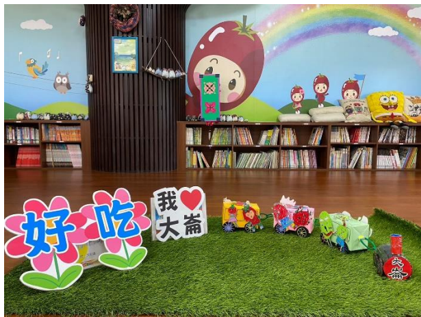
說明：大崙健康列車策展設計