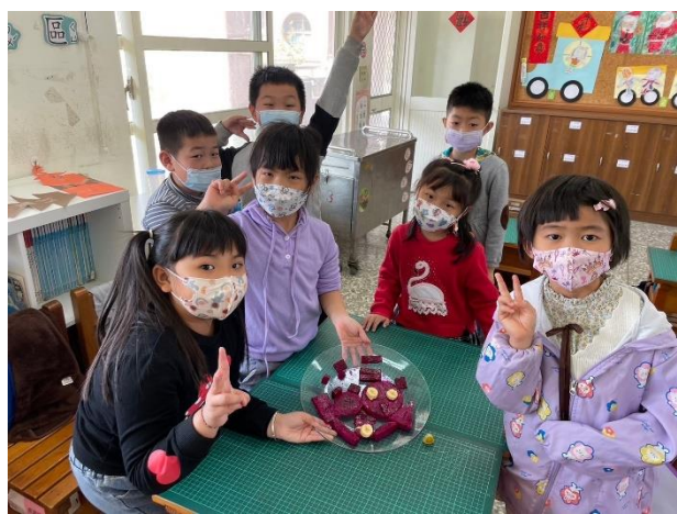
說明：做—吃天然，水果拼盤設計