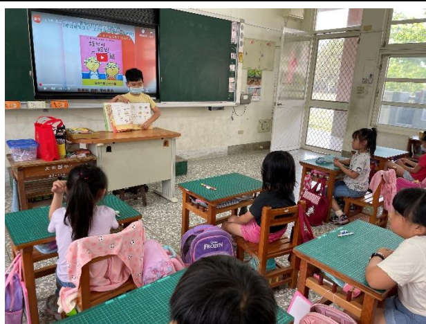
說明：想—我絕對不吃番茄