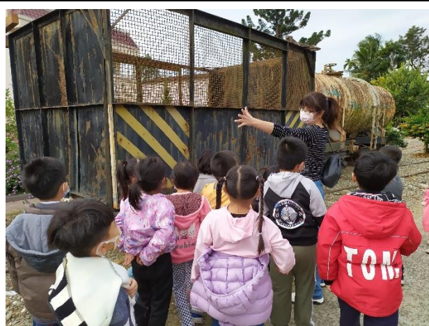
說明：觀—蔗埕火車踏查