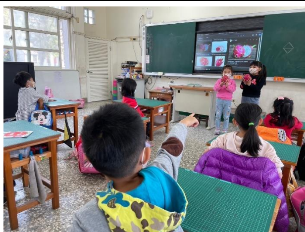
說明：連—生活中的糖，火龍果