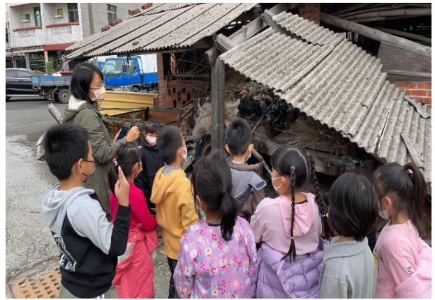
說明：在地物產改變的觀察體驗—豬舍廢棄