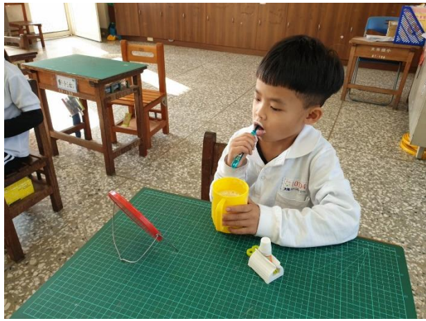
說明：健康飲食習慣—吃完東西要刷牙