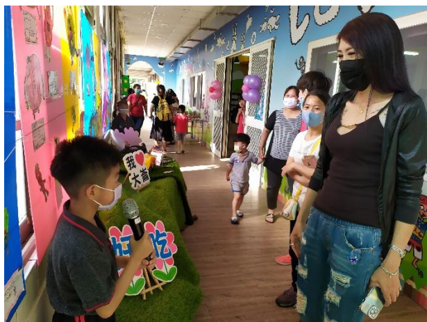
說明：校慶時，食全食美策展導覽