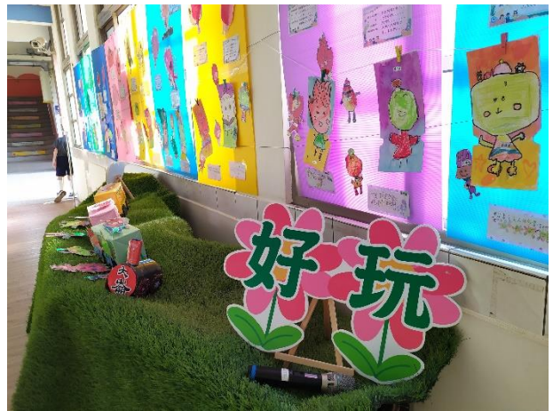
說明：食全食美佈展規劃