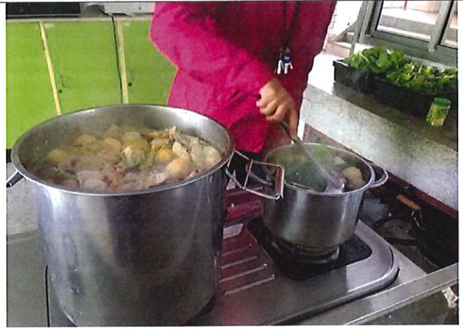
家政課程融入食農教育