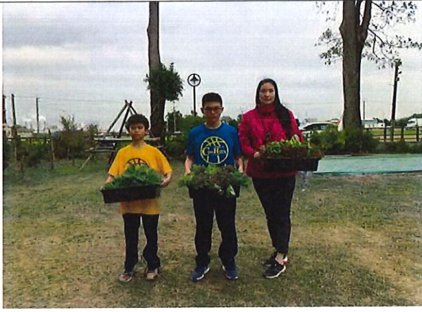
食農教育--學生開心採收