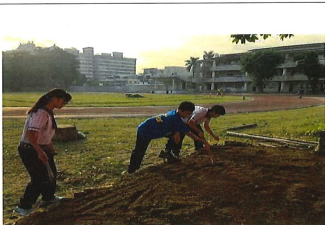
學生同心合作整地鋪平