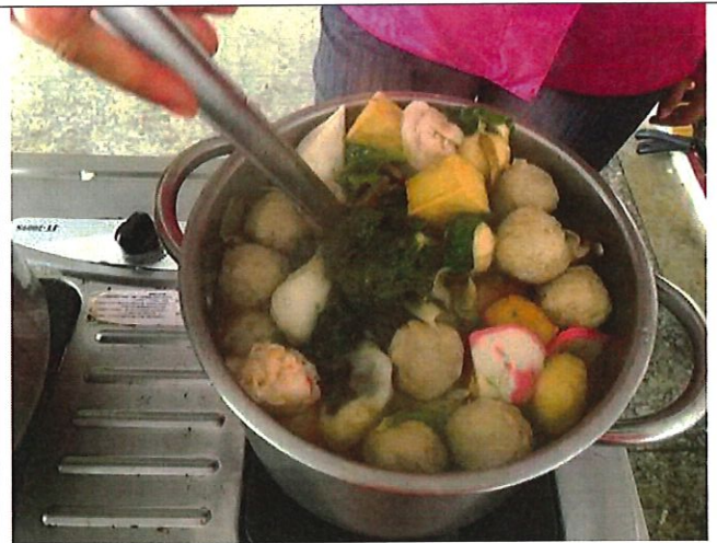
學生絞盡腦汁烹飪美味的料理