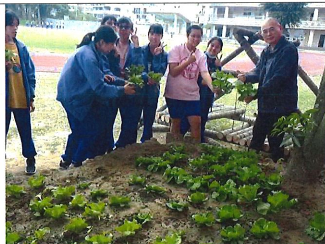
學務主任—開心農場園長