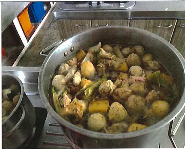
學生絞盡腦汁烹飪美味的料理