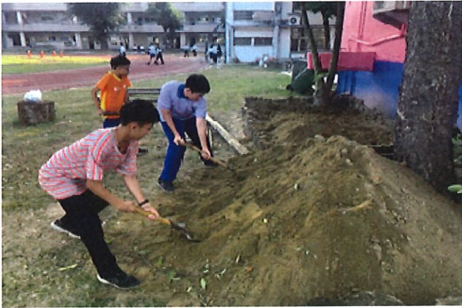
學生同心合作開始整地