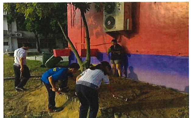
學生同心合作整地鋪平