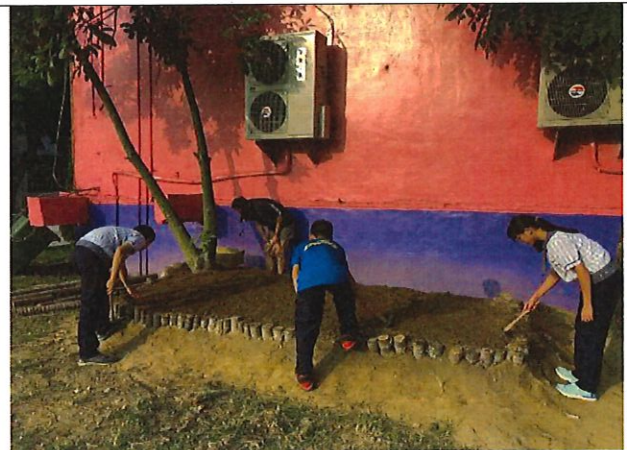
學生同心合作整地鋪平