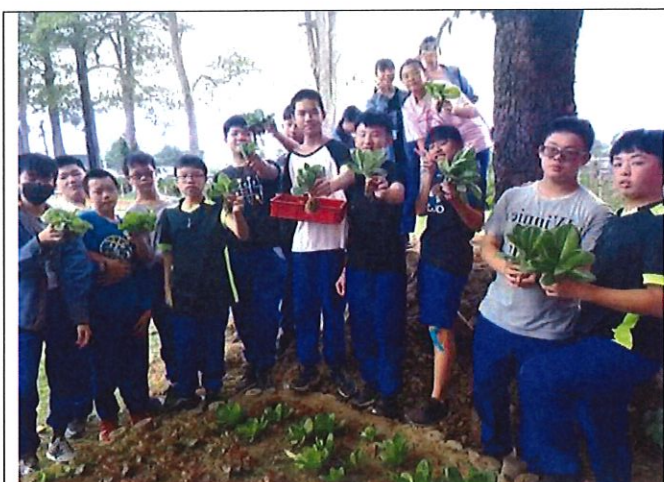
學生食農教育-採收