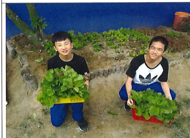
食農教育—班級烹飪食材