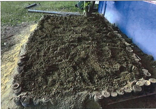
初步菜園慢慢形成