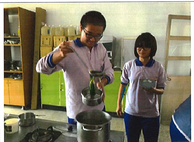
食農料理成果發表與品嚐分享