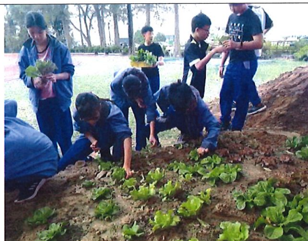
學生食農教育-採收