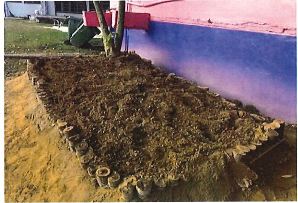
初步菜園慢慢形成