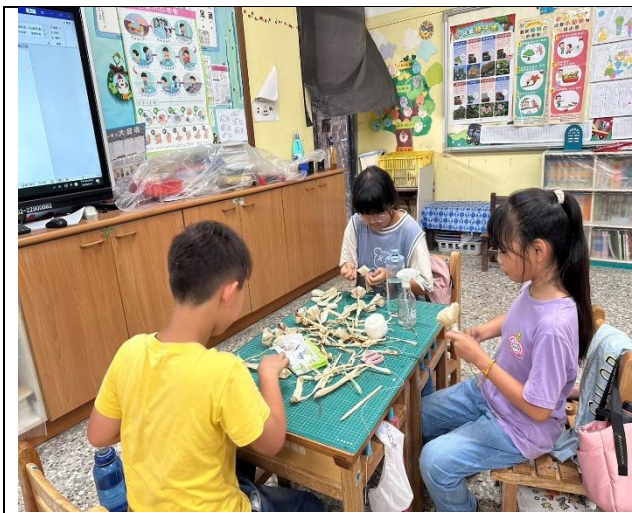
玉米農產的藝術創作