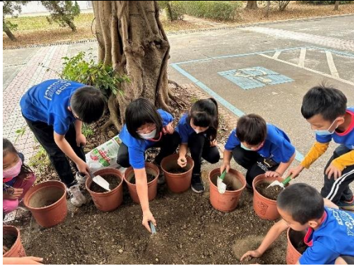
同學們一起種玉米_挖土播種