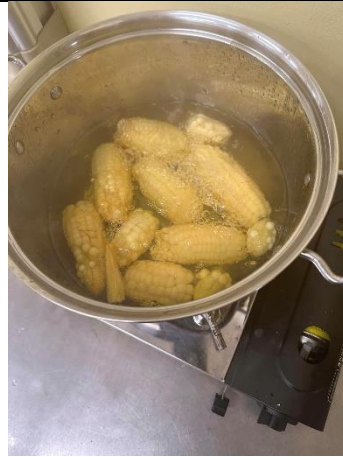
產地到餐桌_煮玉米湯