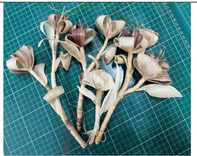
玉米農產的藝術創作