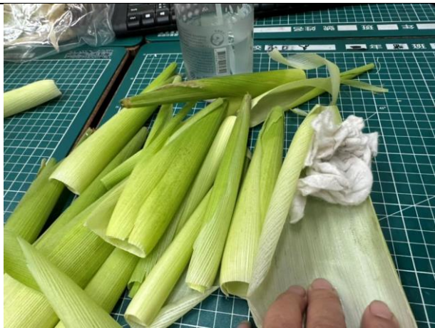
種玉米_洗乾淨創作