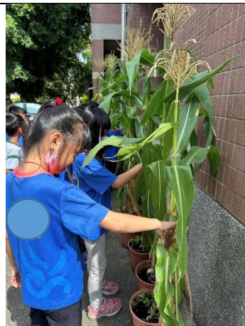
玉米成長記錄一量一量寫一寫