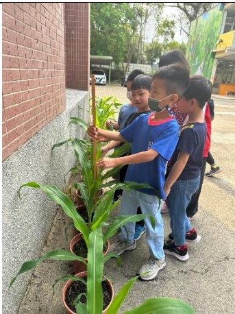
玉米長高了，每天為它量身高