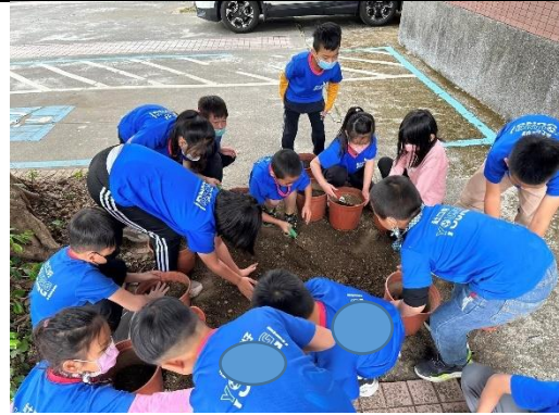
同學們一起種玉米_挖土播種