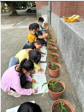
玉米種子長大了~玉米成長記錄