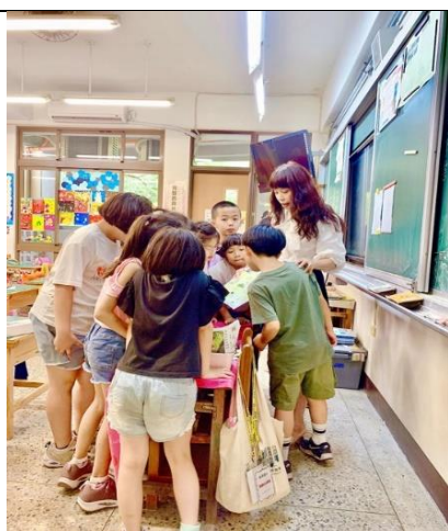
老師介紹各種植物種子