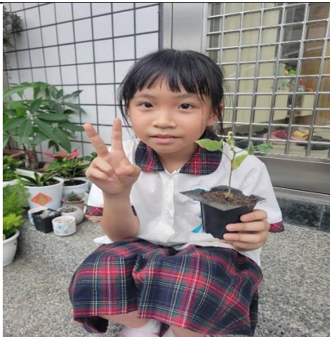
小豆子帶回家換大盆栽