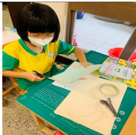
裁切小書的內容與封面