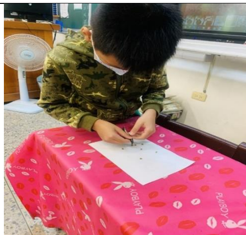
撥開成熟的豆莢~綠豆種子