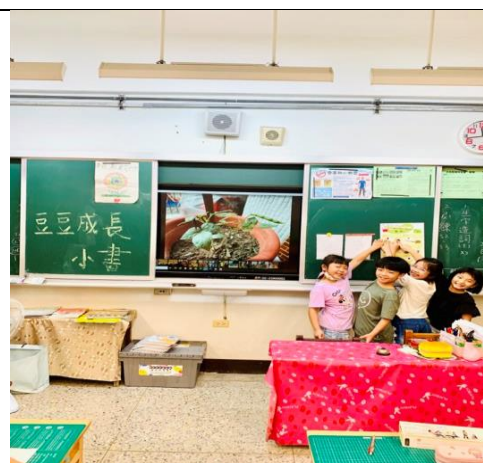
種子對對碰~闖關遊戲