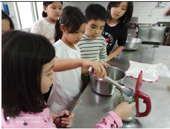
放入香草去除生水