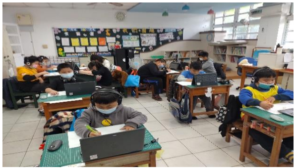
說明：學生利用筆電搜尋資料