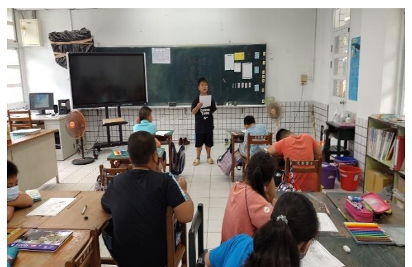
說明：分享與發表插秧心得～小短文