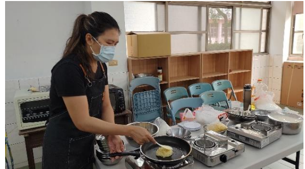
說明：在地青農指導學生製作米披薩