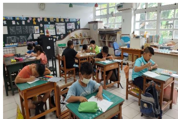
說明：參訪後的回顧