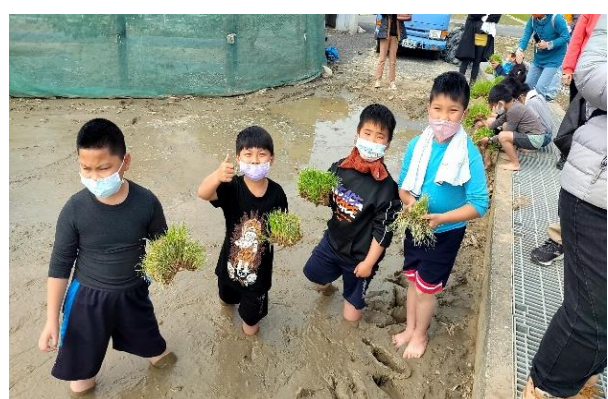
說明：有機農田插秧體驗