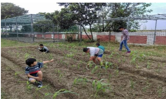
說明：照顧玉米～拔草體驗