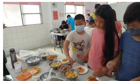
說明：放材料準備進烤箱囉