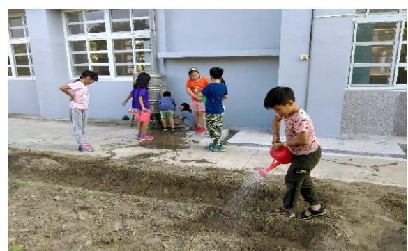
說明：照顧玉米～澆水體驗