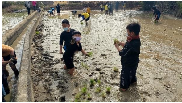
說明：有機農田插秧體驗