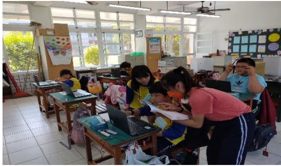
說明：學生利用網路搜尋資料