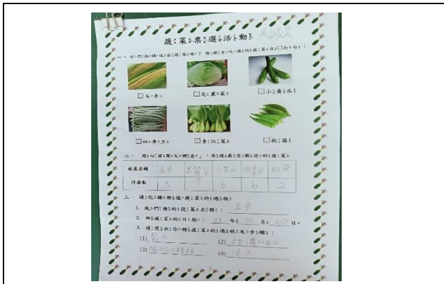
說明：學生蔬菜票選學習單