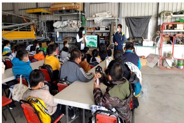
說明：布袋有機農田參訪