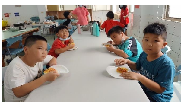
說明：準備品嚐米披薩