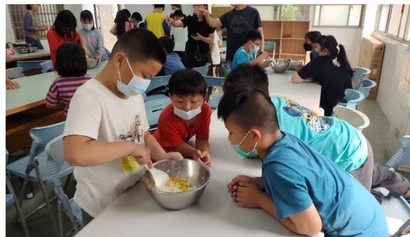
說明：學生練習製作米披薩