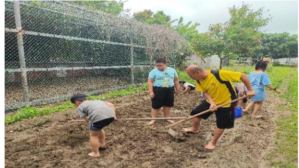
說明：在地青農指導學生翻耕體驗