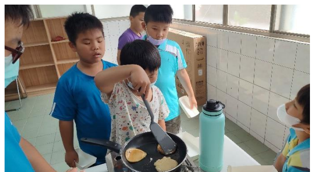
說明：學生練習煎米披薩