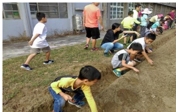
說明：學習玉米播種