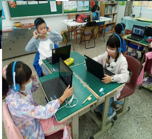
3. 利用網路資源，查詢其他相關報導。