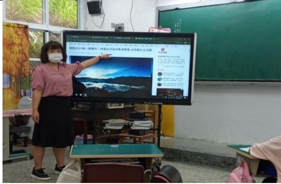
1. 教師播放相關新聞報導