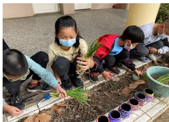
食農教育：韭菜收成啦！