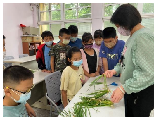
老師指導韭菜的處理