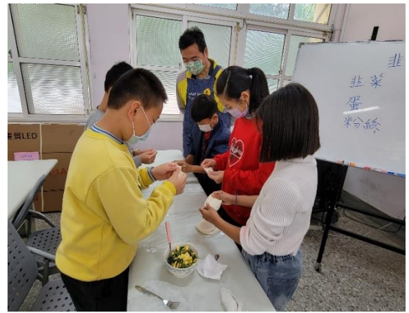
同學動手製作韭菜寶盒