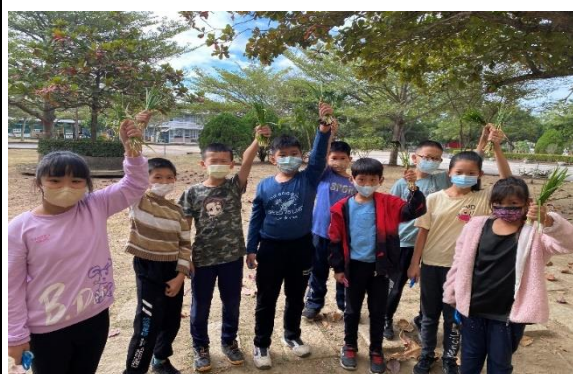
食農教育：韭菜收成啦！