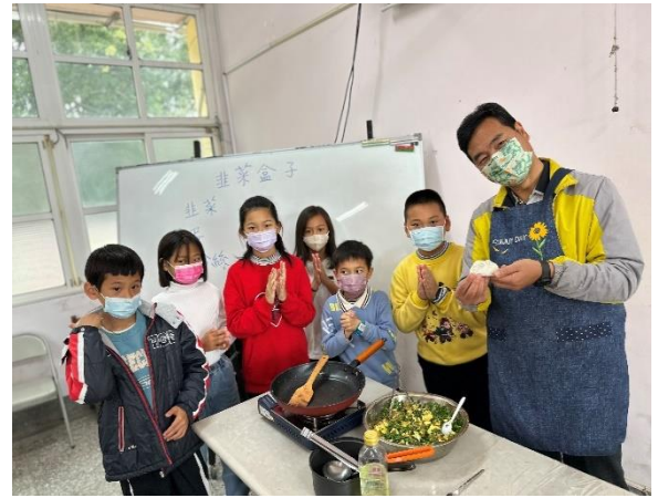
校長學習製作韭菜寶盒