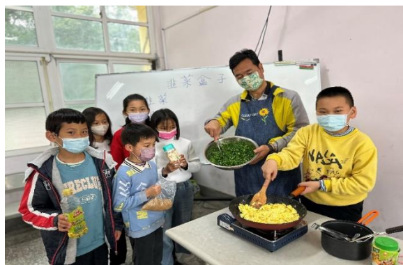
校長指導同學炒蛋