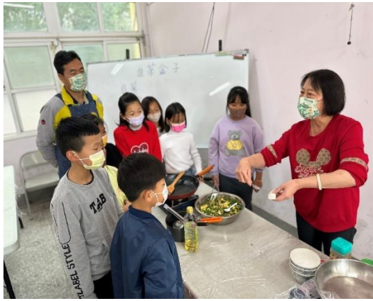
老師示範製作韭菜寶盒