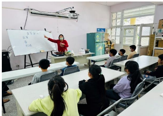
老師介紹韭菜寶盒的材料