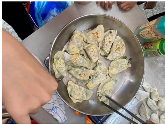
美味的韭菜寶盒完成啦