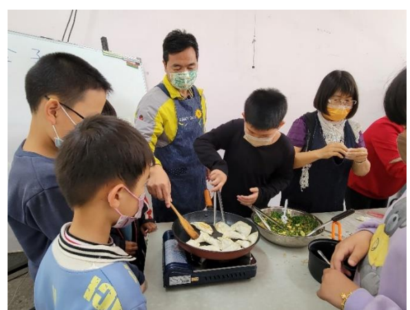
快焦了！校長來救場囉