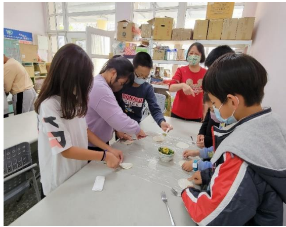
同學動手製作韭菜寶盒