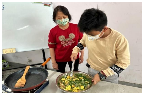
請同學上前參與活動