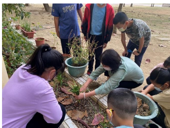
食農教育：韭菜收成啦！