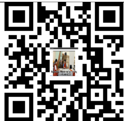
學生泡茶流程英語解說 QR Code