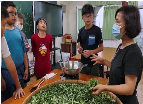
老師分析綠茶茶菁