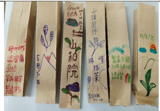
每個人都是包裝設計師