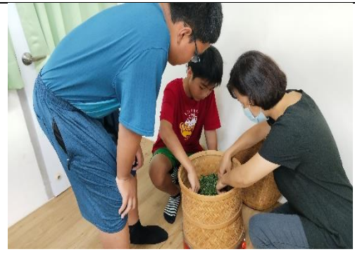
炒好茶，揉好茶，來烘焙茶囉