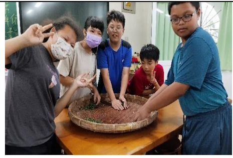
綠茶炒好了，一起來揉茶