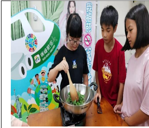
換女生妍心炒看看