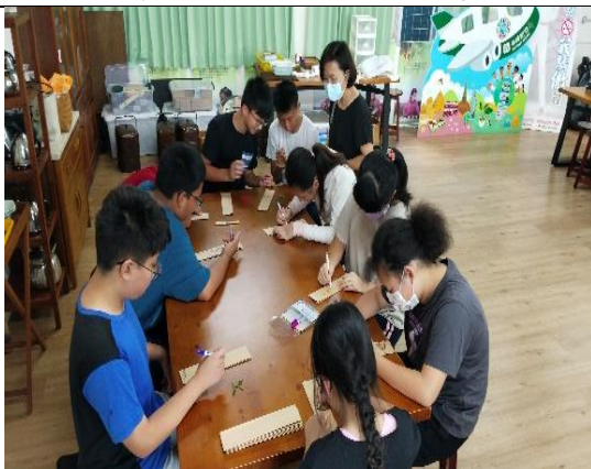
讓我看一下你的作品