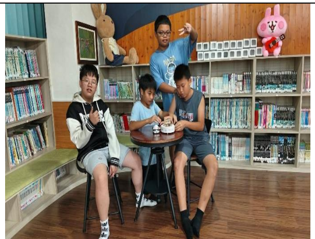
新芳春茶行音樂盒