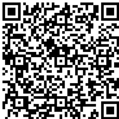
學生操作無人機 QR Code