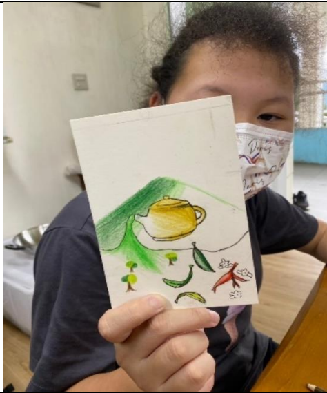
看過來，澤恩同學超厲害