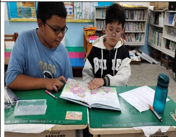
摘要紀錄上課情況