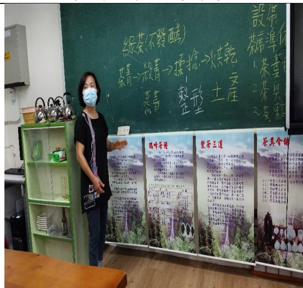
老師教導綠茶製作流程