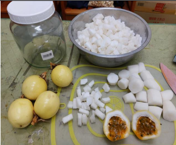
家政課程融入食農教育