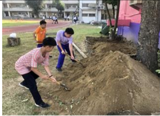
學生同心合作開始整地