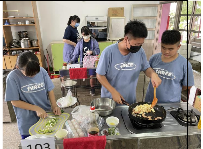
學生絞盡腦汁烹飪美味的料理