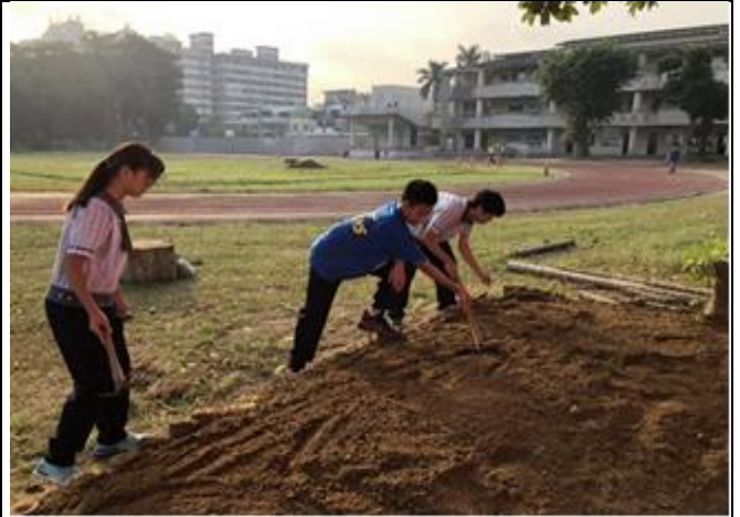
初步果園慢慢形成