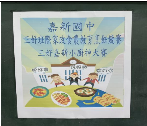
舉辦食農烹飪小廚神大賽