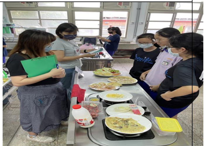
食農料理成果發表與品嚐分享