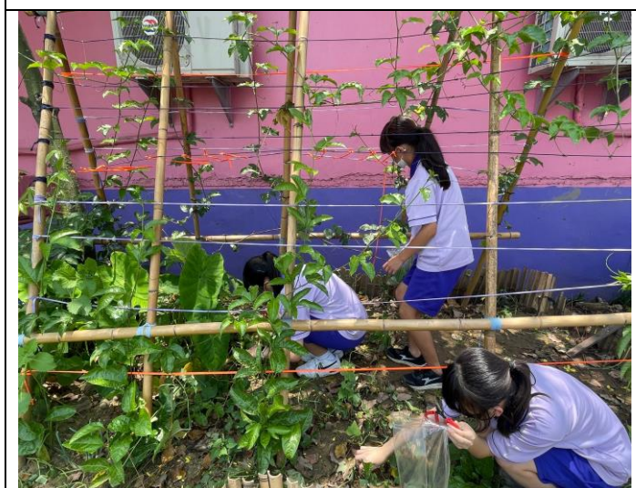
食農教育—班級輪流管理果園