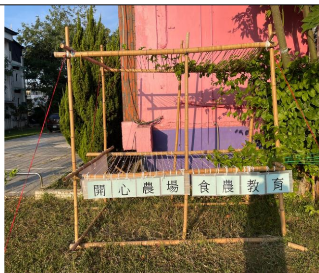
食農教育標語製作