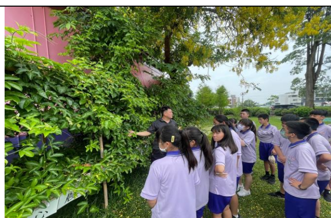
開心農場園長教學