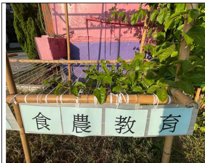
百香果竹棚架增建