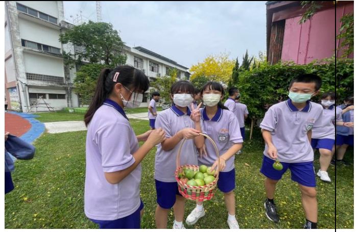
食農教育--學生開心採收