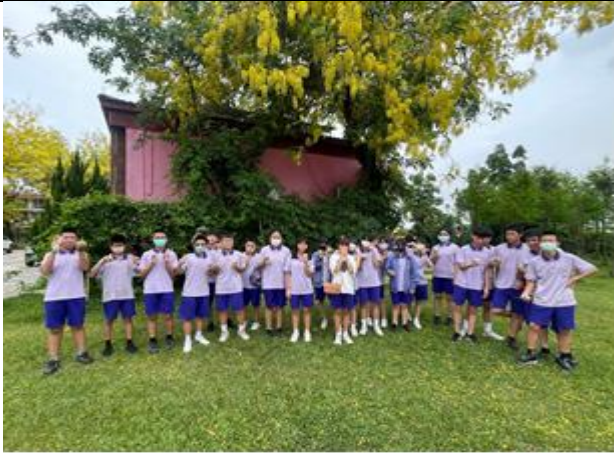
食農教育--學生開心採收