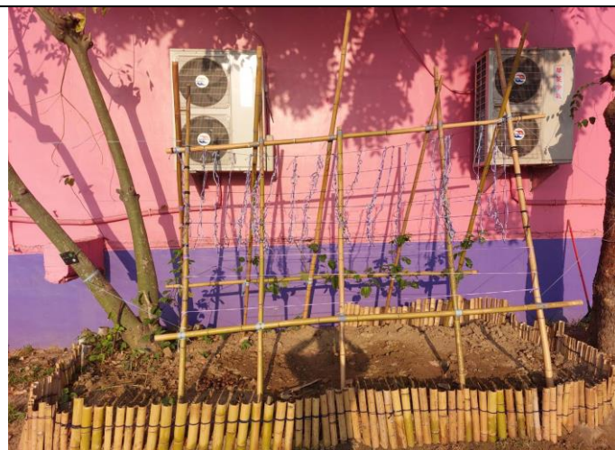
初步果園慢慢形成