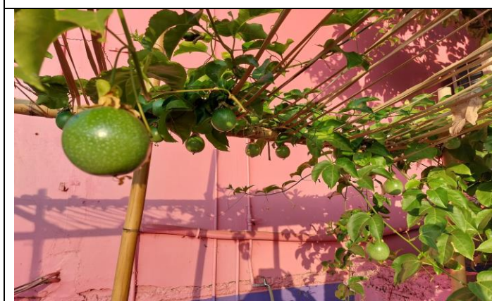
食農教育—百香果實累累