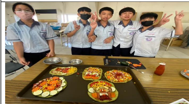
自己做的健康創意比薩最好吃