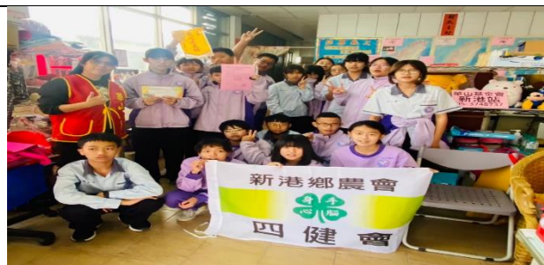
將義賣空心菜金額全數捐給華山基金會