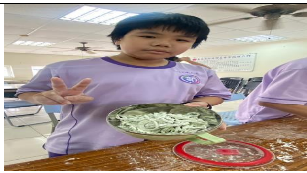
自己做的麵條好有成就感