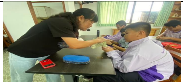
老師指導學生綁染的設計技巧