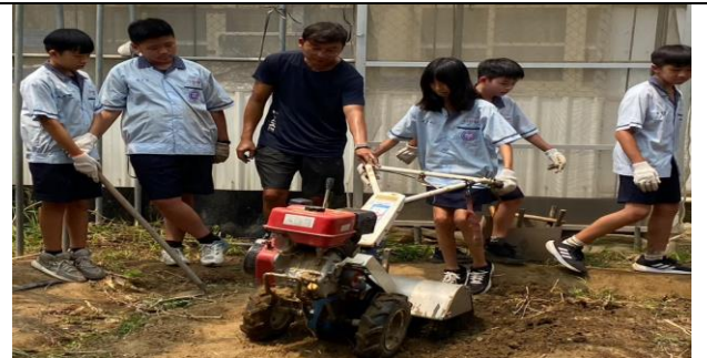
青農教導學生使用現代整土工具