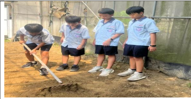
青農教導學生使用傳統整土工具