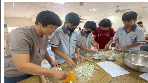
家政班阿姨指導切麵條的技巧