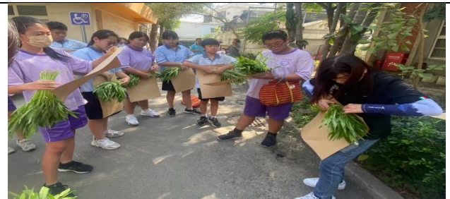
農會輔導員指導空心菜簡易包裝方式