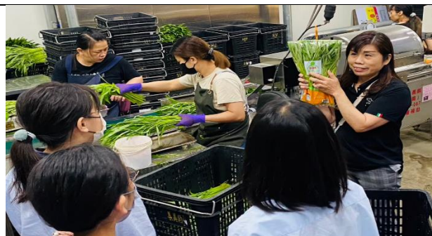
到包裝廠實際學習空心菜包裝產線