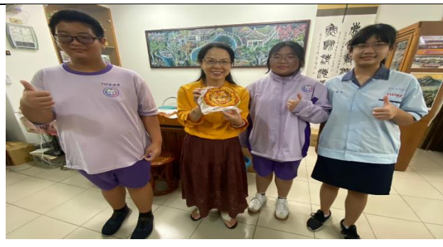
將食物分享給校長同樂