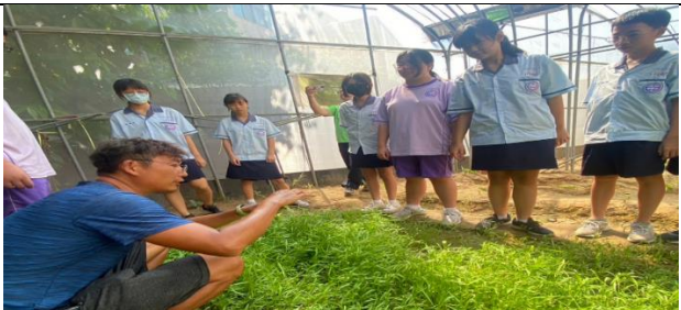
青農指導學生採摘空心菜的正確方式