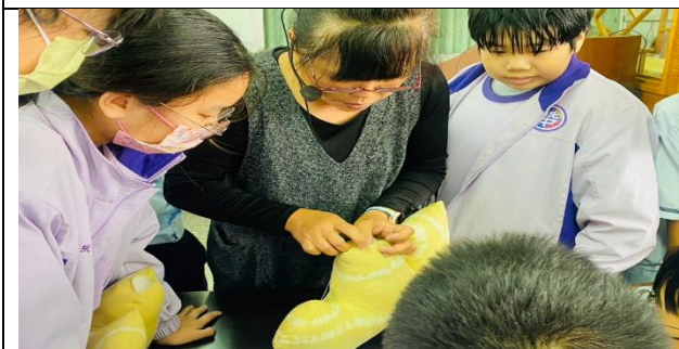
老師指導學生工字縫的方法