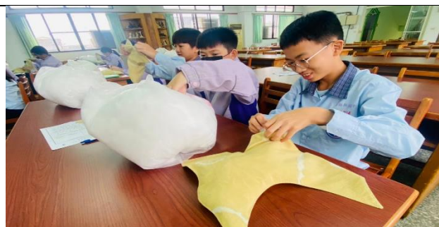
學生學習塞棉花的正確方式