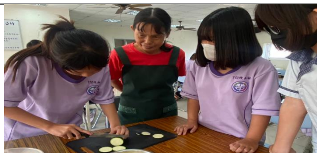
家政班阿姨指導學生正確使用刀切蔬菜