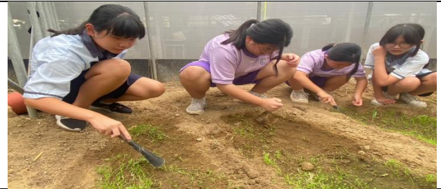
學生共同合作拔雜草