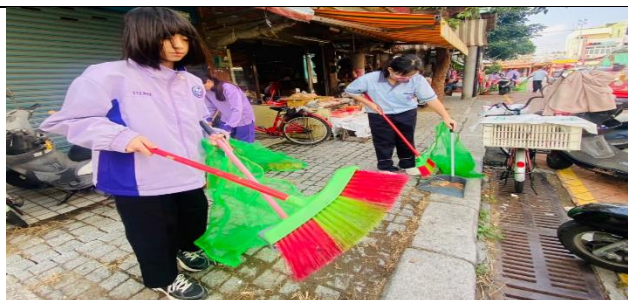
走進社區，打掃街道，服務在地