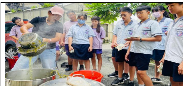
剩餘的空心菜梗做植物染