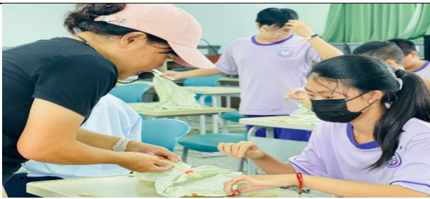
老師指導學生綁染的設計技巧