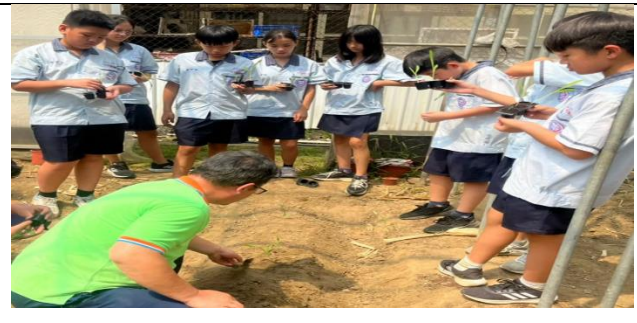
青農指導學生種植注意事項