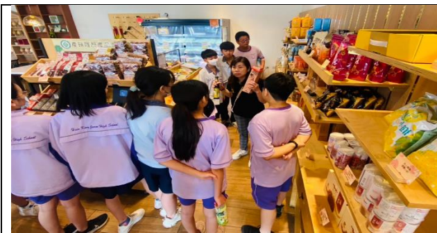
師生至新農豆食堂認識產銷履歷