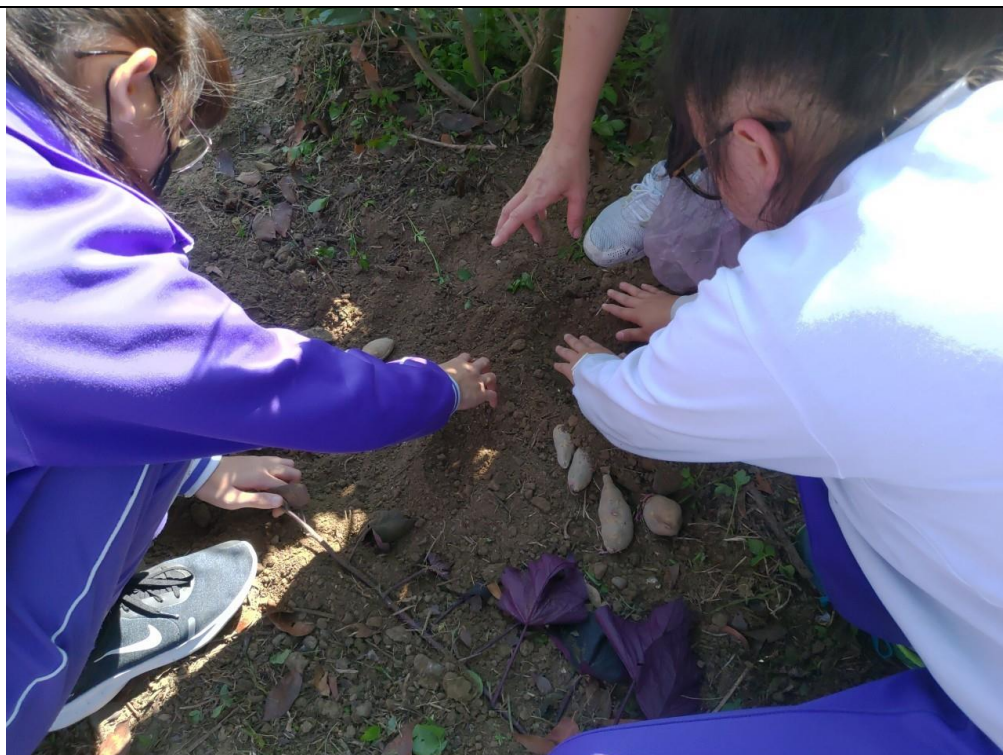
體驗教學法～小小農夫親自進行番薯種植