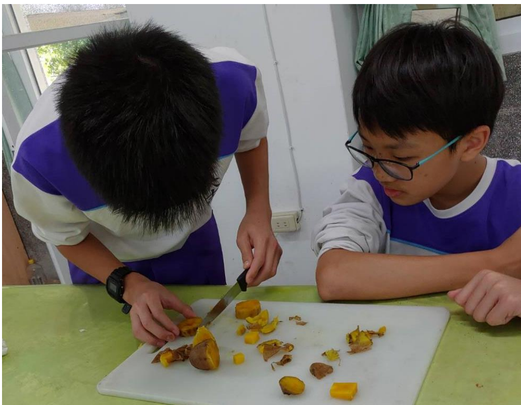
將番薯切成適合擺盤的形狀