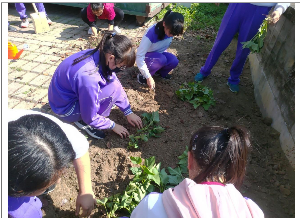
體驗教學法～小小農夫親自進行番薯種植