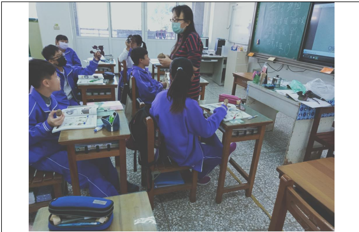
講述教學法介紹無性生殖