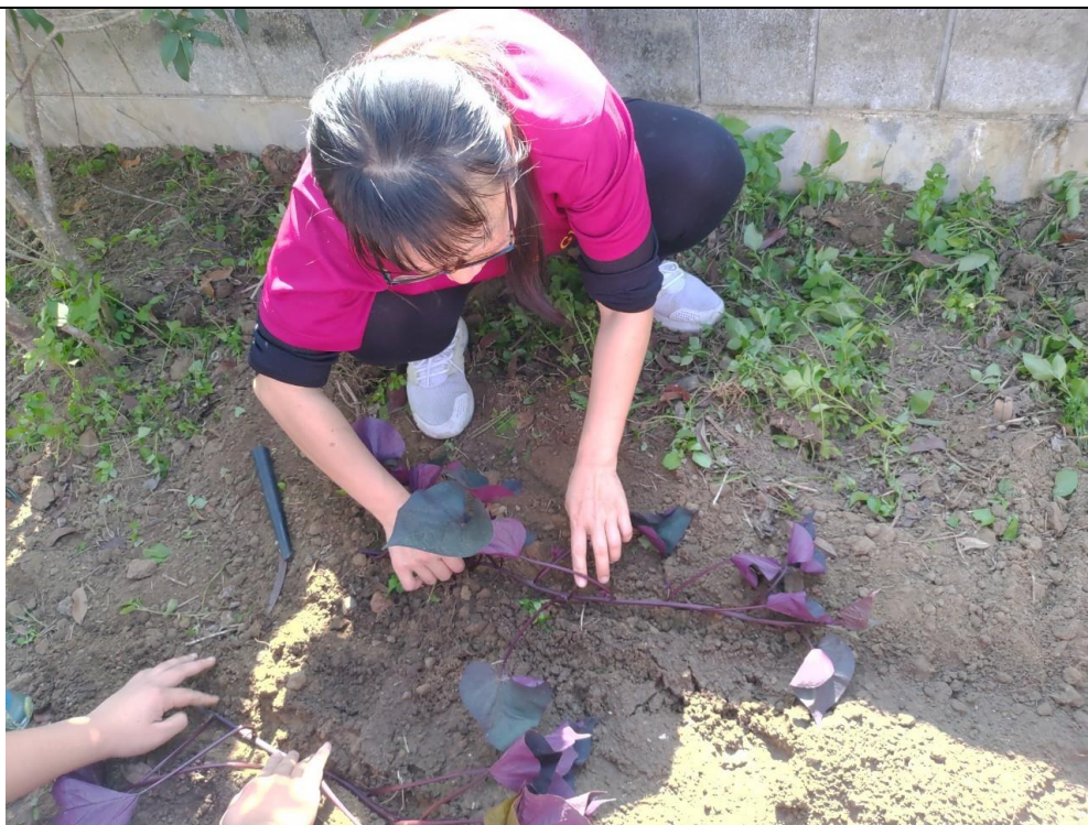
體驗教學法～老師示範如何進行種植