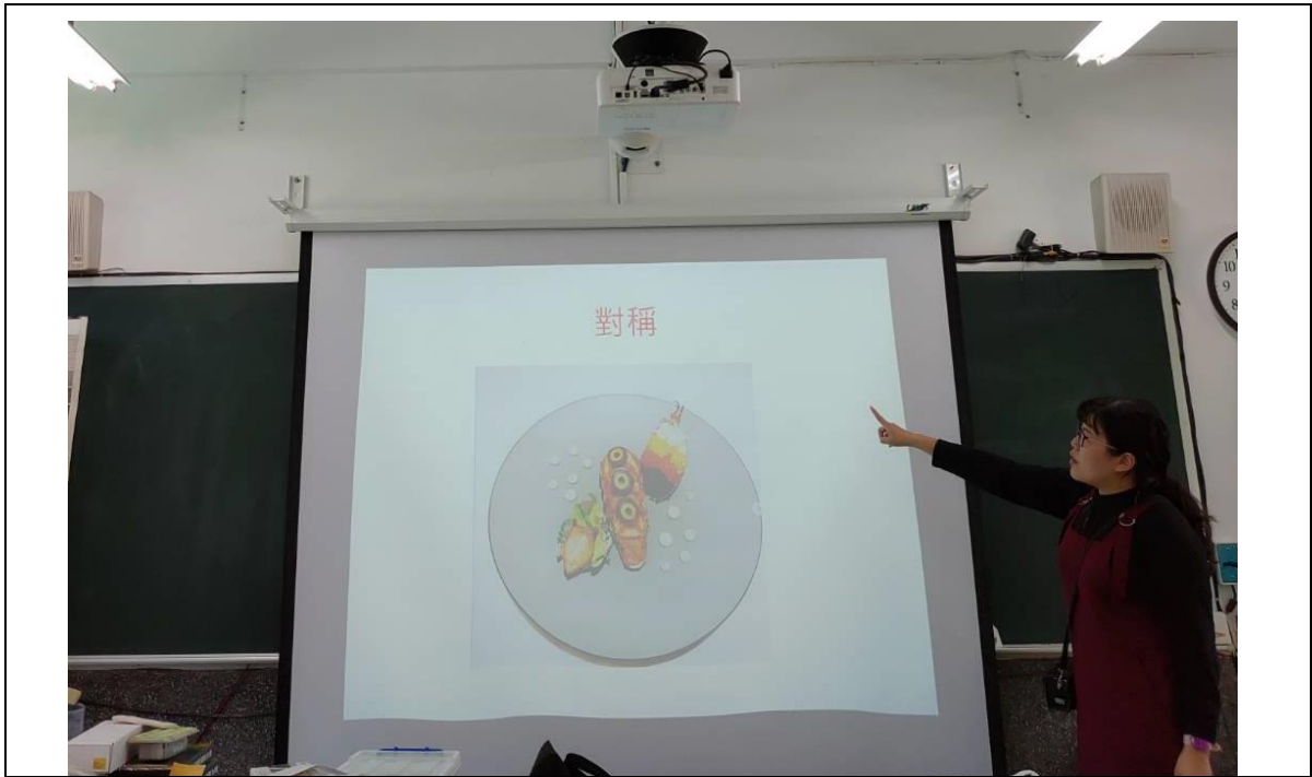
課程實施-餐桌上的美感-欣賞篇