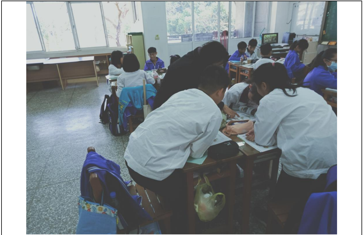
討論教學法討論無性生殖的內容