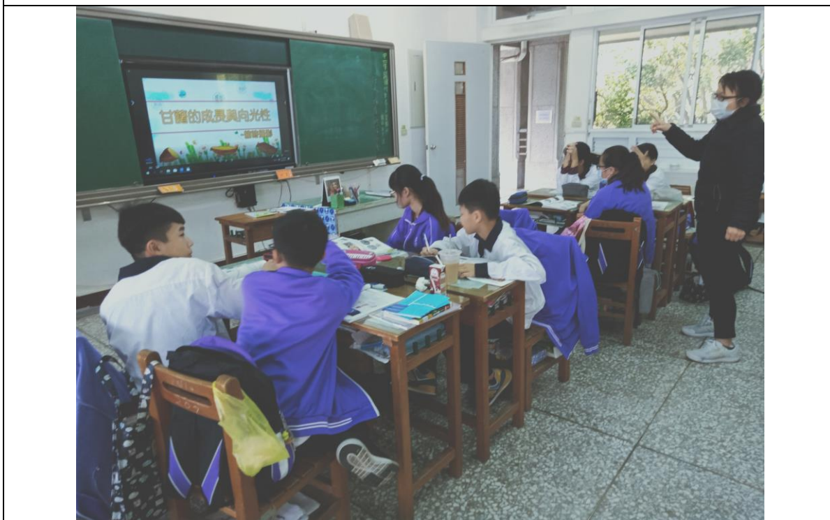
藉由影片介紹無性生殖