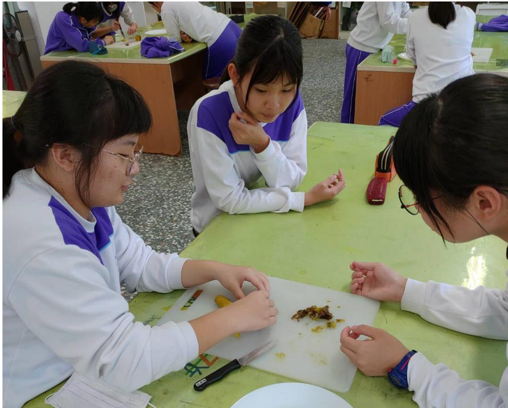
學生分組討論與實作