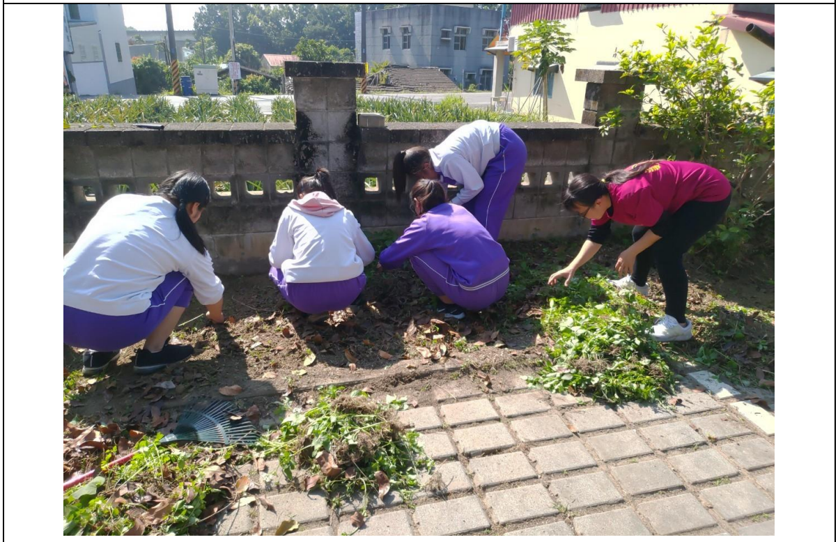
體驗教學法～帶領小小農夫進行除草