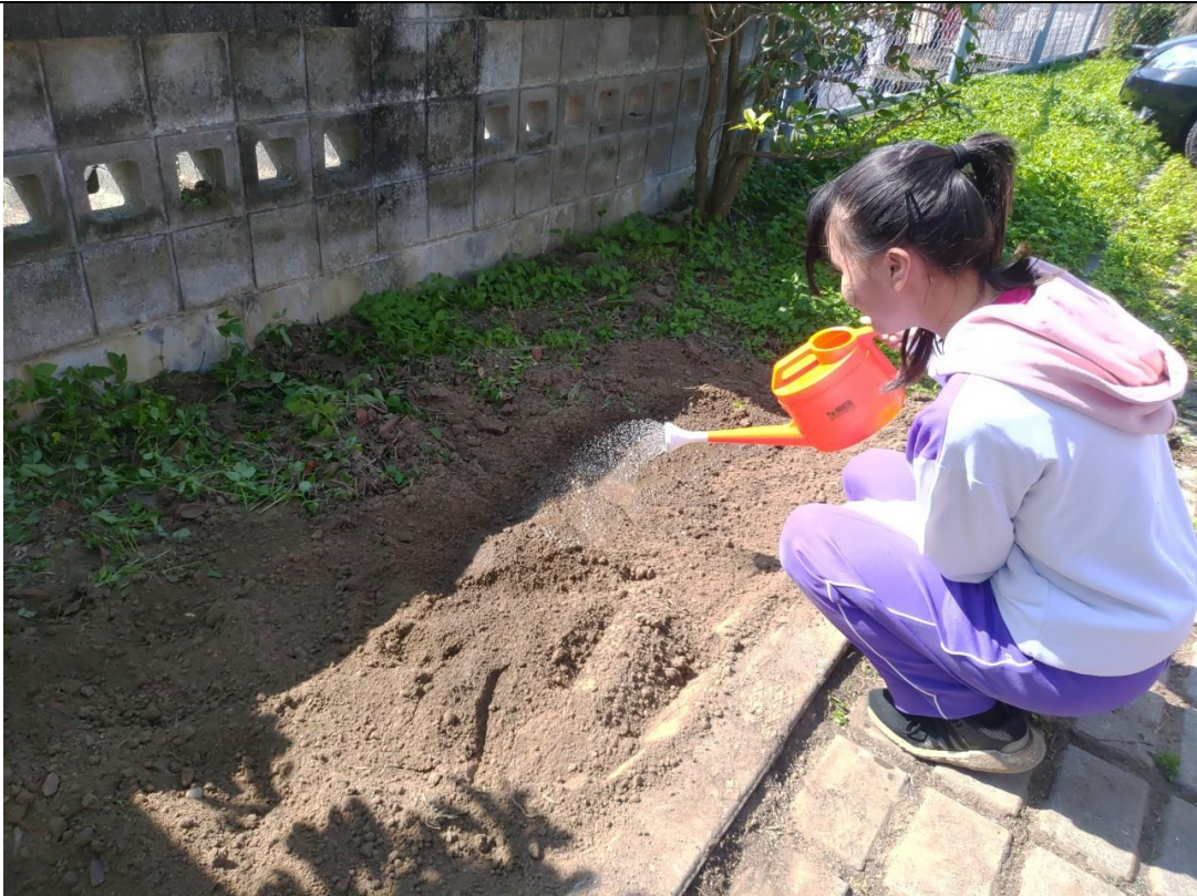
體驗教學法～帶領小小農夫進行澆水