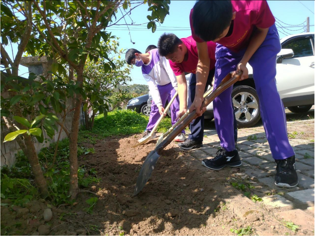
體驗教學法～帶領小小農夫進行鬆土