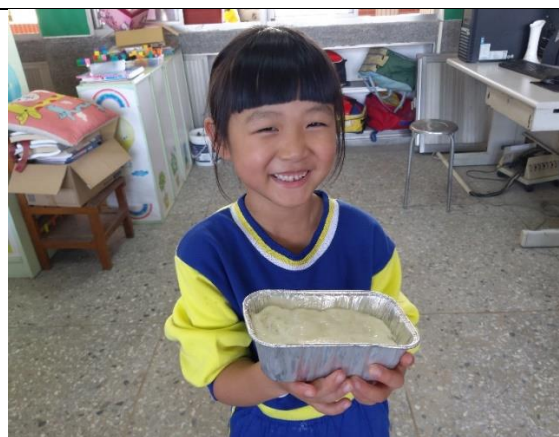
親手製作的蘿蔔糕~與家人分享