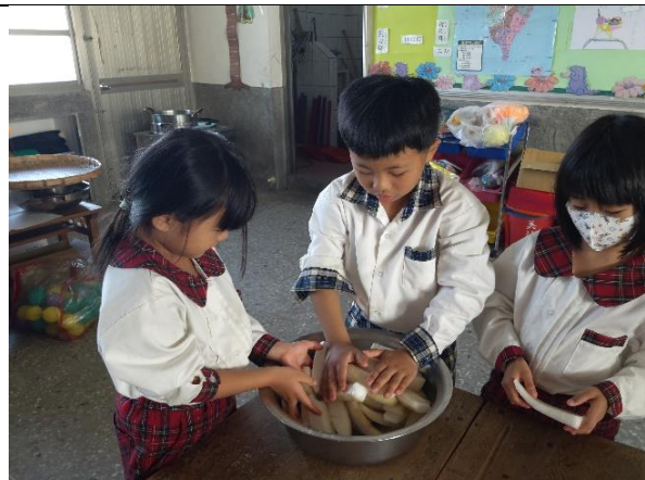
加鹽後，搓揉切成塊的蘿蔔