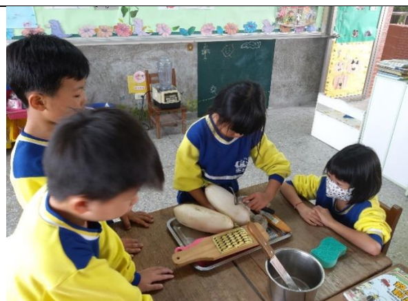
準備削皮刨絲製作蘿蔔糕