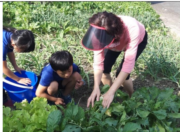
老師講解如何觀察成熟的蘿蔔