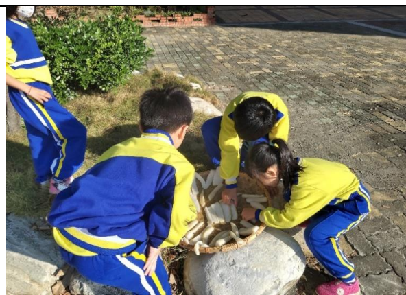
幫忙白精靈做日光浴