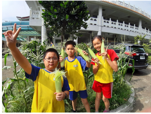
說明：健康無毒高品質