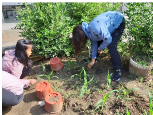
說明：每天安排值日生