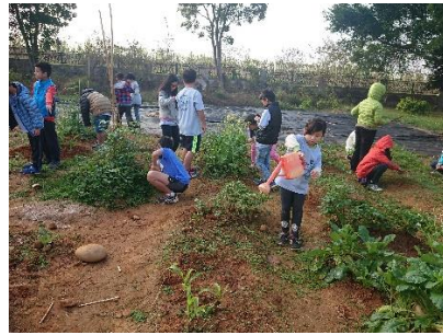
農地管理：觀察、拍照