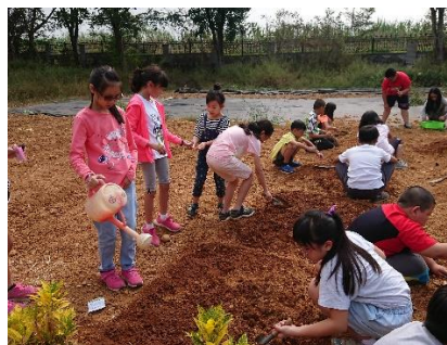
農地管理：澆水、除草