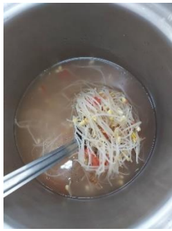
番茄黃豆芽排骨湯