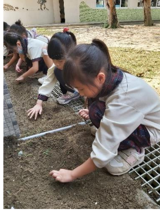
種下種子 挖個小洞，細心的種下小種子。