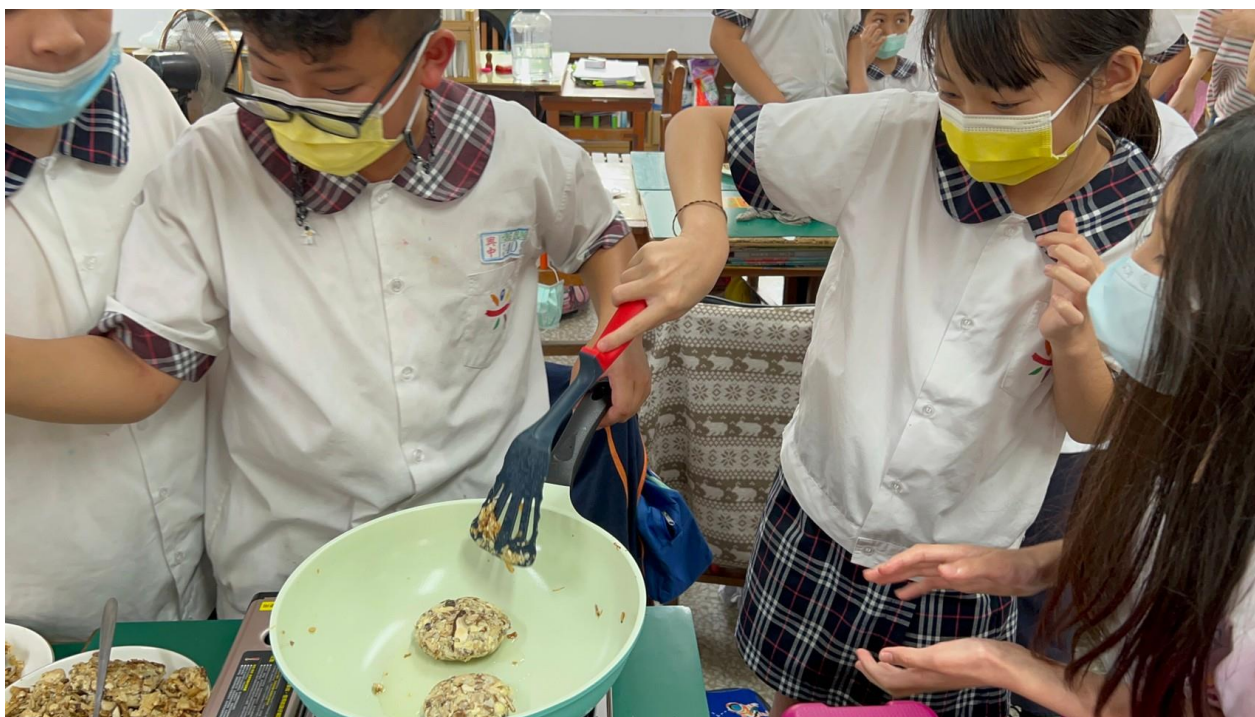
照片六：學生煎煮素漢堡排的情形