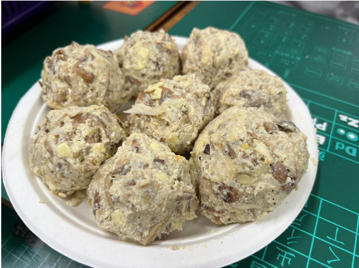
照片七：學生自己製作好的素漢堡排