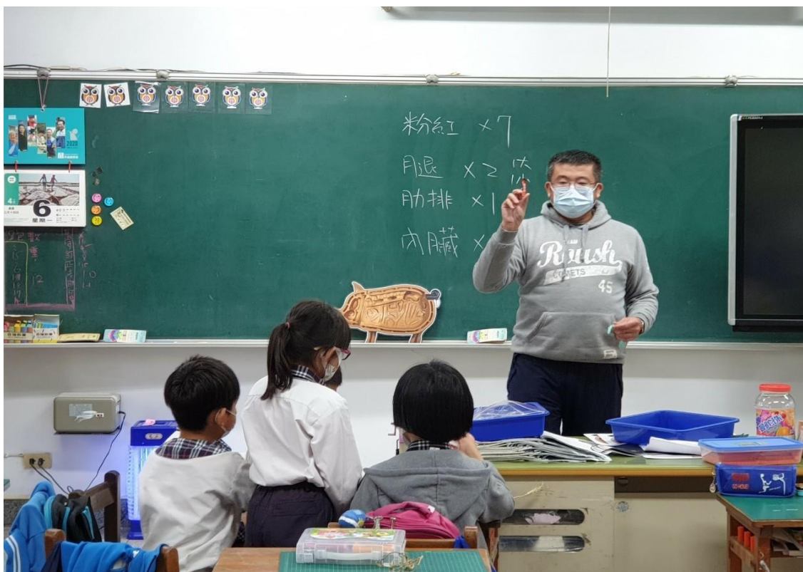
照片二：「豬肉與生活」上課情形：