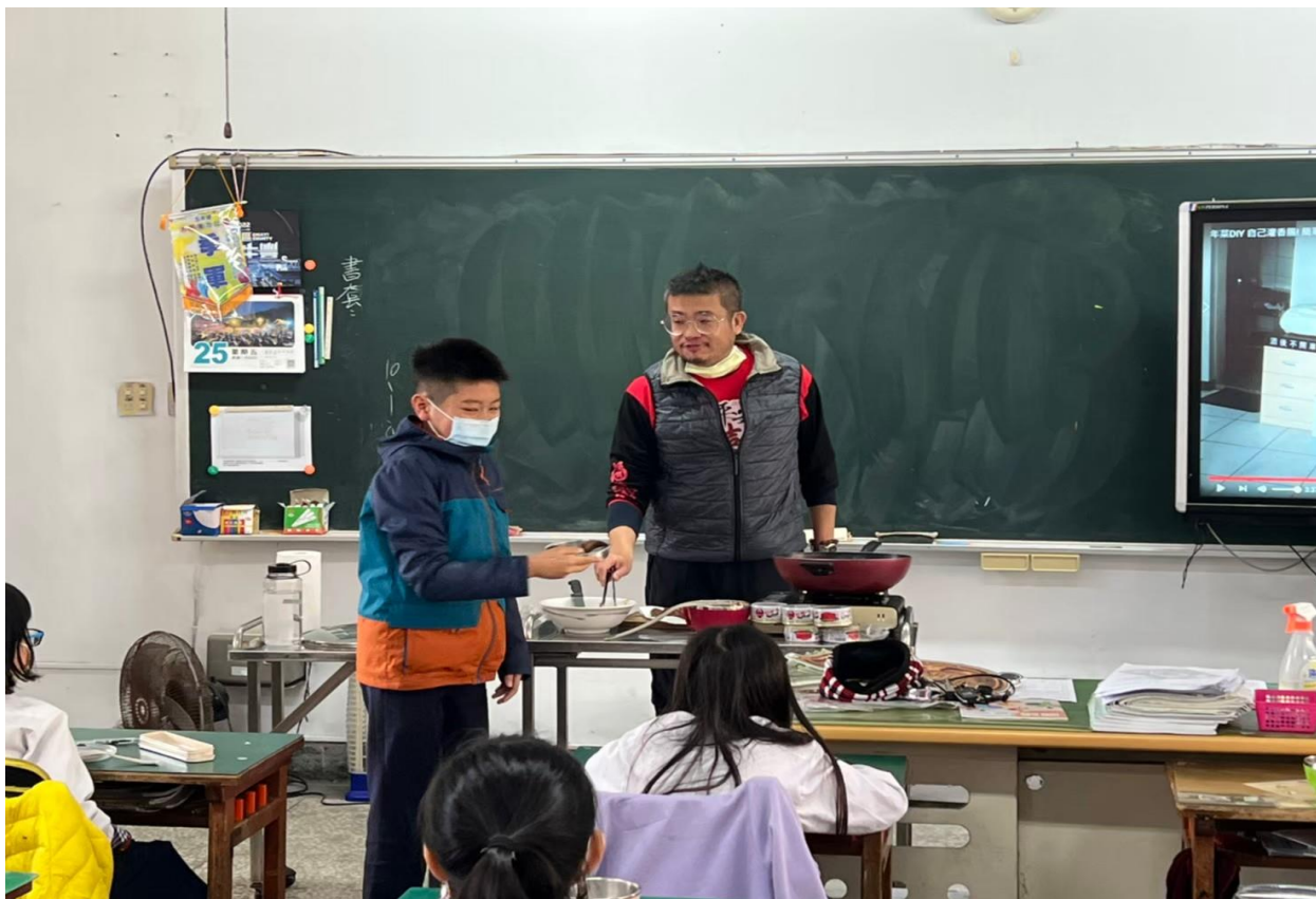
照片一：老師示範生熟食分開的操作流程情形。