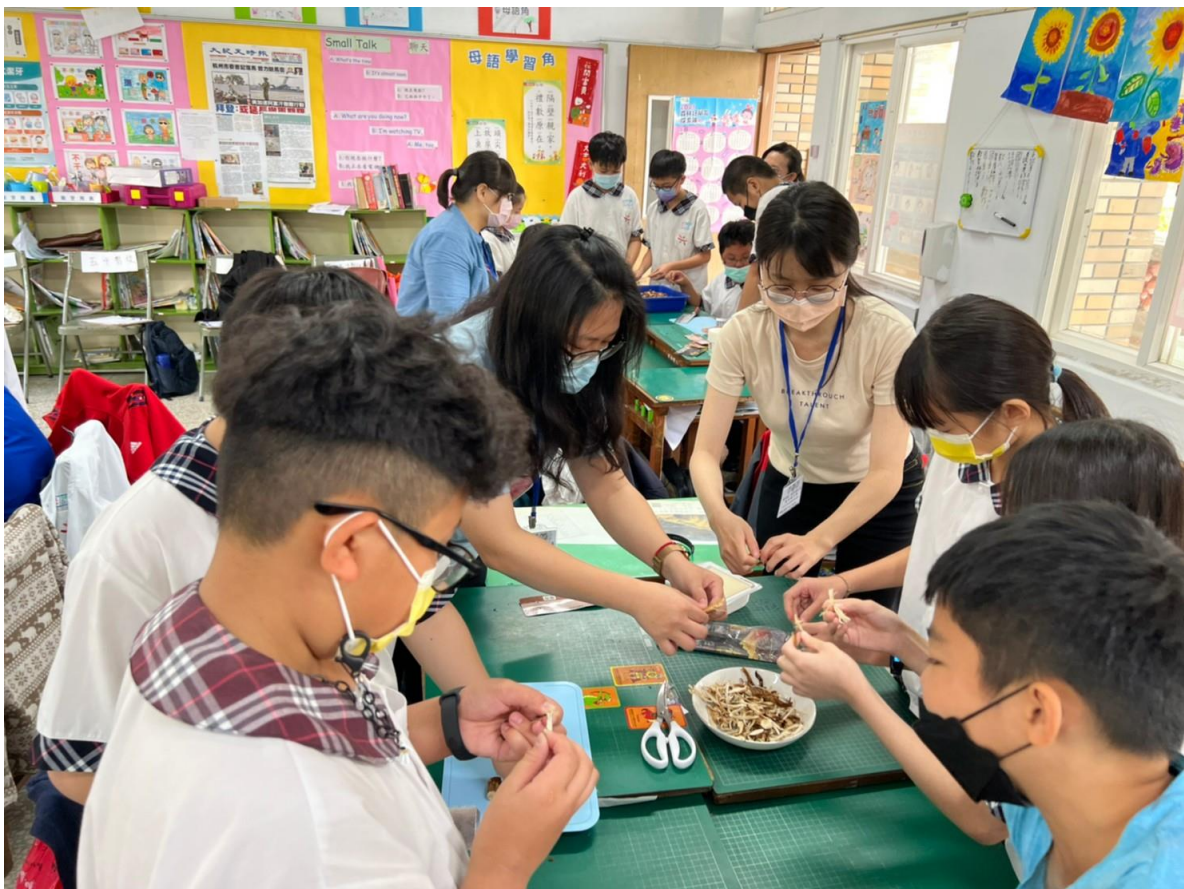
照片四：各組製作人造肉的情形