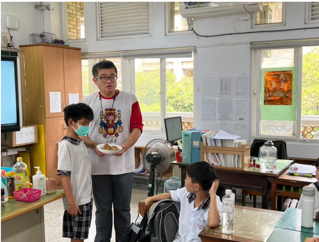
照片八：學生推薦自己組的素漢堡排的情形