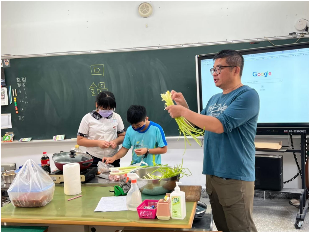
照片三：老師示範如何處理食材的情形