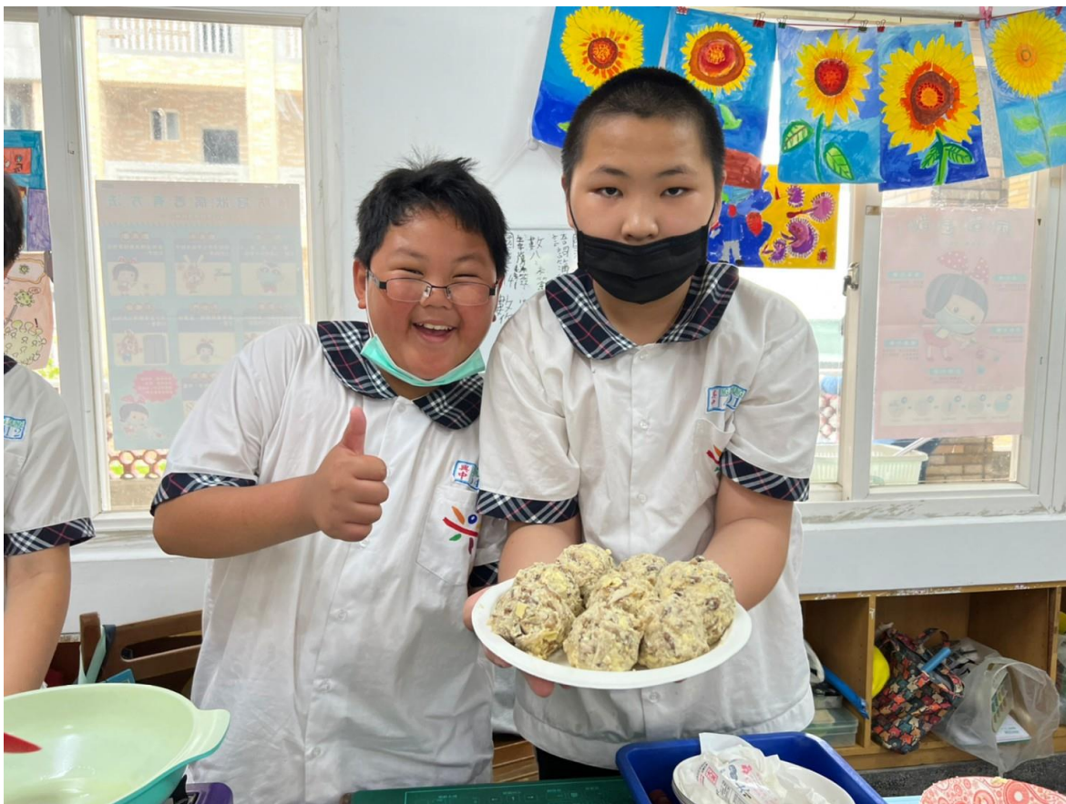
照片五：學生與自己製作的素漢堡排合照。