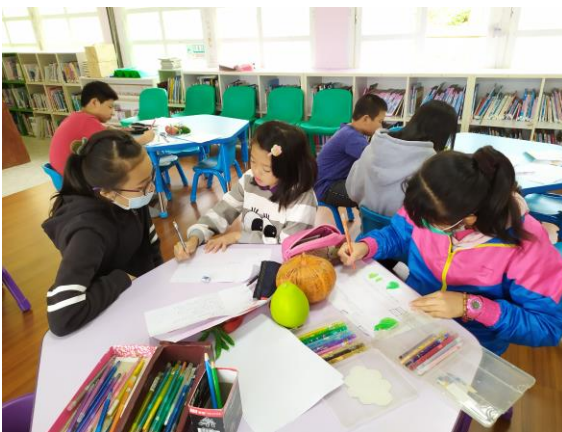
1091111 學生到圖書室尋找蔬果資料