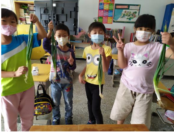
1091021 中低年級學生拿大蔥