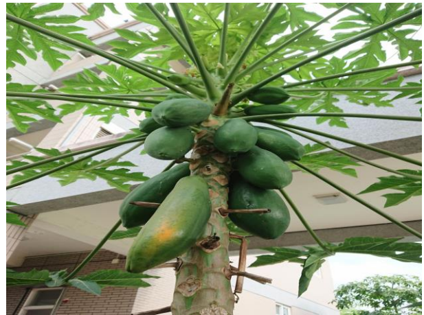
說明: 有一點點黃，快好了!