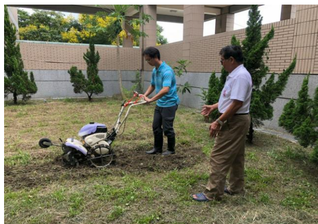
說明：影倫老師實際操作除草機