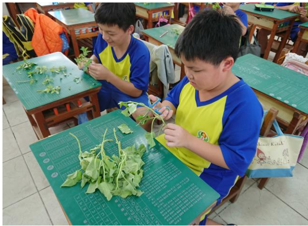
說明：大家一起來「揀菜」！不要的梗可以再拿去種喔！