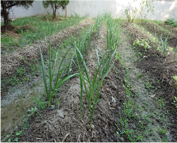
說明: 蒜一天一天長大了!