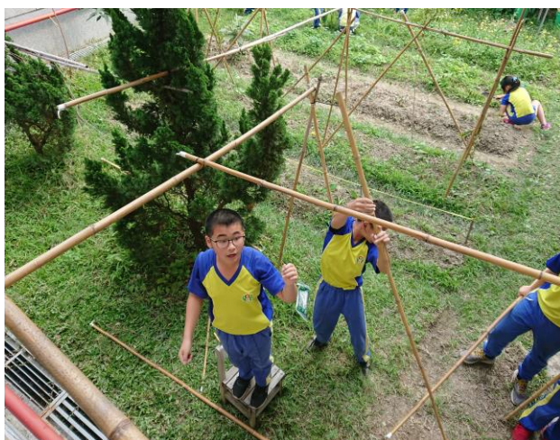
說明：我們又要搭棚架了！