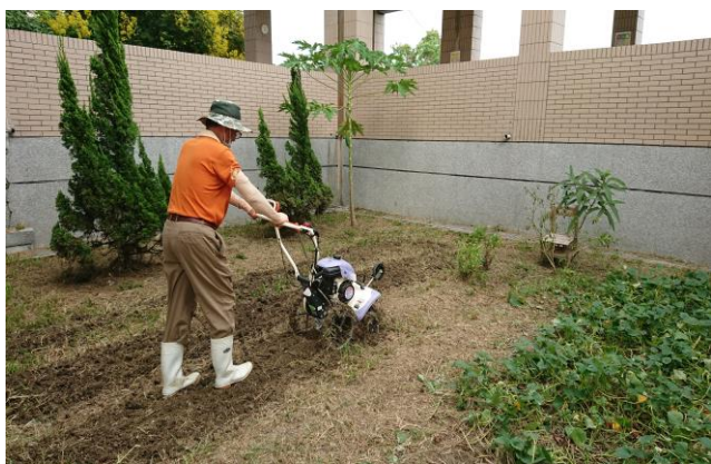
說明：社區家長示範使用除草機