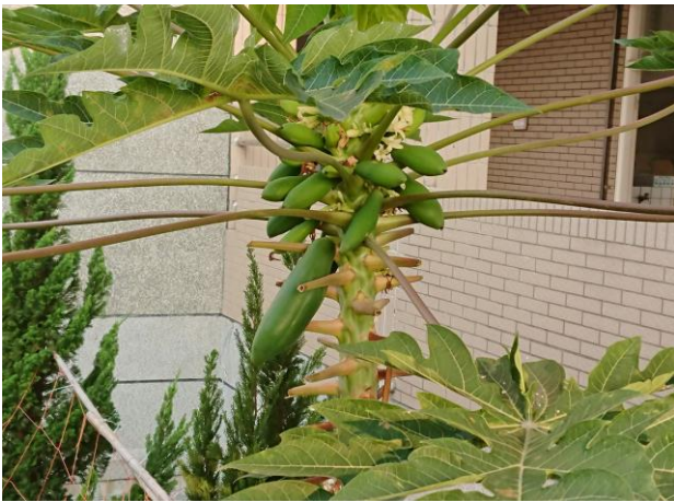
說明: 結實累累的木瓜媽媽。