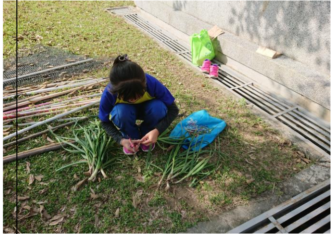
說明: 修剪蒜鬚，準備帶回家分享!