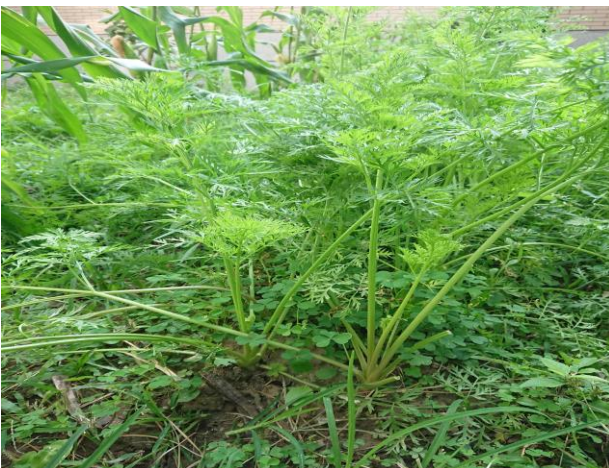
說明：沒錯！我就是兔寶寶最愛吃的紅蘿蔔！