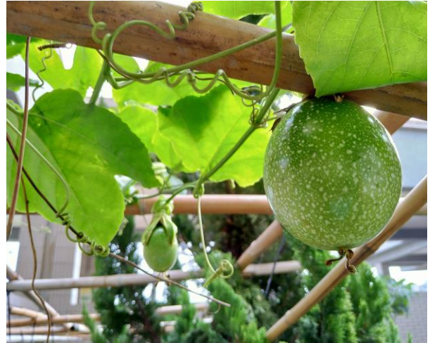
說明：哈哈~我就是百香果！