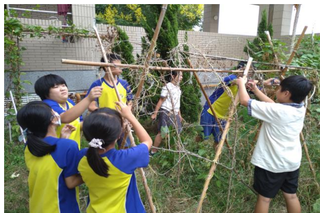
說明：拆除既有棚架