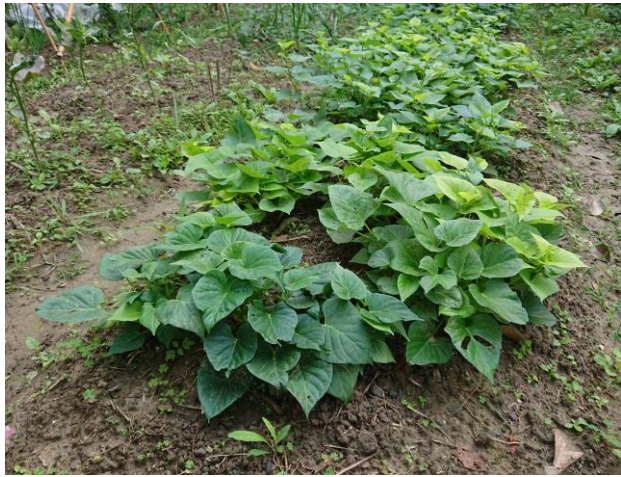
說明：最營養的地瓜葉。