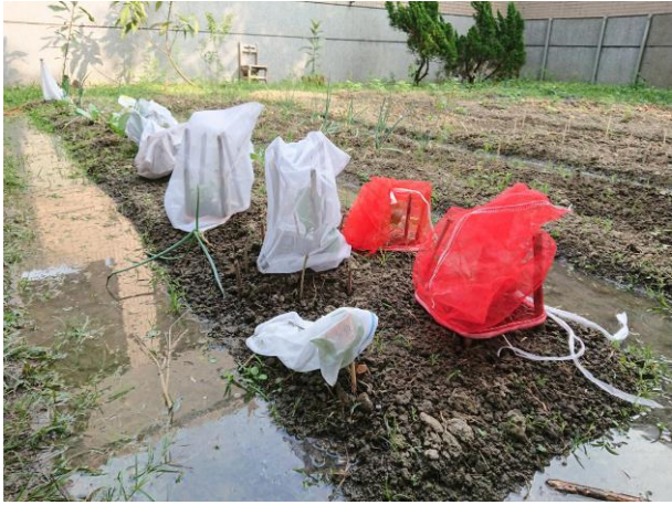
說明:小幼苗怕重重，需要保護網。