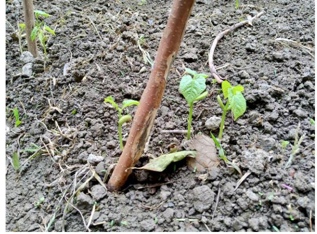
說明：原來是小豆苗！