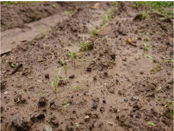
說明：小時候大家都長得很像吧！