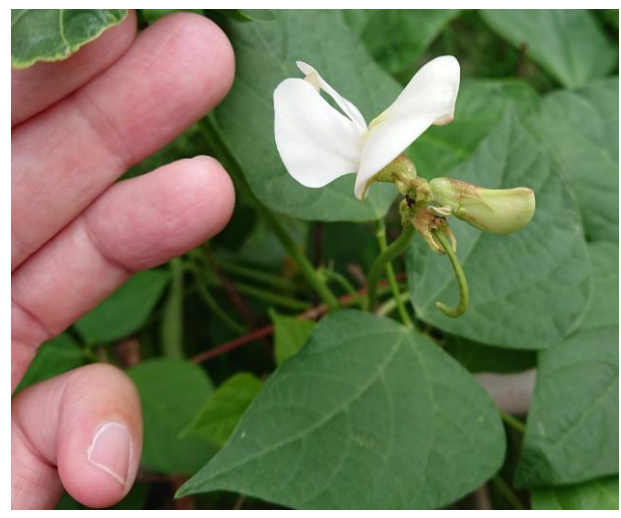
說明：開花了！再來就要長豆豆了。