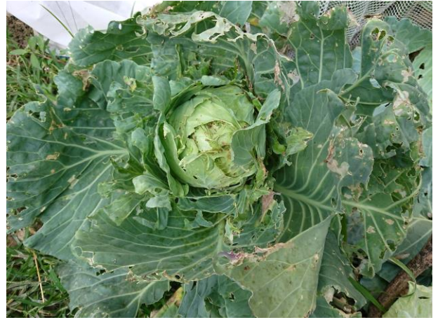
說明: 剛拿掉網子不久，就被蟲吃得精光的高麗菜!