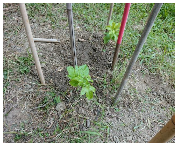
說明：知道我是誰嗎？