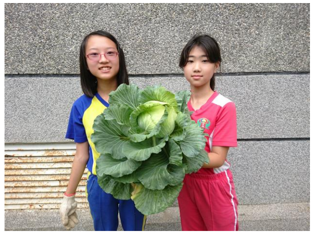
說明:豐碩的成果~大高麗菜!