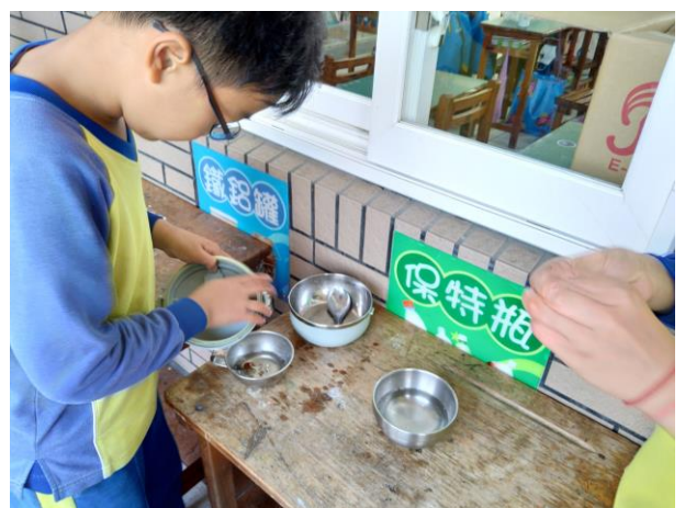
說明:看得出來我們在做什麼嗎?