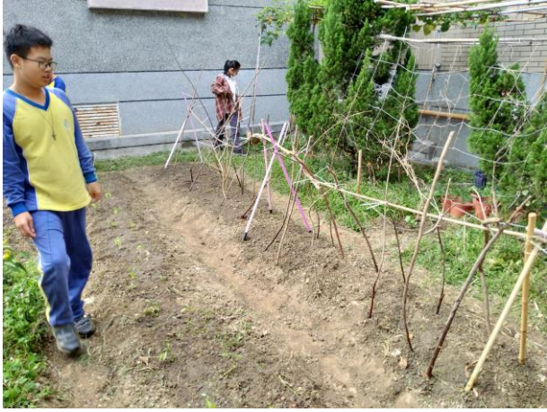
說明：搭棚架要種什麼呢？