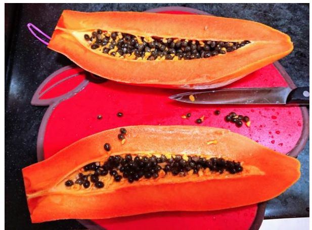
說明: 看起來好好吃喔!