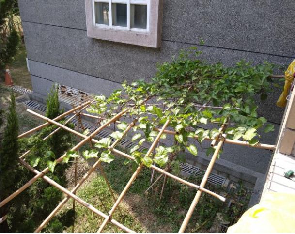
說明：我慢慢的爬到棚架上了！