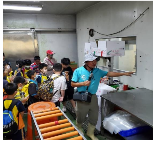
導覽解說白蝦急速冷凍過程