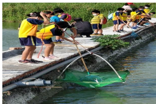
加油，我一定要得第一