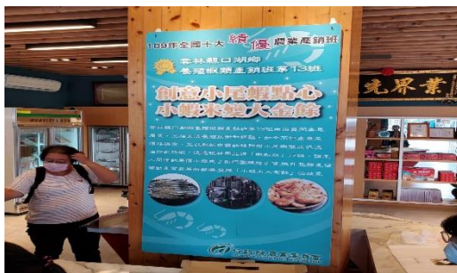
食農教育-漁村在地好食品