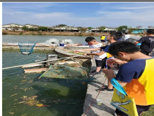
撈魚比賽，贏得有飲料喝，大 家玩得很快樂