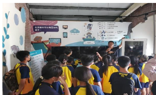
參觀好蝦寮男社-負責人為我們 導覽解說