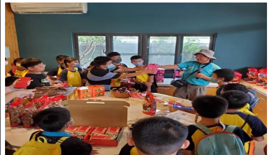
好吃又健康的在地漁食，人人愛