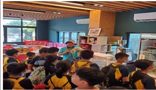
介紹白蝦產品與其他漁村產品