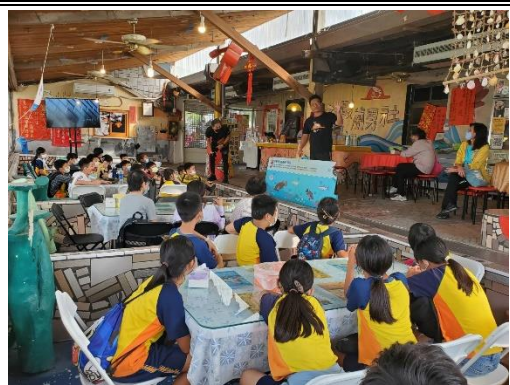
有關無毒白蝦好魚的講解