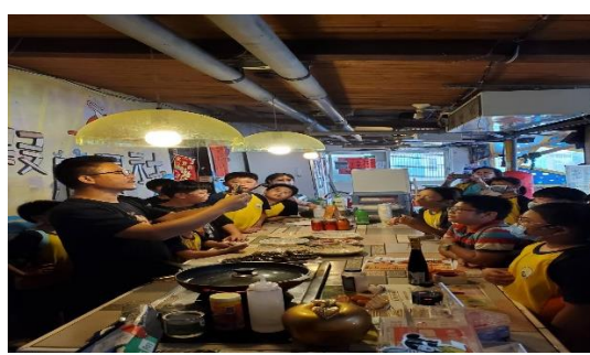
好蝦料理的實際操作