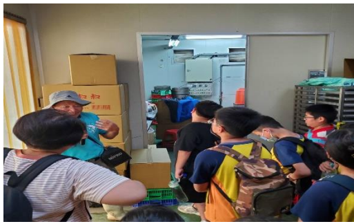
導覽解說冷凍白蝦包裝運送過程