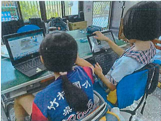
說明：學生在 WebIRS5 上的課文中找答案，做記號並回傳任務。