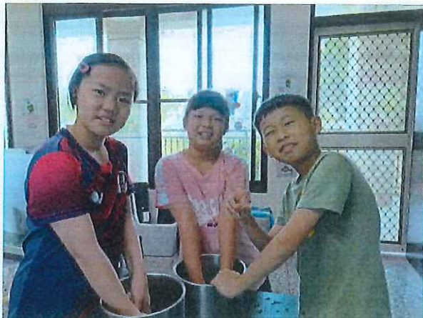
說明：學生體驗手洗愛玉