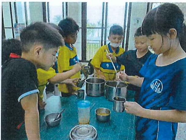
說明：學生組裝愛玉百香果