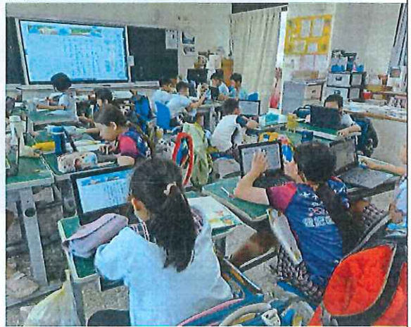
說明：學生運用 WebIRS5 數位軟體練習找段落大意