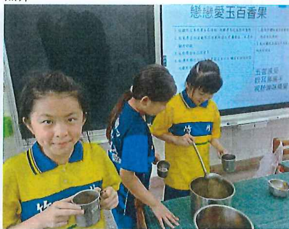
說明：學生開啟感官五覺，品嚐愛玉百香果