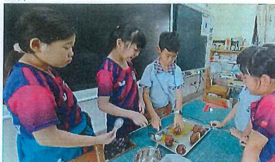
說明：學生體驗切百香果，準備百香果汁