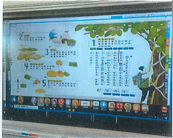
說明：學生運用 WebIRS5 數位軟體畫記難詞