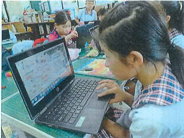
說明：學生運用 WebIRS5 數位軟體畫記難詞並討論