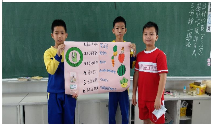
說明：學生上台發表