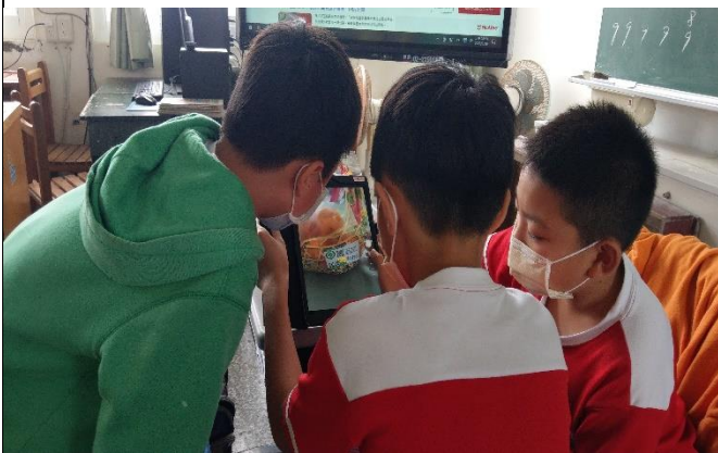
說明：學生練習掃描產銷履歷的 QR Code