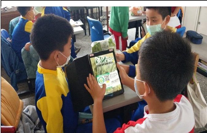
說明：學生練習掃描產銷履歷的 QR Code