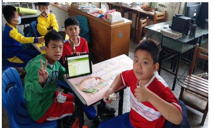
說明：學生依據產銷履歷內容製作海報