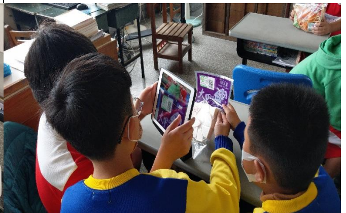
說明：學生練習掃描產銷履歷的 QR Code