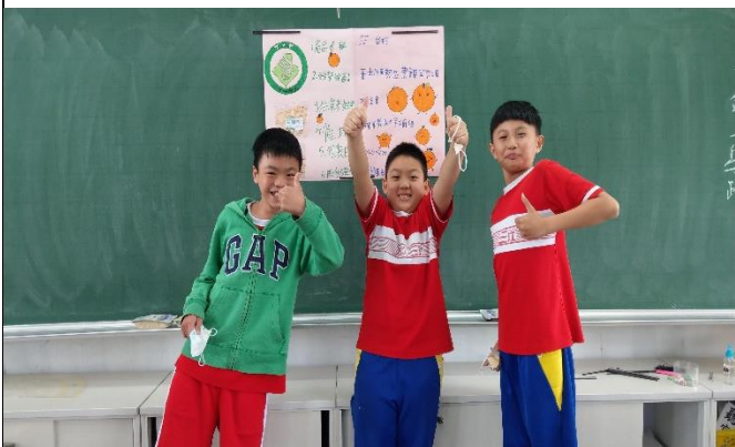
說明：學生上台發表