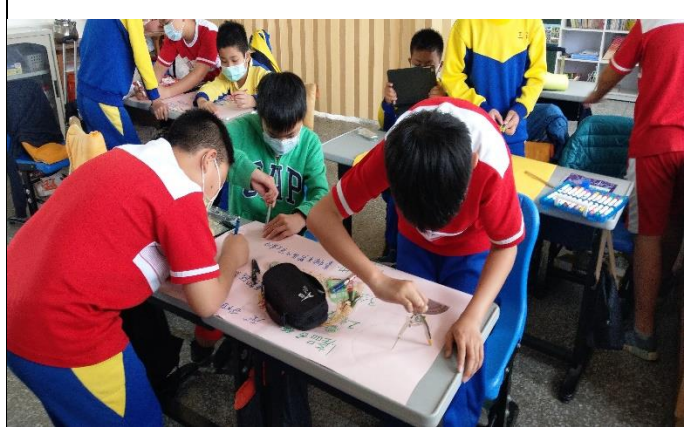
說明：學生利用圓規繪製產銷履歷標章