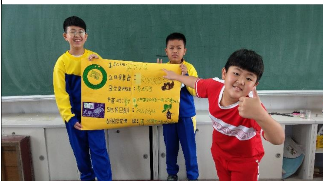
說明：學生上台發表