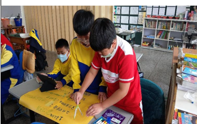
說明：學生利用圓規繪製產銷履歷標章