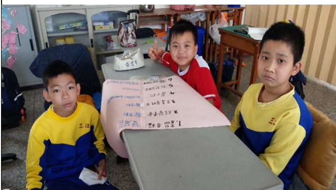
說明：學生依據產銷履歷內容製作海報