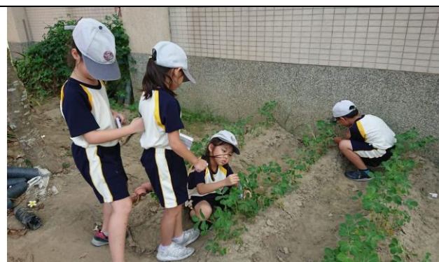
為成長的小花生添加營養劑，量一量小花生長高了多少。