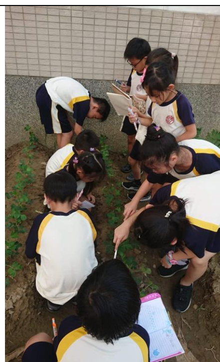
觀察記錄小花生成長的變化。