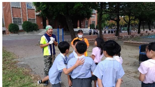
照片說明：鈞澤青農指導農事