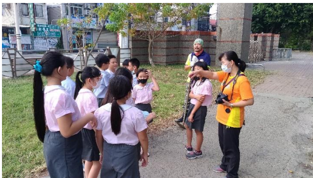
照片說明：鈞澤青農指導農事