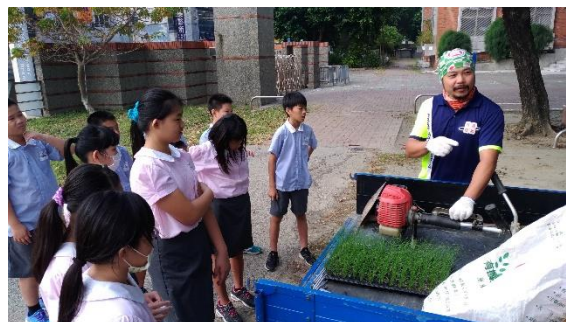
照片說明：鈞澤青農指導農事