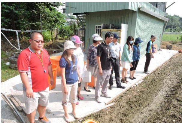
照片說明：學員們專注聆聽中