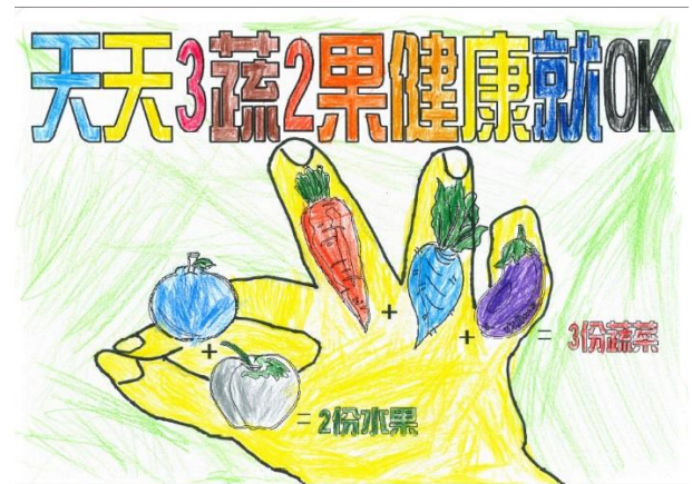
照片說明：學生彩繪學習單，建立健康概念