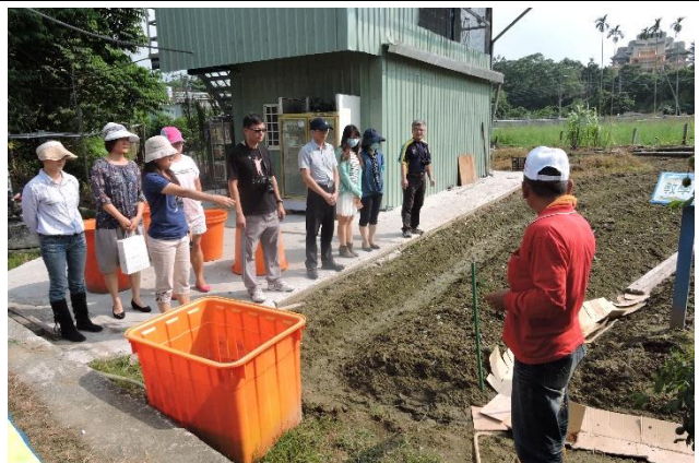
照片說明：學員提出問題