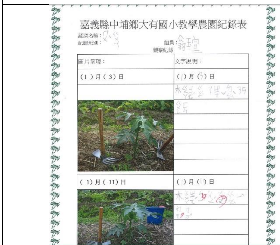
照片說明：一年級小朋友也是觀察入微呢