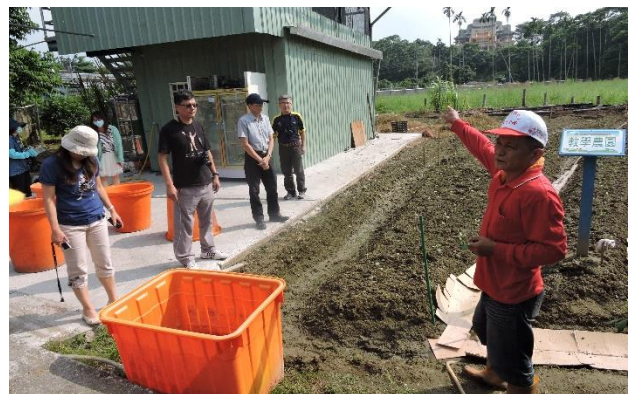
照片說明：講師解說如何進行病蟲害防制