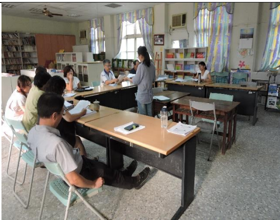
照片說明：共同備課及議課