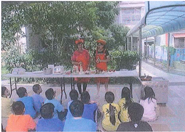
說明：在地食材融入料理