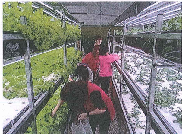
說明：社區大學植物工廠參訪