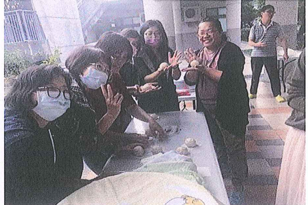
說明：教師積極參與研習