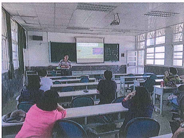
說明：請社區大學講師協助進行生態有機菜園的建置教學