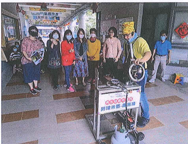
說明：邀請彰化青農進行傳統米食文化體驗