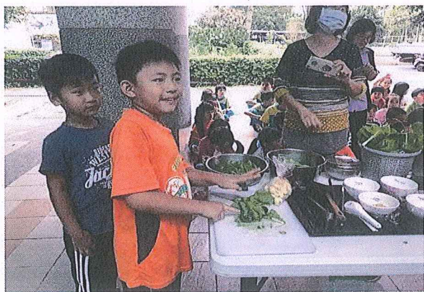
說明：實際體驗採收、料理完整過程