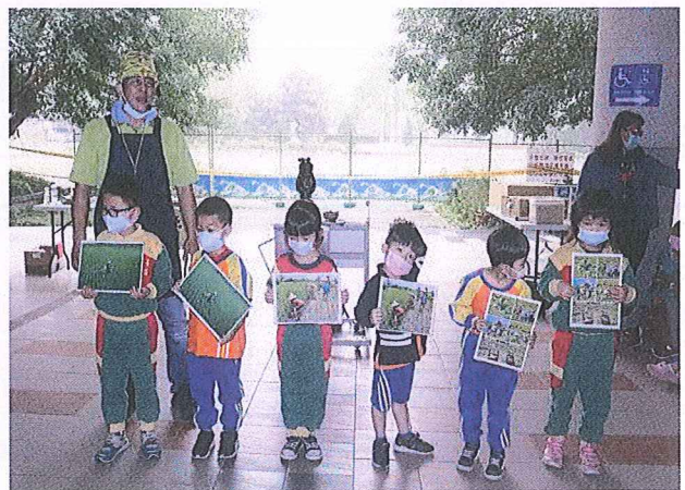
說明：解說米食種植生產過程