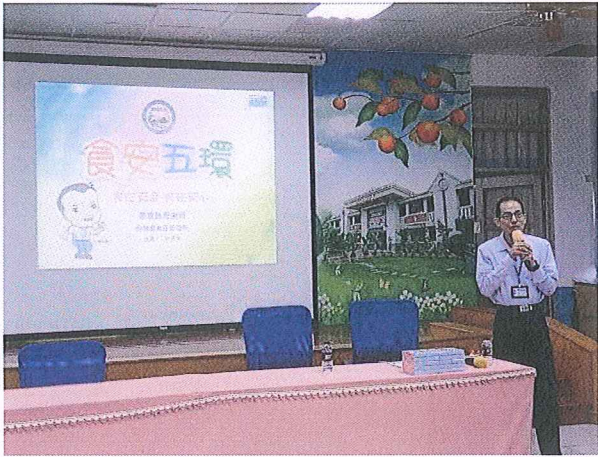
說明：食品安全教師研習營