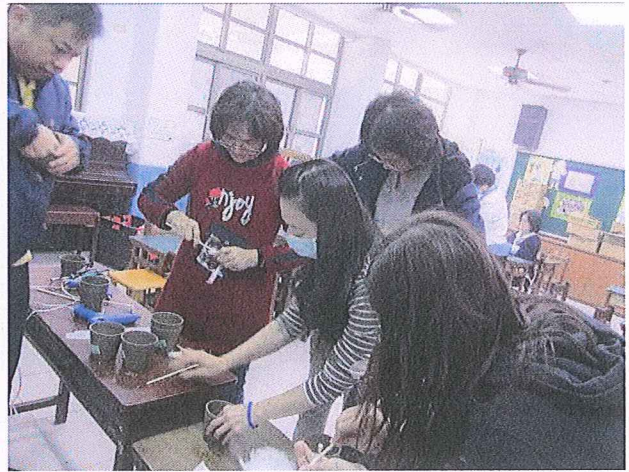
說明：免澆水種菜盆製作