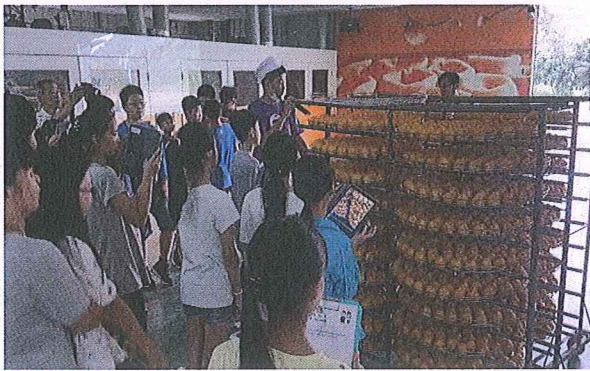
說明：學生農會柿餅參觀課程