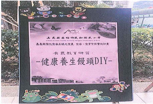
說明：食農校育教師研習