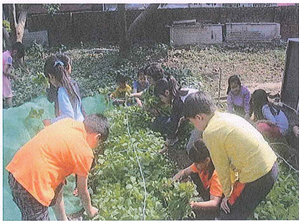
說明：學生體驗採收蔬菜