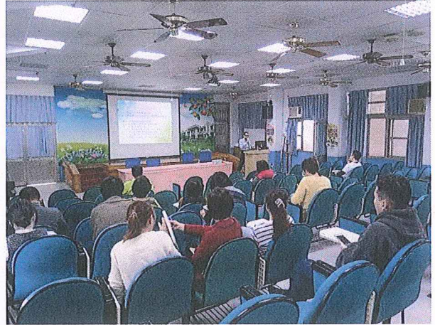
說明：邀請衛生局蒞校研習指導