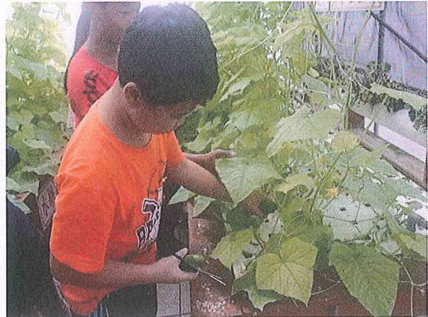
說明：魚菜共生採收小黃瓜