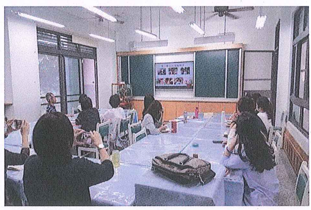
說明：積極進行校內課程執行分享