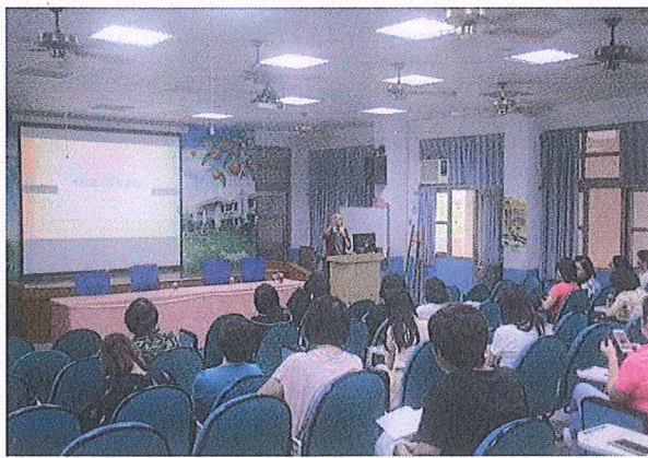
說明：積極進行校內課程執行分享