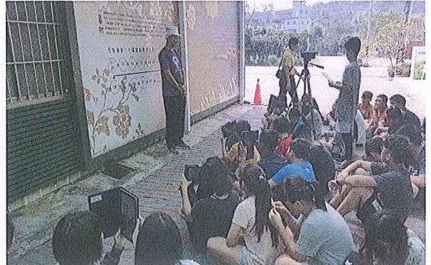
說明：學生參觀後的訪談