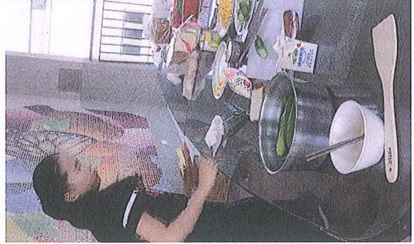
說明：再將配料與自採小黃瓜作成三明治