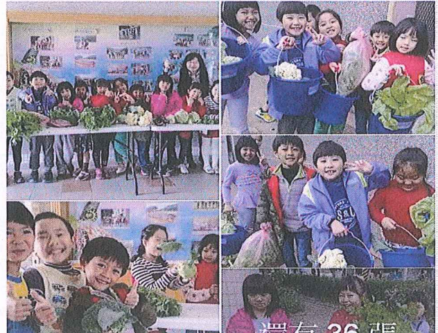
說明：利用學校臉書粉絲團進行食育觀念的宣導。

懷舊菜園大豐收-收成的喜悅 今天趁著雨還沒下，一、二年級的小朋友趕緊到菜園搶收蔬菜。哇！今天真是大豐收，有高麗菜、山東大白菜、茼蒿、山茼蒿、白綠花椰菜、芹菜、茄子、青椒、茼蒿、芥菜，好多樣哦。宛如是一個小型菜市場，老師們一一向學生解說各項蔬菜名稱，同時，讓學生練習拍賣。食農教育讓孩子更懂得惜福。