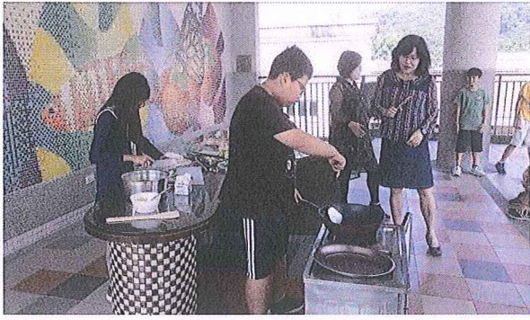
說明：指導學生自己煎荷包蛋