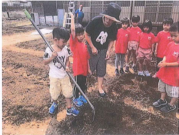
說明：校園空間活化建置園圃