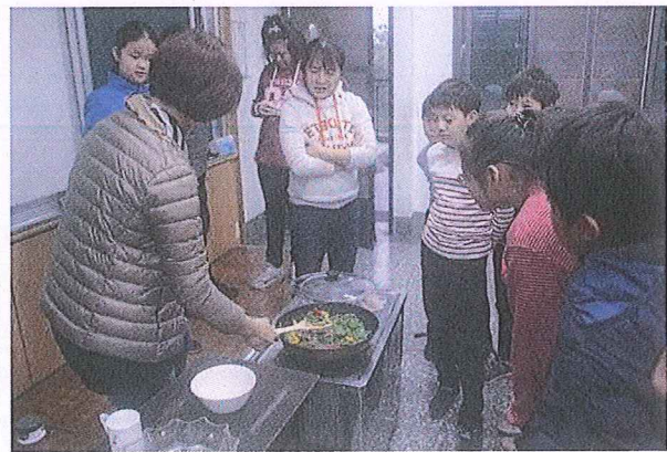
說明：採收青椒作成料理