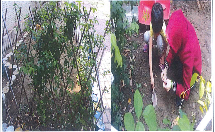
說明：開心農場-種蝶豆花、種蔥