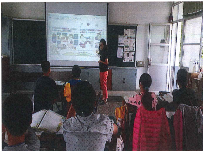
說明：宣導防範非洲豬瘟