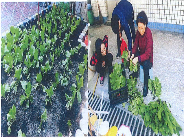
說明：食農教育-開心農場種 A 菜、午餐加菜