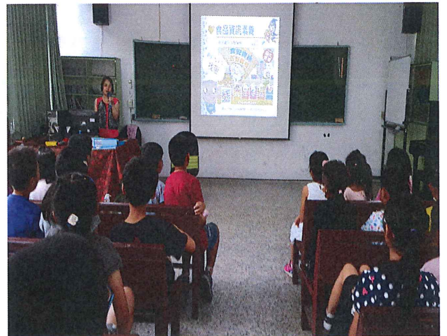
說明：衛生所稽查員宣導-「食品資訊素養」