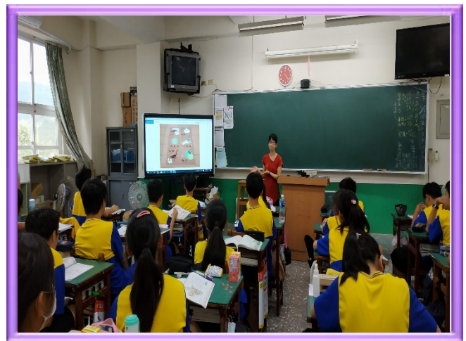
認識元長鄉鹿北社區的農產業發展