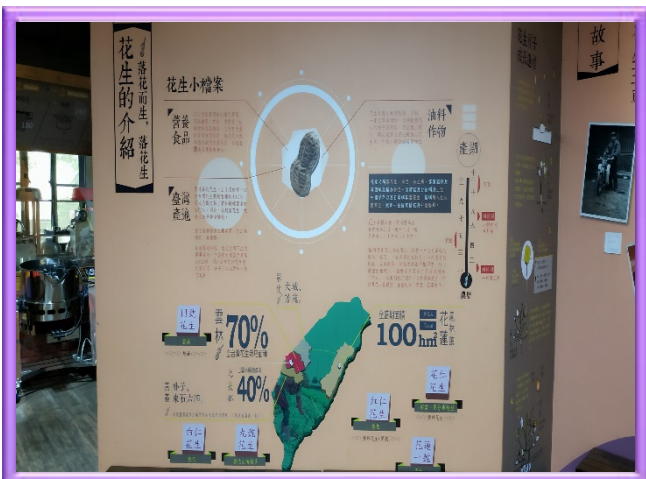
花生觀光工廠的花生介紹檔案