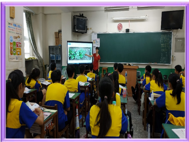
雲林縣元長鄉花生田，植株外在形貌實拍