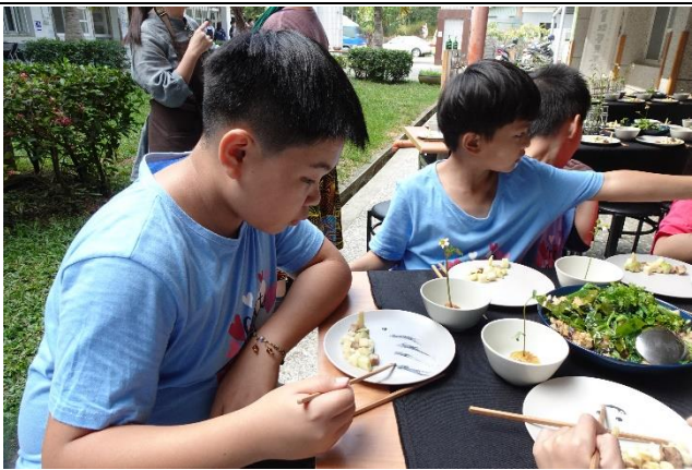
照片說明：用餐前，先幫餐具裝飾一番