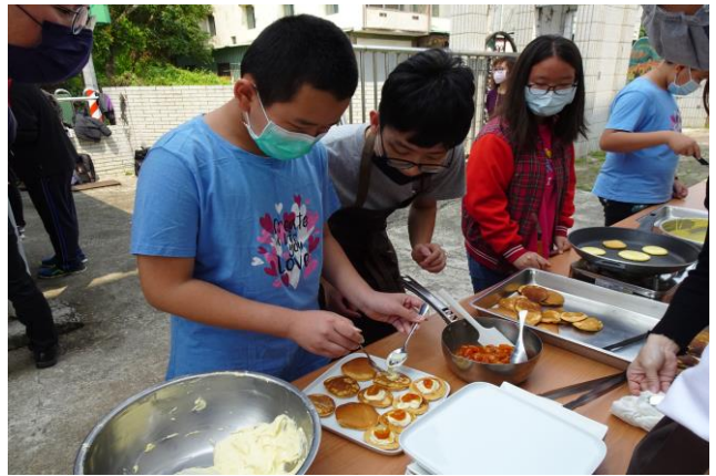
照片說明：阿嬤的鹹酸甜(甜品)