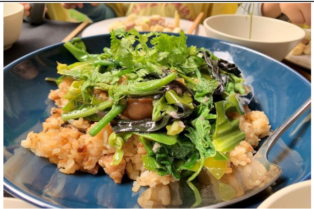
照片說明：烹飪食物上桌