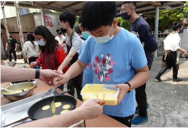
照片說明：鬆餅製作