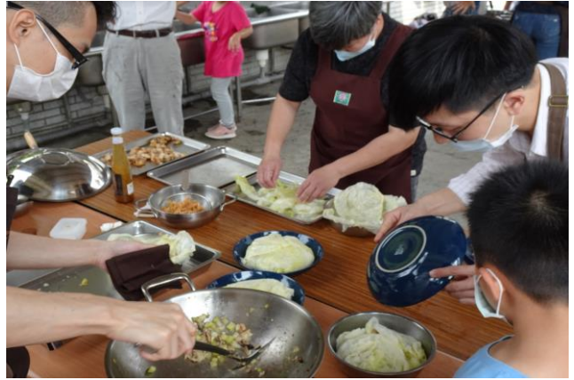
照片說明：高麗菜封製作