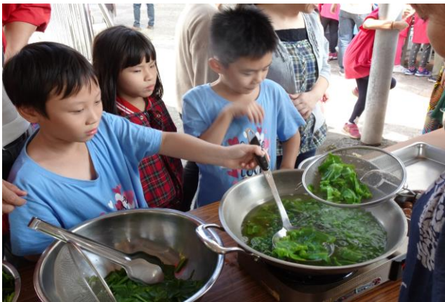
照片說明：水煮青菜