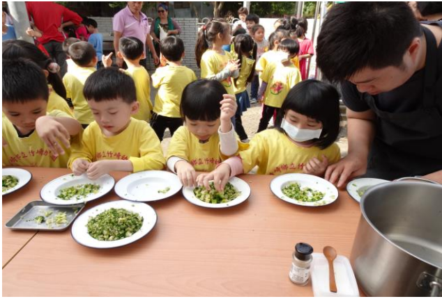
照片說明：邀請幼兒園小朋友一同參與