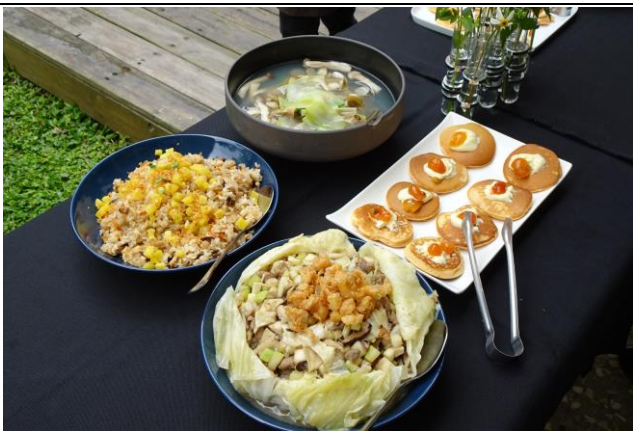
照片說明：烹飪食物上桌