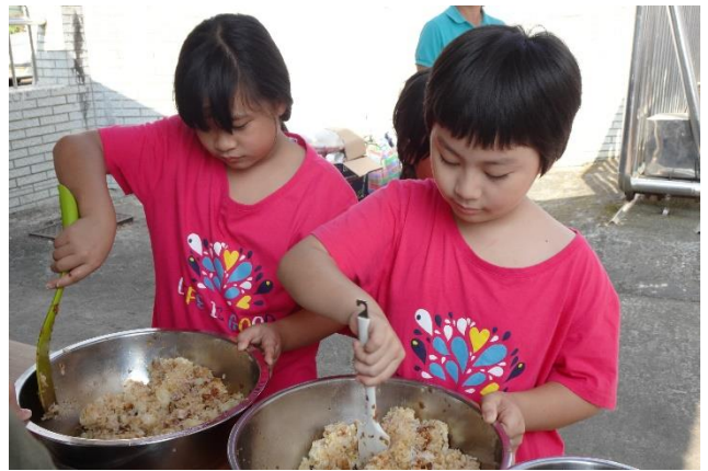
照片說明：香噴噴的野菜炊飯準備中