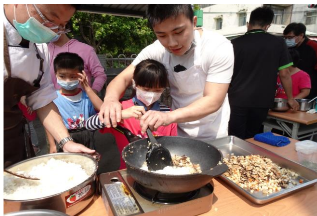
照片說明：竹筍香菇炒飯製作中