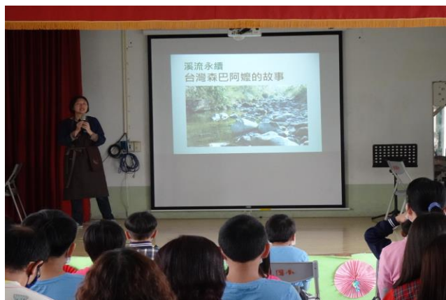
照片說明：食農教育