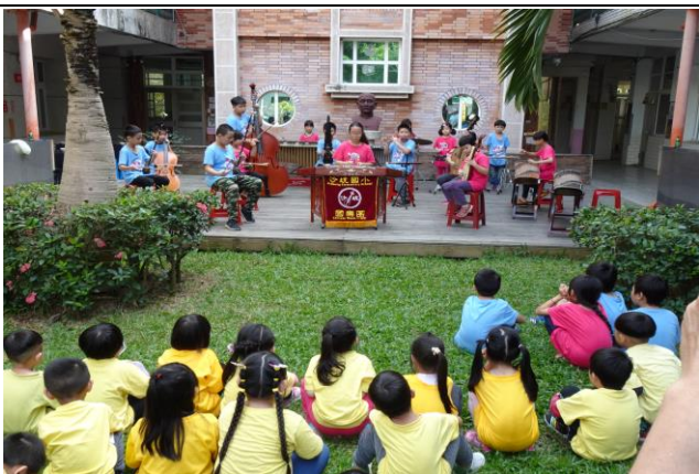
照片說明：餐前演奏