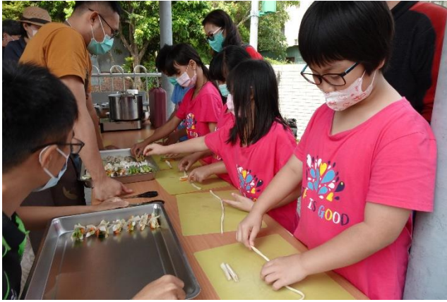
照片說明：瓠仔結製作