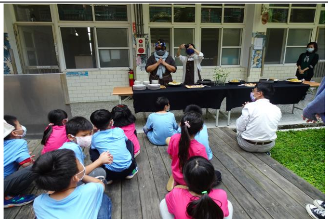
照片說明：感恩儀式及餐桌禮儀說明