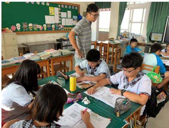
照片說明：食的健康-健康體位教學