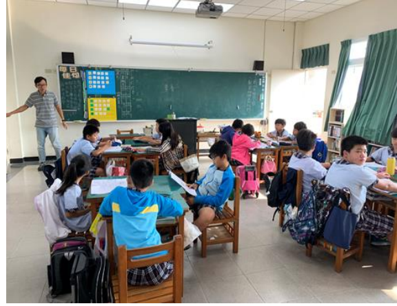
照片說明：食的健康-健康體位教學