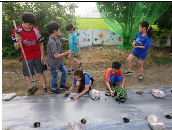
照片說明：學生親自動手種植秋葵