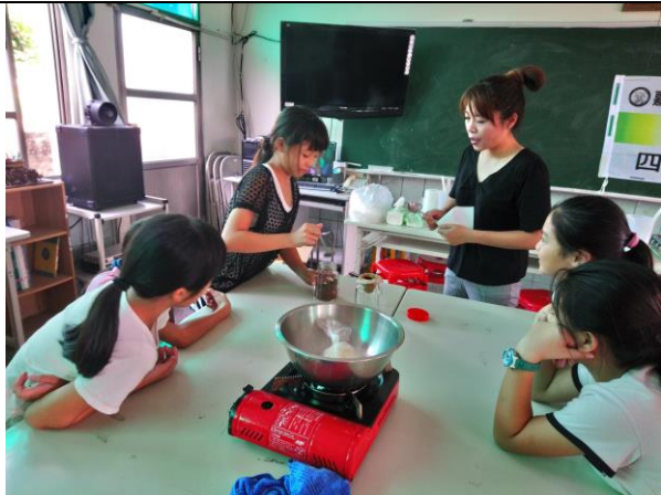
照片說明：秋葵果凍製作—過濾秋葵咖啡