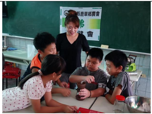
照片說明：秋葵果凍製作—磨秋葵豆