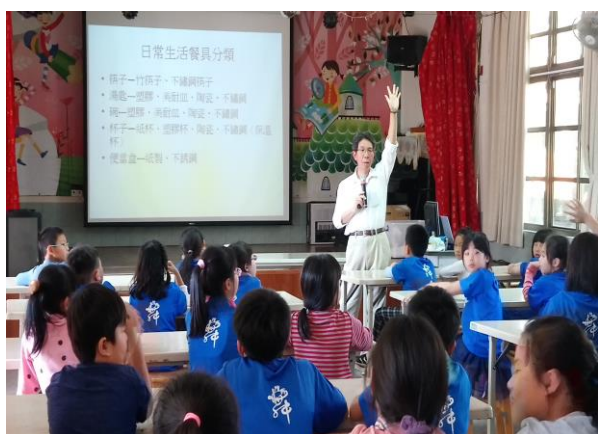
照片說明：免洗餐具的介紹