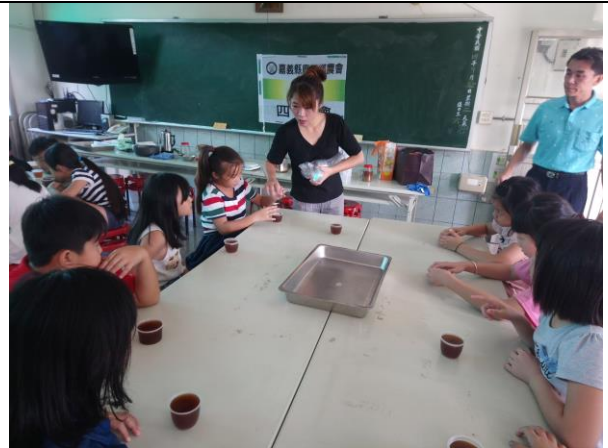
照片說明：秋葵果凍製作—秋葵果凍完成