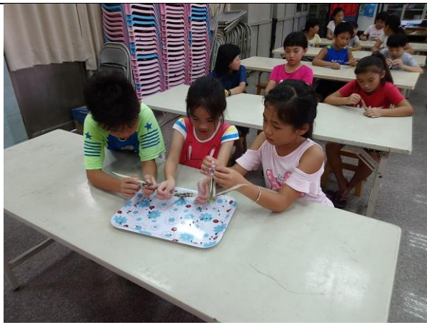
照片說明：將曬乾秋葵豆取下