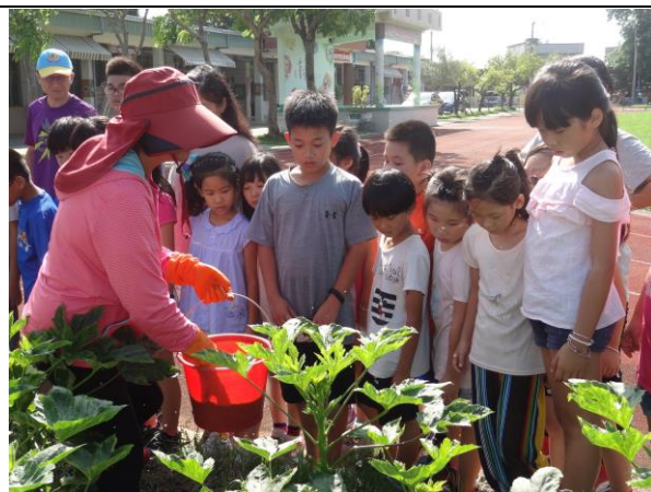
照片說明：達人介紹施肥注意事項