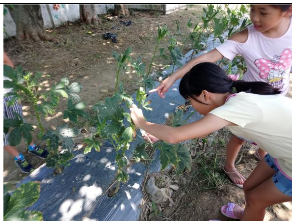
照片說明：動手摘秋葵