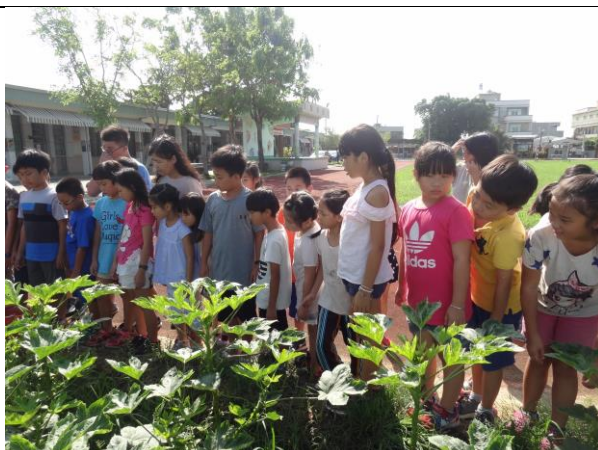
照片說明：學生觀察秋葵生長