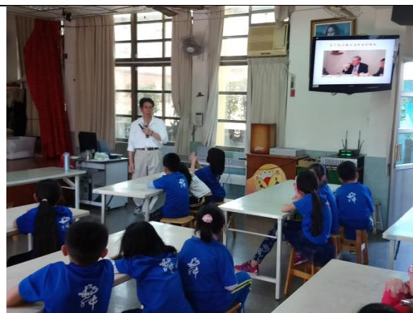
照片說明：師生一同聆聽食安教育講座