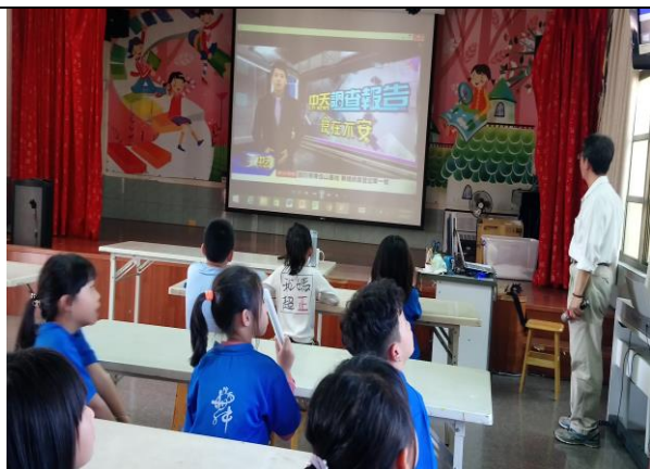
照片說明：影片介紹食安問題